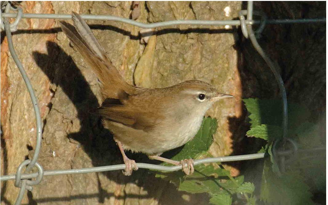
579 Cetti's Zanger / Cetti's Warbler Cettia cetti , Dordtse Biesbosch, Zuid-Holland, 10 oktober 2006 (Hans Gebuis)