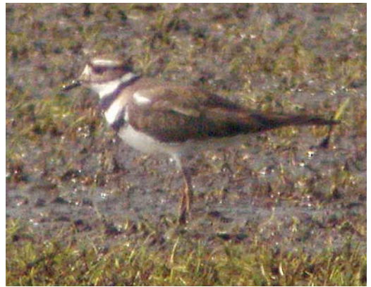
488 Buff-breasted Sandpiper / Blonde Ruiters Tryngites subruficollis , juvenile, Harpel, Groningen, 2 October 1982 (Nico de Vries) 489 Red-necked Stint / Roodkeelstrandloper Calidris ruficollis , adult, Wagejot, Texel, Noord-Holland, 24 July 2005 (René Pop) 490 Terek Sandpiper / Terekruiter Xenus cinereus , Wagejot, Texel, Noord-Holland, 15 May 2005 (René Pop) 491 Terek Sandpiper / Terekruiter Xenus cinereus , De Braakman, Zeeland, 7 June 2005 (Mark S J Hoekstein) 492 Killdeer / Killdeerplevier Charadrius vociferus , second calendar-year, Rottige Meente, Overijssel, 4 April 2005 (Roland Jansen) 493 Killdeer / Killdeerplevier Charadrius vociferus , second calendar-year, Rottige Meente, Overijssel, 4 April 2005 (Leo J R Boon/Cursorius)