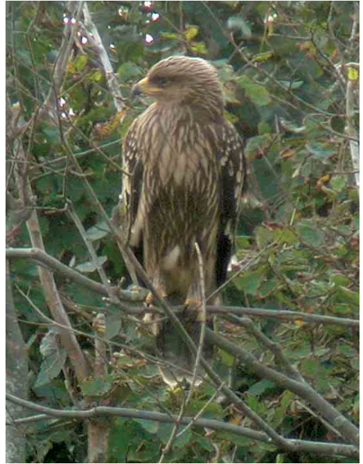
483 Lesser Spotted Eagle / Schreeuwarend Aquila pomarina , juvenile, Domburg, Zeeland, 24 September 2005 (Pim A Wolf)

24-25 September, Domburg, Westkapelle, Oostkapelle and Grijpskerke, Veere , Zeeland, juvenile, photograph-