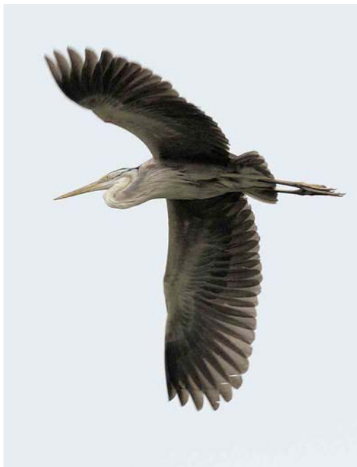
519 American Great Egret / Amerikaanse Grote Zilverreiger Casmerodius albus egretta , Povoação, São Miguel, Azores, 30 September 2006 (Daniele Occhiato) 520 Bourne's Heron / Kaapverdise Purperreiger Ardea bournei , Liberão, Santiago, Cape Verde Islands, 15 October 2006 (Edwin Winkel) 521 Boreal Eider / Noordelijke Eider Somateria mollissima borealis , immature male, Fair Isle, Shetland, Scotland, 8 October 2006 (Rebecca Nason)