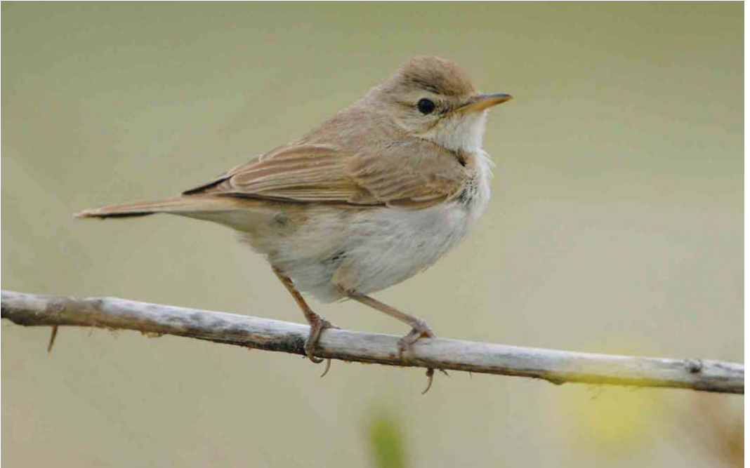
577 Kleine Spotvogel / Booted Warbler Acrocephalus caligatus , Maasvlakte, Zuid-Holland, 9 oktober 2006 (Roland Jansen)