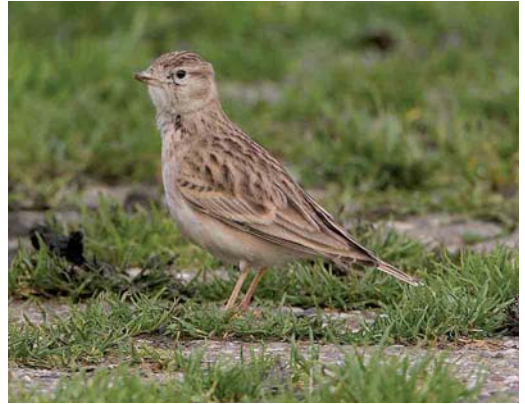
570 Raddes Boszanger / Radde's Warbler Phylloscopus schwarzi , Kennemerduinen, Bloemendaal, Noord-Holland, 13 oktober 2006 571 Veldrietzanger / Paddyfield Warbler Acrocephalus agricola , Meijendel, Zuid-Holland, 14 oktober 2006 572 Siberische Boompieper / Olive-backed Pipit Anthus hodgsoni , Oosterreeweg, Schiermonnikoog, Friesland, 15 oktober 2006 573 Kortteenleeuwerik / Greater Short-toed Lark Calandrella brachydactyla , Oosterend, Terschelling, Friesland, 25 oktober 2006

RALLEN TOT ALKEN Op 8 september werd een eerstejaars Klein Waterhoen Porzana parva gevangen en geringd in het Verdrongen Land van Saeftinghe, Zeeland. Kraanvogels Grus grus trokken door vanaf 12 oktober en vooral op 16 oktober werden grote groepen waargenomen, zoals ten minste 113 over Epen, Limburg, en meer dan 1000 over Maastricht, Limburg. Een Steltkluit Himantopus himantopus werd op 7 oktober gemeld op het Landje van Naber bij Hoorn, Noord-Holland. De Steppevorkstaartplevier Glareola nordmanni van de omgeving van Ransdorp werd weer gezien van 13 tot 18 september. Van 14 tot 20 oktober verbleef een exemplaar bij Eemnes, Utrecht. Ongedetermineerde vorkstaartplevieren vlogen op 17 oktober over natuurontwikkelingsgebied Willeskop, Utrecht, en bij telpost Brobbelbies bij Uden, Noord-Brabant. Er werden tot 13 oktober nog c 70 Morinelplevieren Charadrius morinellus gemeld. Vermeldenswaard zijn twee exemplaren aan