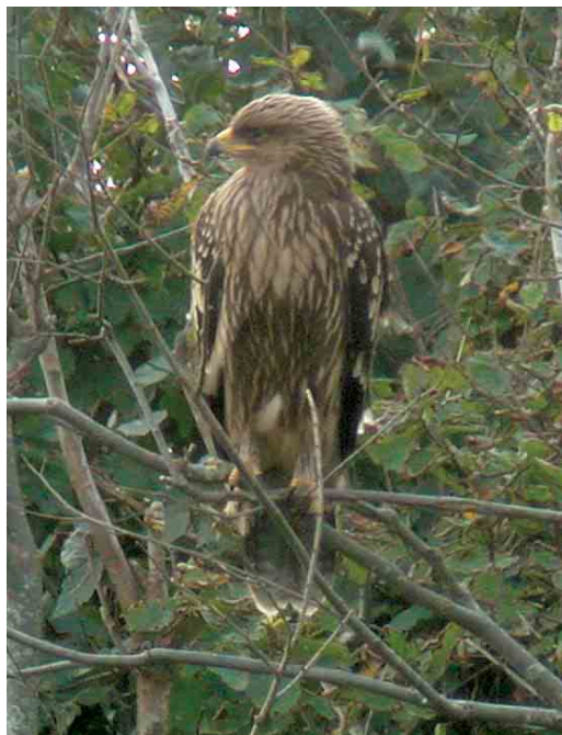
483 Lesser Spotted Eagle / Schreeuwarend Aquila pomarina , juvenile, Domburg, Zeeland, 24 September 2005

24-25 September, Domburg, Westkapelle, Oostkapelle and Grijskerke, Veere , Zeeland, juvenile, photograph-