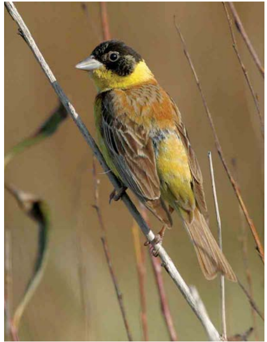
563 Roodkopklauwier / Woodchat Shrike Lanius senator , eerstejaars, De Cocksdorp, Texel, Noord-Holland, 2 september 2006 (Harvey van Diek) 564 Zwartkopgors / Black-headed Bunting Emberiza melanocephala , mannetje, Brouwersdam, Zeeland, 17 oktober 2006 (Leo J R Boon/Cursorius) 565 Daurische Klauwier / Daurian Shrike Lanius isabellinus , adult mannetje, Den Hoorn, Texel, Noord-Holland, 26 september 2006 (Rein Hofman)