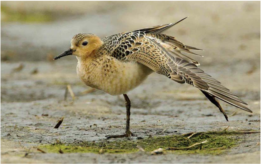
556 Blonde Ruiters / Buff-breasted Sandpiper Tryngites subruficollis , juveniel, De Stolpen, Noord-Holland, 28 september 2006 557 Blonde Ruiters / Buff-breasted Sandpiper Tryngites subruficollis , juveniel, De Stolpen, Noord-Holland, 27 september 2006 558 Blonde Ruiters / Buff-breasted Sandpiper Tryngites subruficollis , juveniel, Slikken van Flakkee, Zuid-Holland, 13 september 2006