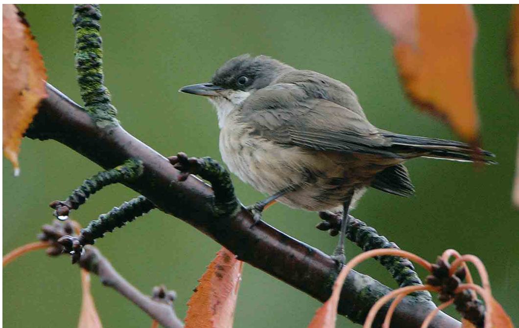
500 Western Orphean Warbler / Westelijke Orpheusgrasmus Sylvia hortensis , Middelburg, Zeeland, 31 October 2003 ( Bas van den Boogaard ) 501 Desert Wheatear / Woestijntapuit Oenanthe deserti , first-summer male, Fochteloërveen, Drenthe, 6 April 2005 ( Roland Jansen ) 502 Two-barred Crossbill / Witbandkruisbek Loxia leucoptera bifasciata , male, Wateren, Drenthe, 9 February 2005 ( Roland Jansen )