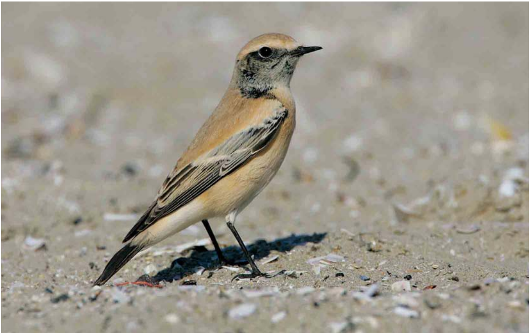
498 Desert Wheatear / Woestijntapuit Oenanthe deserti , first-year male, IJmuiden, Noord-Holland, 24 September 2005