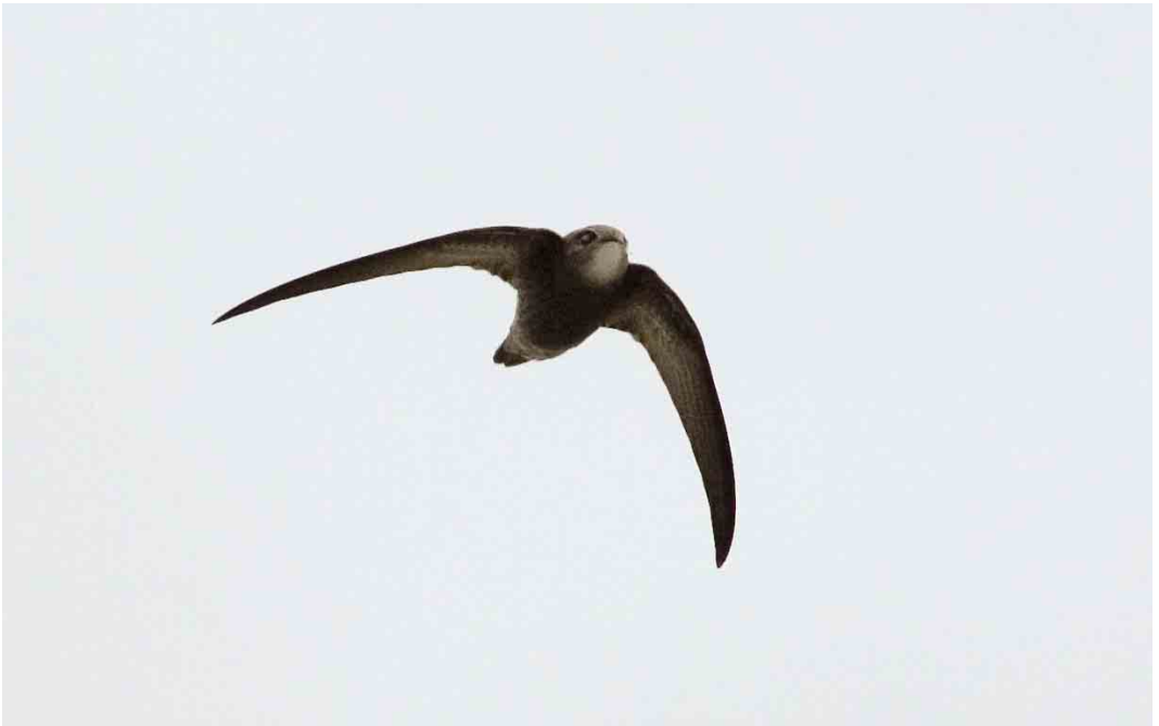
574 Vale Gierzwaluw / Pallid Swift Apus pallidus , Vlieland, Friesland, 20 oktober 2006 (Bas van den Boogaard) 575 Steppevorkstaartplevier / Black-winged Pratincole Pratincola nordmanni , Eemnes, Utrecht, 17 oktober 2006 (Harm Niesen) 576 Roodpootvalk / Red-footed Falcon Falco vespertinus , juveniel, Westkapelle, Zeeland, 30 september 2006 (Corstiaan Beeke)