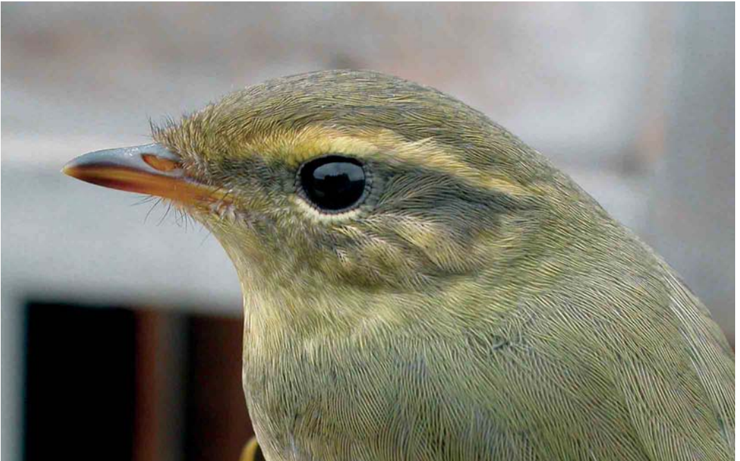
580 Raddes Boszanger / Radde's Warbler Phylloscopus schwarzi , Castricum, Noord-Holland, 19 oktober 2006 (Cock Reijnders)