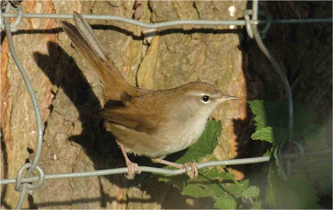
579 Cetti's Zanger / Cetti's Warbler Cettia cetti , Dordtse Biesbosch, Zuid-Holland, 10 oktober 2006