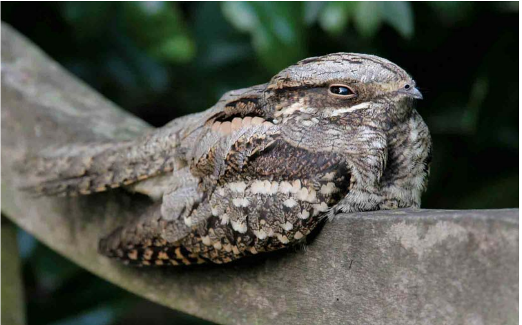
562 Nachtzwaluw / European Nightjar Caprimulgus europaeus , Kwintsheul, Zuid-Holland, 16 september 2006