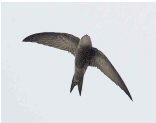
586 Vale Gierzwaluw / Pallid Swift Apus pallidus , Vlieland, Friesland, 20 oktober 2006 (Bas van den Boogaard)

den de vogel nooit meer terug te zien – maar staand op het hoogste duin vond ik hem direct boven de zeereep ter hoogte van de Nieuwe Kooi. Door de telescoop viel nu een wat breed overkomende handvleugel op; door het donkere weer was de kleur niet te zien. Gelukkig zag ik Diederik over het fietspad naderen. Het bleek nu zelfs om twee gierzwaluwen te gaan! Met z'n tweeën pikten we één vogel op die iets dichterbij kwam. We volgden deze enige tijd door de telescoop totdat Diederik zei 'hij is bruin!'. 'Ja wat, zwartbruin als een Gierzwaluw of anders?' riep ik. 'Nee, lichter bruin...'. Juist, dat dacht ik dus ook, maar ik durfde niet aan Vale Gierzwaluw A pallidus te denken (zou een juveniele Gierzwaluw A apus door enige bleking zo laat in het jaar er ook niet zo uit kunnen zien?). We waarschuwden snel telefonisch wat mensen. We volgden nu de tweede vogel en de adrenalinespiegel zakte en de hartslag normaliseerde: we zagen nu niks wat niet past op gewone Gierzwaluw en twee verschillende soorten leek niet realistisch... Beide vogels vlogen eerst een paar kilometers naar het oosten en daarna een stuk de zee op maar steeds als we ze voorgoed dachten kwijt te raken, kwamen ze weer terug. Eindelijk kwam een vogel wat dichterbij, en nu waren we er vrij zeker van dat dit echt een gewone Gierzwaluw was.