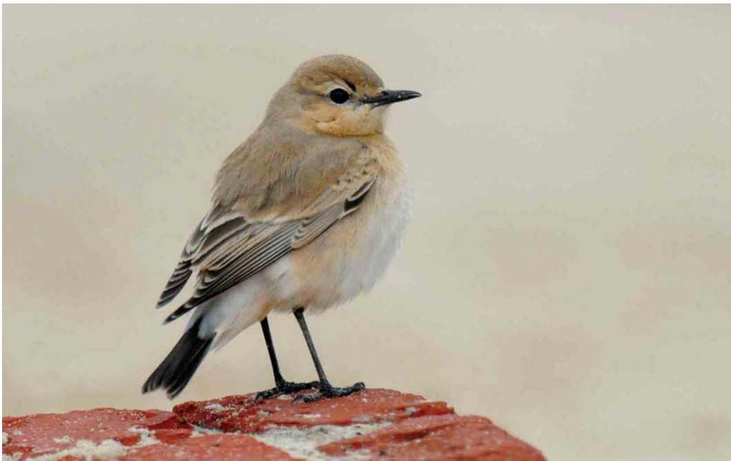
537 Isabelline Wheatear / Izabeltapuit Oenanthe isabellina , Helgoland, Schleswig-Holstein, Germany, 15 October 2006 (Axel Halley)