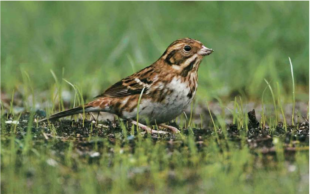
582 Bosgors / Rustic Bunting Emberiza rustica , Vlieland, Friesland, 7 oktober 2006 (Bas van den Boogaard)