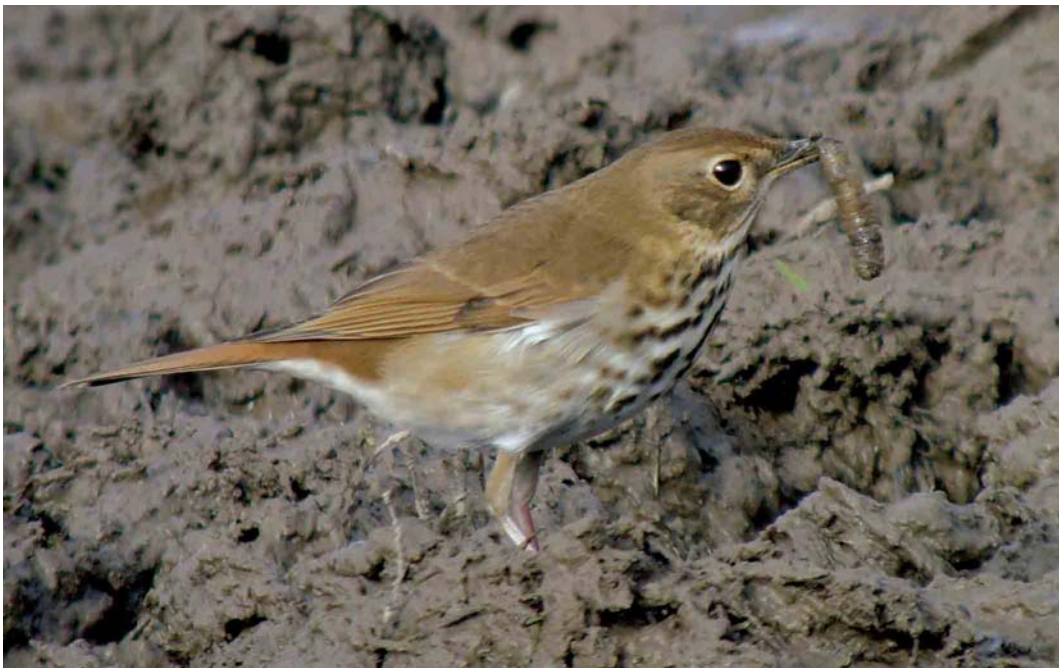
541 Hermit Thrush / Heremietlijster Catharus guttatus , Cape Clear Island, Cork, Ireland, 20 October 2006