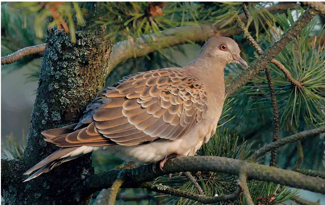
536 Western Oriental Turtle Dove / Oosterse Tortel Streptopelia orientalis meena , juvenile, Rauma, Finland, 9 November 2006