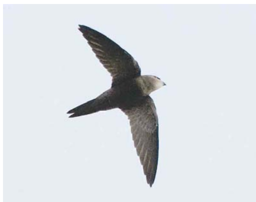
587 Vale Gierzwaluw / Pallid Swift Apus pallidus , Vlieland, Friesland, 21 oktober 2006

Net toen we er zo'n beetje klaar mee waren, kwamen de vogels wéér dichterbij – toch nog even kijken. De bij elkaar vliegende vogels bekijkend vielen ons toch echt verschillen op: één had meer contrast op de boven- en ondervleugel en een iets andere jizz met stompere vleugelpunten en leek af en toe een bruine tint te hebben. Onze gedachten aan Vale Gierzwaluw namen weer toe – of liepen we onszelf nu gek te maken? Lichtelijk in paniek probeerden we tegelijkertijd beide vogels niet kwijt te raken, kenmerken vast te stellen, foto's te maken en anderen te bellen. Jeroen de Bruyn zag beide vogels vervolgens vanaf Duinkersoord en merkte ook de verschillen op. Inmiddels hadden wij versterking gekregen van de eerste gearriveerde vogelaars, waaronder Han Zevenhuizen die op het strand enkele plaatjes wist te