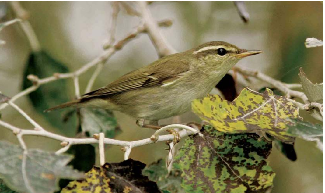
584 Noordse Boszanger / Arctic Warbler Phylloscopus borealis , Heist, West-Vlaanderen, 25 september 2006 (Koen Verbanck)