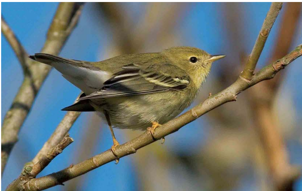
554 Blackpoll Warbler / Zwartkopzanger Dendroica striata , first-year, Reve, Klepp, Rogaland, Norway, 2 November 2006