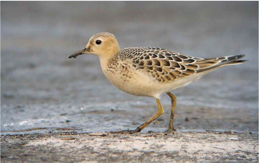
559 Blonde Ruiters / Buff-breasted Sandpiper Tryngites subruficollis , juveniel, De Stolpen, Noord-Holland, 27 september 2006 (Garry Bakker)