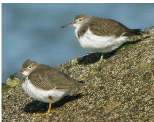
524 Semipalmated Plover / Amerikaanse Bontbekplevier Charadrius semipalmatus , Tarrafal, Santiago, Cape Verde Islands, 17 October 2006 (Edwin Winkel) 525 American Golden Plover / Amerikaanse Goudplevier Pluvialis dominica , Raso, Cape Verde Islands, 21 October 2006 (Edwin Winkel) 526 Long-billed Dowitcher / Grote Grijze Snip Limnodromus scolopaceus , juvenile, Cabo da Praia, Teirceira, Azores, 16 September 2006 (Sébastien Sibley) 527 Upland Sandpiper / Bartrams Ruiters Bartramia longicauda , Unst, Shetland, Scotland, 7 October 2006 (Hugh Harrop) 528 Least Sandpiper / Kleinste Strandloper Calidris minutilla , Ponta Delgada, Flores, Azores, 13 September 2006 (Sébastien Sibley) 529 Spotted Sandpiper / Amerikaanse Oeverloper Actitis macularia (left), with Common Sandpiper / Oeverloper A hypoleucos , Nethertown, Wexford, Ireland, 9 September 2006 (Paul & Andrea Kelly/irishbirdimages.com)