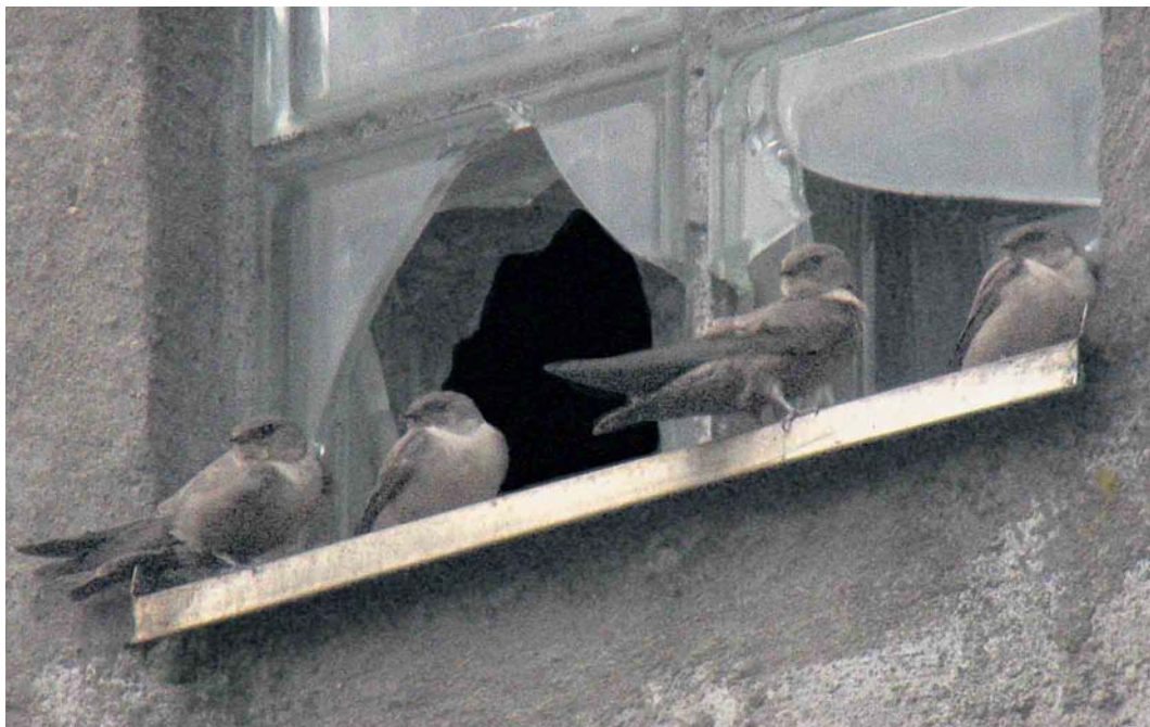
538 Eurasian Crag Martins / Rotszwaluwen Ptyonoprogne rupestris , Vaggeryd, Småland, Sweden, 20 October 2006