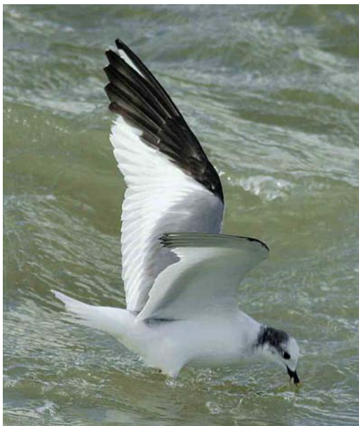
583 Vorkstaartmeeuw / Sabine's Gull Larus sabini , adult, Oostende, West-Vlaanderen, 7 oktober 2006