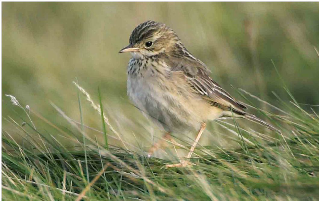
539 Blyth's Pipit / Mongoolse Pieper Anthus godlewskii , Sumburgh Head, Mainland, Shetland, Scotland, 12 October 2006 (Hugh Harrop)