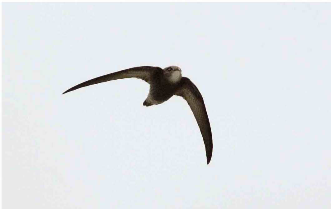
574 Vale Gierzwaluw / Pallid Swift Apus pallidus , Vlieland, Friesland, 20 oktober 2006