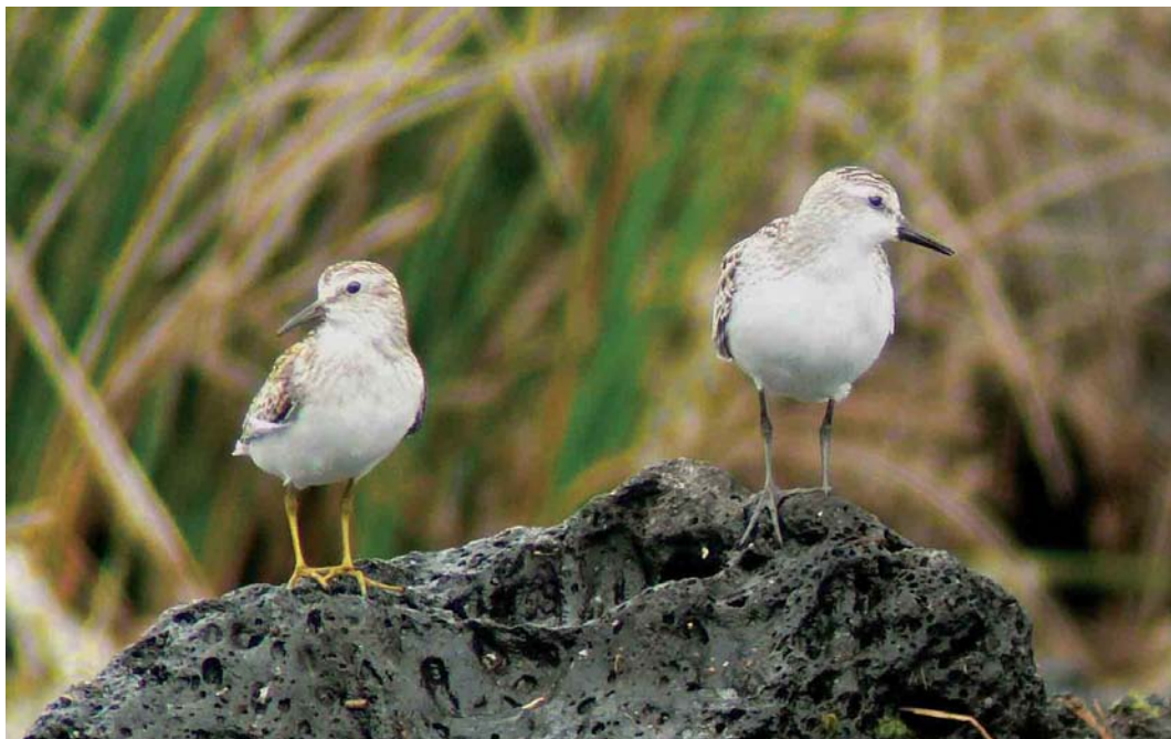
522 Least Sandpiper / Kleinste Strandloper Calidris minutilla (left) and Semipalmated Sandpiper / Grijze Strandloper C pusilla , Lajes do Pico, Pico, Azores, 19 September 2006