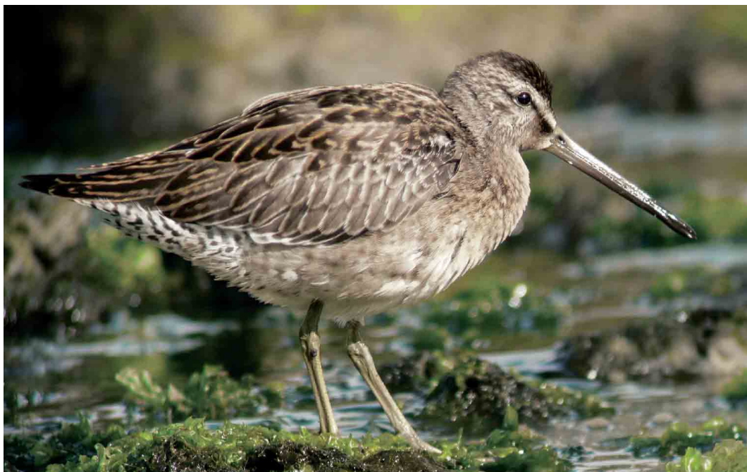
523 Short-billed Dowitcher / Kleine Grijze Snip Limnodromus griseus , juvenile, Lajes do Pico, Pico, Azores, 22 September 2006