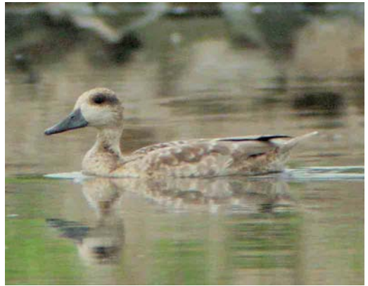
479 Ring-necked Duck / Ringsnaveleend Aythya collaris , first-year female, Budel-Dorplein, Noord-Brabant, 23 October 2005 480 Eastern Imperial Eagle / Keizerarend Aquila heliaca , third calendar-year, Kamperhoek, Flevoland, 3 April 2005 481 Falcated Duck / Bronskopeend Anas falcata , adult male, with Eurasian Wigeon / Smient A penelope , male, Nijkerkernauw, Gelderland, 30 March 2005 482 Marbled Duck / Marmereend Marmaronetta angustirostris , juvenile, Doornenburg, Gelderland, 15 August 2004