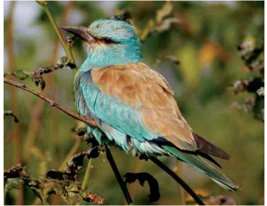
484 Squacco Heron / Ralreiger Ardeola ralloides , adult, Alblisserdam, Zuid-Holland, 2 July 2005 485 Great Snipe / Poelsnip Gallinago media , Hessenpoort, Zwolle, Overijssel, 13 September 2005 486 Eurasian Pygmy Owl / Dwerguil Glaucidium passerinum , Sumarreheide, Friesland, 4 October 2002 487 European Roller / Scharrelaar Coracias garrulus , adult, Texel, Noord-Holland, 16 September 2005