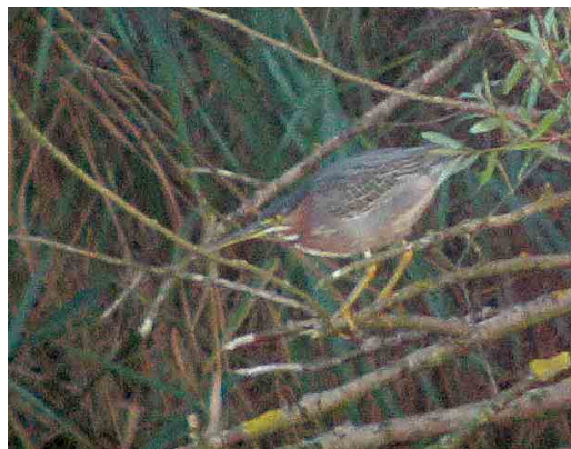
566 Grote Tafelend / Canvasback Aythya valisineria , adult mannetje, Hoefijzermeer, Castricum, Noord-Holland, 30 september 2006 567 Klein Waterhoen / Little Crake Porzana parva , Verdrongen Land van Saeftinghe, Zeeland, 8 september 2006 568 Groene Reiger / Green Heron Butorides virescens , tweede-kalenderjaar, Zijkanaal H-Weg, Amsterdam, Noord-Holland, 19 september 2006 569 Groene Reiger / Green Heron Butorides virescens , tweede-kalenderjaar, Zijkanaal H-Weg, Amsterdam, Noord-Holland, 30 september 2006

6 september over Veenendaal, Utrecht, op 1 oktober bij Camperduin, op 5 oktober twee (overvliegend) bij Lexmond, Zuid-Holland, op 8 oktober over Texel, en op 9 oktober langs Katwijk aan Zee, Zuid-Holland. Uiteraard was ook de vogel van het Balgzand en omstreken, Noord-Holland, de gehele periode aanwezig. Er werd een achttal Zwarte Wouwen Milvus migrans gemeld waaronder één van 4 tot 6 september in het Markiezaat, Noord-Brabant, soms in gezelschap van twee Rode Wouwen M. milvus . Tot half oktober trokken c 10 Zeearenden Haliaeetus albicilla het land in. Het broedpaar met hun jonge vogel bleef aanwezig in de Oostvaardersplassen en vanaf 16 oktober was er één aanwezig in de wijde omgeving van de Korendijkse Slikken, Zuid-Holland. De Slangenarend Circaetus gallicus van Meijendel, Zuid-Holland, bleef tot 9 september. Een mogelijke Steppebuizerd Buteo buteo vulpinus werd op 27 oktober gefotografeerd bij Lettele,