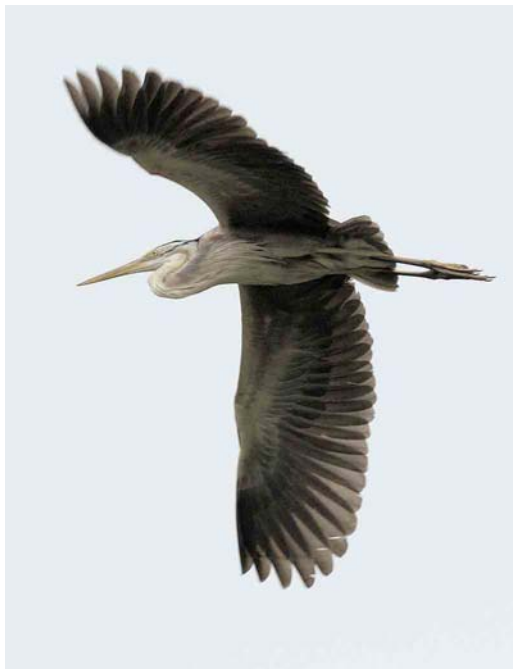
519 American Great Egret / Amerikaanse Grote Zilverreiger Casmerodius albus egretta , Povoação, São Miguel, Azores, 30 September 2006 520 Bourne's Heron / Kaapverdise Purperreiger Ardea bournei , Liberão, Santiago, Cape Verde Islands, 15 October 2006 521 Boreal Eider / Noordelijke Eider Somateria mollissima borealis , immature male, Fair Isle, Shetland, Scotland, 8 October 2006