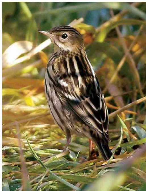
544 Black-headed Bunting / Zwartkopgors Emberiza melanocephala , Toab, Shetland, Scotland, 16 September 2006 545 Pechora Pipit / Petsjorapieper Anthus gustavi , Fair Isle, Shetland, Scotland, 23 September 2006 546 Grey-necked Bunting / Steenortolaan Emberiza buchanani , Pori, Finland, 31 October 2006