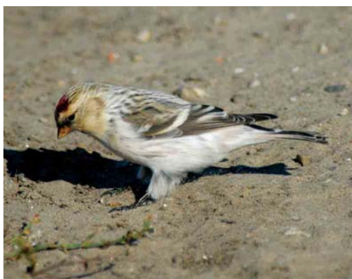
503 Lesser Grey Shrike / Kleine Klapekster Lanius minor , adult female, Groote Vlak, Texel, Noord-Holland, 5 October 504 Desert Wheatear / Woestijntapuit Oenanthe deserti , first-year male, Westerstrand, Schiermonnikoog, Friesland, 29 October 2005 505-506 Desert Wheatear / Woestijntapuit Oenanthe deserti , first-year male, IJmuiden, Noord-Holland, 13 November 2005 507 Arctic Redpoll / Witstuitbarmsijs Carduelis hornemanni exilipes , first-winter, Oosterscheldekering, Westenschouwen, Zeeland, 19 November 2005 508 Hornemann's Redpoll / Groenlandse Witstuitbarmsijs Carduelis hornemanni hornemanni , adult male, Huisduinen, Noord-Holland, 15 October 2003