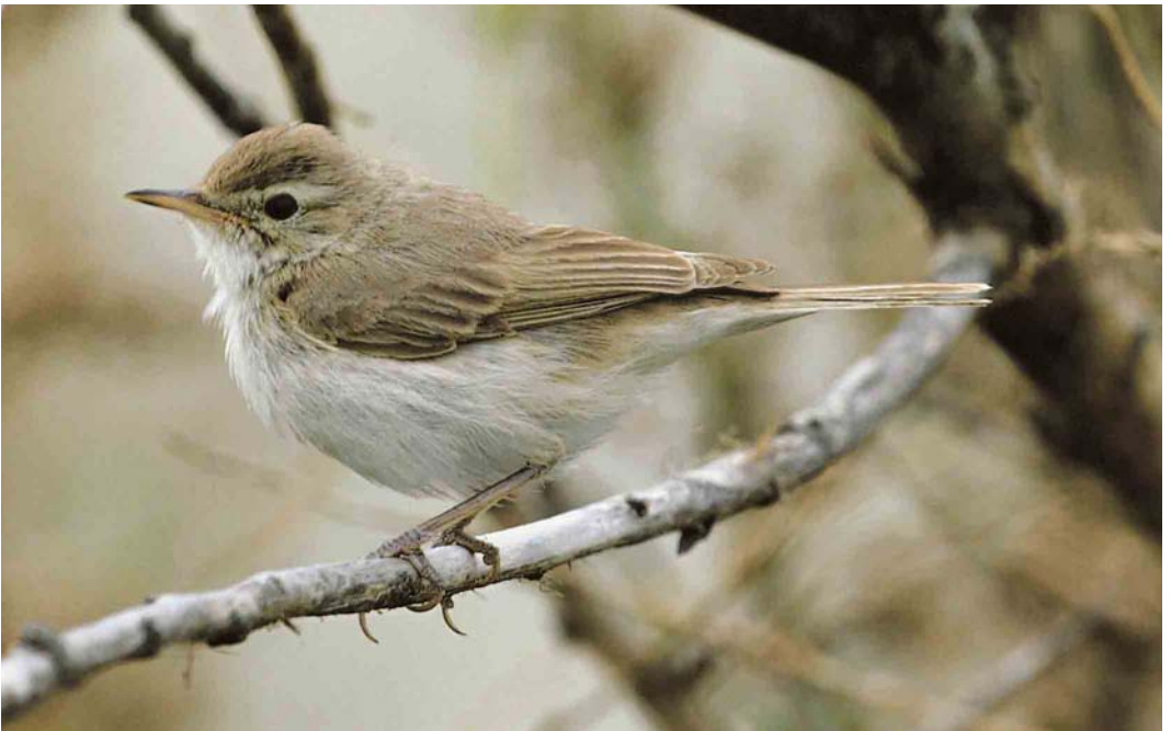
578 Kleine Spotvogel / Booted Warbler Acrocephalus caligatus , Maasvlakte, Zuid-Holland, 9 oktober 2006