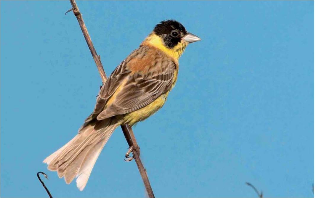
581 Zwartkopgors / Black-headed Bunting Emberiza melanocephala , mannetje, Brouwersdam, Zeeland, 17 oktober 2006