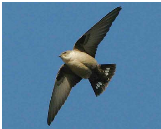
589 Rotszwaluw / Eurasian Crag Martin Ptyonoprogne rupestris , Hoorn, Noord-Holland, 18 november 2006 (René van Rossum)

op een spuyer hoog op een flatgebouw aan De Weel. Enkele fotografen konden vanuit het appartement op de bovenste verdieping prachtige foto's maken. Rond 11:00 verplaatsten de twee zwaluwen zich naar het oude centrum waar ze rond de Grote Kerk vlogen. Rond 11:45 werden ze op hun oude plek bij De Titaan gezien – en zo ging het de rest van de dag (tot c 16:30) door, waarbij enkele 100-en vogelaars de soort eindelijk op hun Nederlandse lijst konden bijschrijven. Ook de volgende dagen werden de vogels nog gezien, ten minste tot en met 24 november.