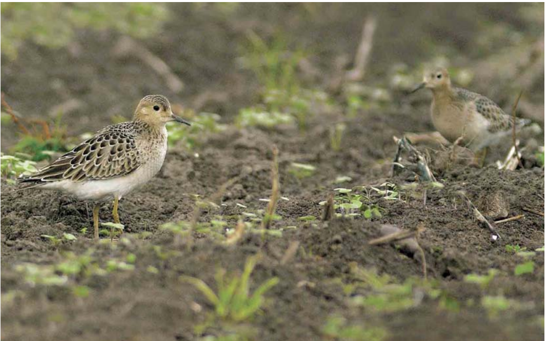
560 Blonde Ruiters / Buff-breasted Sandpipers Tryngites subruficollis , juveniel, Amaliaweg, Texel, Noord-Holland, 25 september 2006 (René Pop)