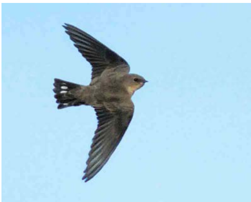
588 Rotszwaluw / Eurasian Crag Martin Ptyonoprogne rupestris , Hoorn, Noord-Holland, 18 november 2006