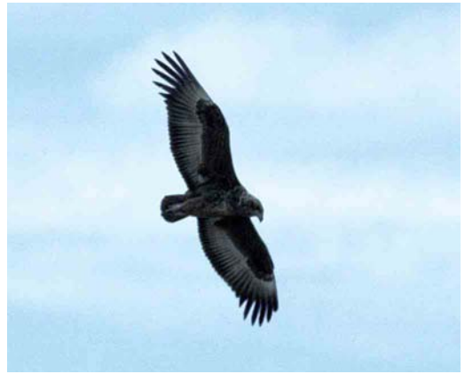
514-515 Bateleur / Bateleur Terathopius ecaudatus , juvenile, Kalahari Gemsbok National Park, North Cape, South Africa, 12 March 1996 (Arnoud B van den Berg)

The mystery bird also does not fit one of the Haliaeetus species, of which Bald Eagle H leucocephalus was mentioned most. Again, the bill of the mystery bird is much too small to fit one of the fish eagles. Furthermore, all fish eagles show a rather strongly patterned upperwing in juvenile plumage with pale or brownish tips to the greater and median coverts, a pale mantle and in most cases a whitish uppertail, creating a strong variegated pattern, quite unlike the rather uniform upperwing of the mystery bird.