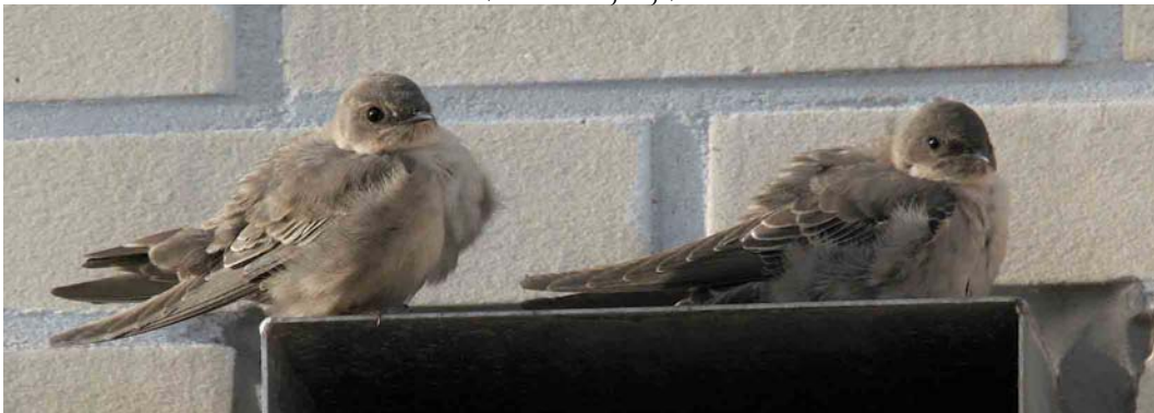
590 Rotszwaluwen / Eurasian Crag Martins Ptyonoprogne rupestris , Hoorn, Noord-Holland, 18 november 2006

EURASIAN CRAG MARTINS On 5 November 2006, two Eurasian Crag Martins Ptyonoprogne rupestris were seen briefly by one birder and his friend at IJburg, Amsterdam, Noord-Holland, the Netherlands. On 7 November, two were seen and heard calling by four observers at Westenschouwen, Zeeland. From 14 to at least 24 November, one to two were seen (almost) daily but, in the first days, briefly at Hoorn, Noord-Holland (c 30 km north of IJburg). On 17 November, the first photographs of the two birds at Hoorn were made and, on 18 November, the two were seen for long periods, both at rest and in flight, during the