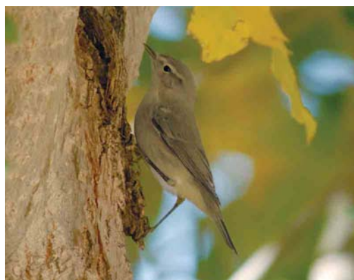
530 Eurasian Collared Dove / Turkse Tortel Streptopelia decaocto , Cabo da Praia, Teirceira, Azores, 16 September 2006 ( Sébastien Sibley ) 531 Common Crane / Kraanvogel Grus grus , Madeira, 19 October 2006 ( René Pop ) 532 Isabelline Wheatear / Izabeltapuit Oenanthe isabellina , Carmel Head, Anglesey, Wales, 23 September 2006 ( Jeroen Reneerkens ) 533 Siberian Accentor / Bergheggenmus Prunella montanella , Rumeli Feneri, Istanbul, Turkey, 2 November 2006 ( Soner Bekir ) 534 Presumed Daurian Shrike / vermoedelijke Daurische Klauwier Lanius isabellinus , Soral, Genève, Switzerland, 7 October 2006 ( Adrian Jordi ) 535 Iberian Chiffchaff / Iberische Tjiftjaf Phylloscopus ibericus , Oukaimeden, High Atlas, Morocco, 12 October 2006 ( Arnoud B van den Berg )