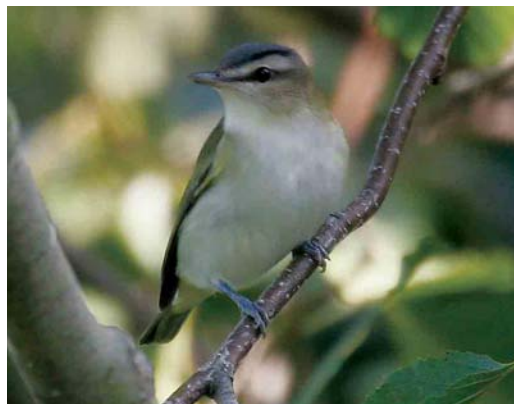
509 Greenish Warbler / Grauwe Fitis Phylloscopus trochiloides , Bodegraven, Zuid-Holland, 10 June 2005 510 Iberian Chiffchaff / Iberische Tjiftjaf Phylloscopus ibericus , Bergen, Noord-Holland, 25 May 2005 511 Siberian Chiffchaff / Siberische Tjiftjaf Phylloscopus collybita tristis , Westkapelle, Zeeland, 11 October 2005 512 Red-eyed Vireo / Roodoogvireo Vireo olivaceus , Westkapelle, Zeeland, 9 October 2005

Zuid-Holland, on 31 May 2003 (van Rijswijk 2004); it was part of an unprecedented influx to north-western and northern Europe (cf Olthoff 2006).