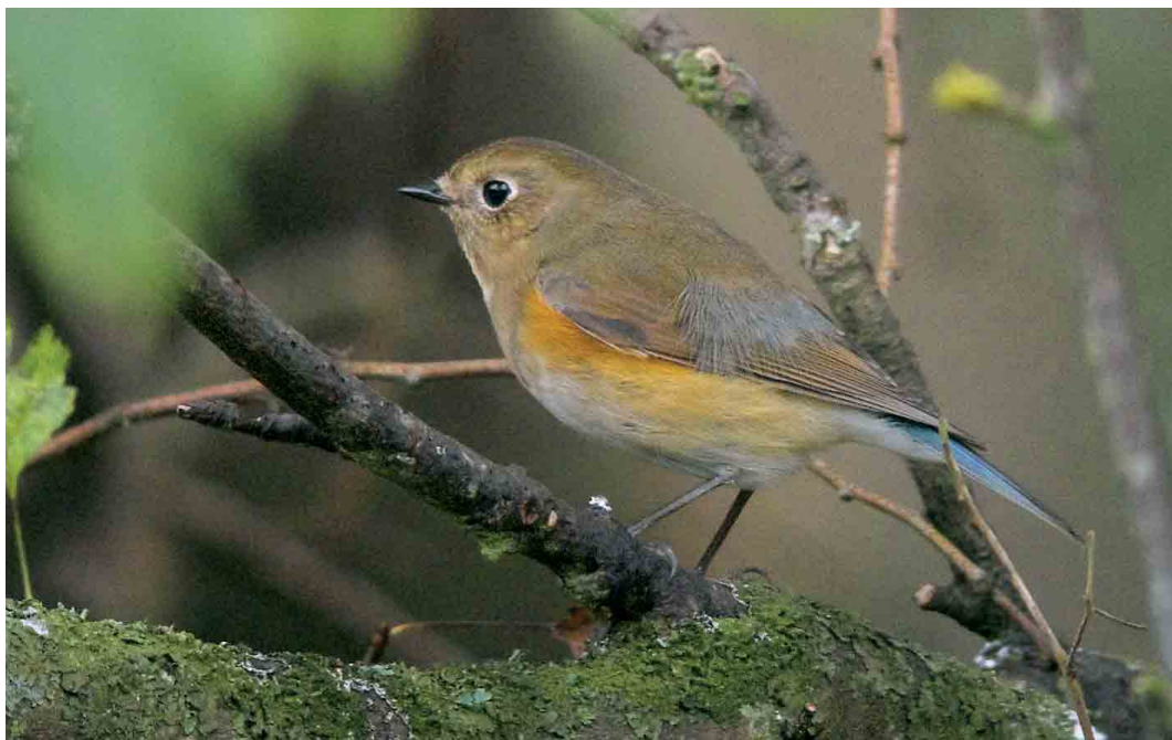
543 Red-flanked Bluetail / Blauwstaart Tarsiger cyanurus , first-winter, Thorpeness, Suffolk, England, 23 October 2006 (Dave Stewart)