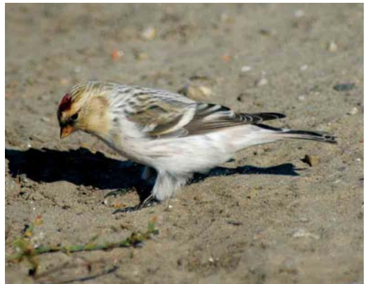
503 Lesser Grey Shrike / Kleine Klapekster Lanius minor , adult female, Groote Vlak, Texel, Noord-Holland, 5 October 504 Desert Wheatear / Woestijntapuit Oenanthe deserti , first-year male, Westerstrand, Schiermonnikoog, Friesland, 29 October 2005 505-506 Desert Wheatear / Woestijntapuit Oenanthe deserti , first-year male, IJmuiden, Noord-Holland, 13 November 2005 507 Arctic Redpoll / Witstuitbarmsijs Carduelis hornemanni exilipes , first-winter, Oosterscheldekering, Westenschouwen, Zeeland, 19 November 2005 508 Hornemann's Redpoll / Groenlandse Witstuitbarmsijs Carduelis hornemanni hornemanni , adult male, Huisduinen, Noord-Holland, 15 October 2003