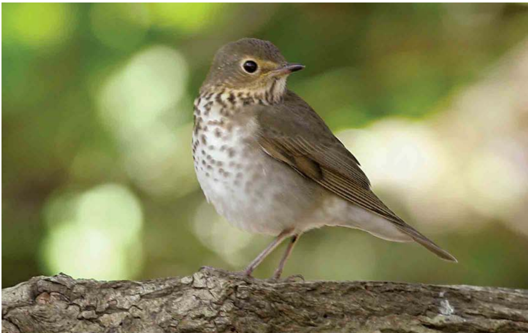
540 Swainson's Thrush / Dwerglijster Catharus ustulatus , Ouessant, Finistère, France, 3 October 2006 (Vincent Legrand)