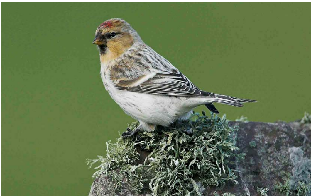
547 Hornemann's Redpoll / Groenlandse Witstuitbarmsijs Carduelis hornemanni hornemanni , Sumburgh Head, Mainland, Shetland, Scotland, 22 October 2006