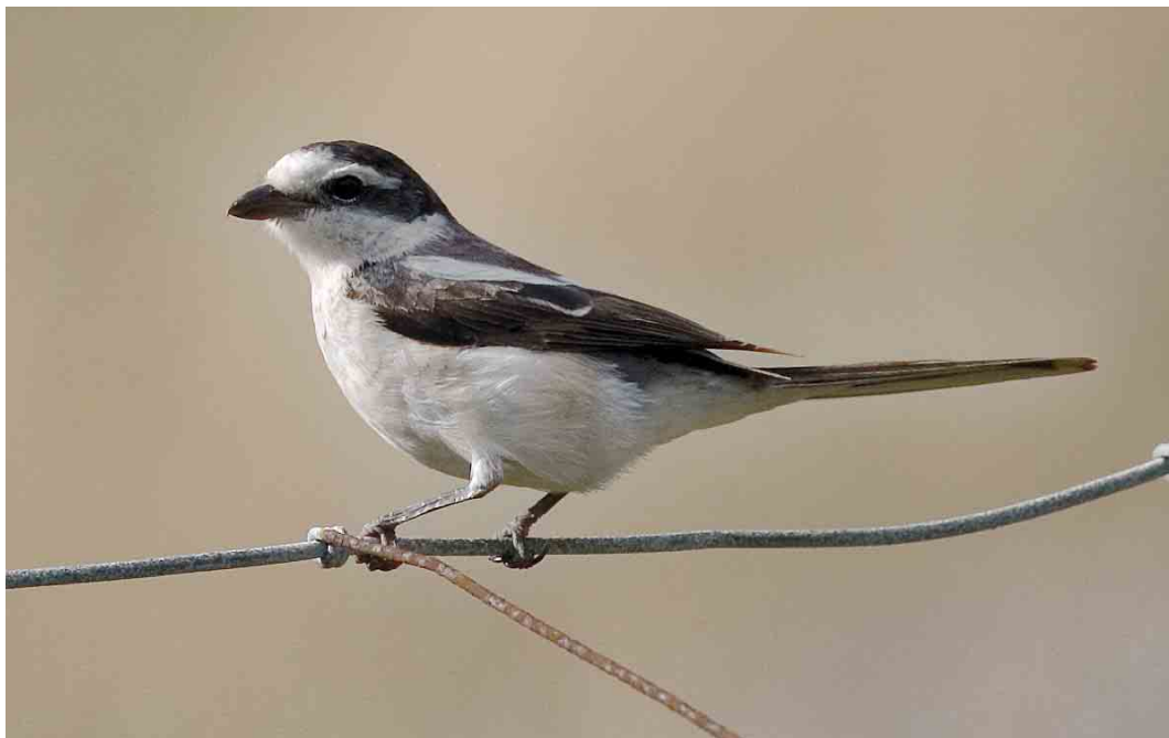
542 Masked Shrike / Maskerklauwier Lanius nubicus , adult, Utsira, Rogaland, Norway, 3 October 2006 (Christian Tiller)