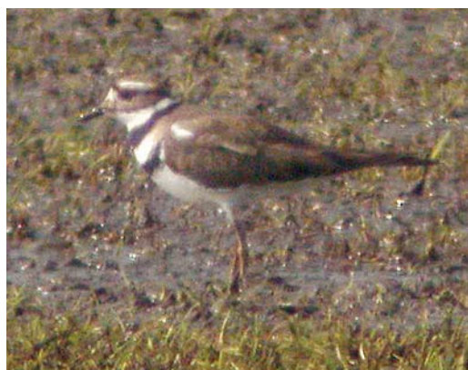
488 Buff-breasted Sandpiper / Blonde Ruiters Tryngites subruficollis , juvenile, Harpel, Groningen, 2 October 1982 (Nico de Vries) 489 Red-necked Stint / Roodkeelstrandloper Calidris ruficollis , adult, Wagejot, Texel, Noord-Holland, 24 July 2005 (René Pop) 490 Terek Sandpiper / Terekruiter Xenus cinereus , Wagejot, Texel, Noord-Holland, 15 May 2005 (René Pop) 491 Terek Sandpiper / Terekruiter Xenus cinereus , De Braakman, Zeeland, 7 June 2005 (Mark S J Hoekstein) 492 Killdeer / Killdeerplevier Charadrius vociferus , second calendar-year, Rottige Meente, Overijssel, 4 April 2005 (Roland Jansen) 493 Killdeer / Killdeerplevier Charadrius vociferus , second calendar-year, Rottige Meente, Overijssel, 4 April 2005 (Leo J R Boon/Cursorius)