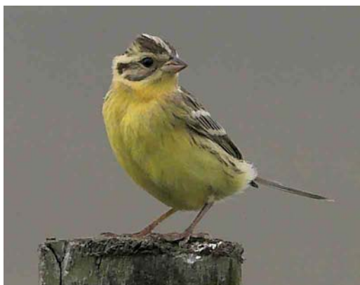
549 Baltimore Oriole Icterus galbula , Cape Clear Island, Cork, Ireland, 17 October 2006 (Paul & Andrea Kelly/irishbirdimages.com) 550 Blackpoll Warbler / Zwartkopzanger Dendroica striata , first-year, Mandø, Denmark, 16 October 2006 (Martin Søgaard Nielsen) 551 Hermit Thrush / Heremietlijster Catharus guttatus , Cape Clear Island, Cork, Ireland, 19 October 2006 (Paul & Andrea Kelly/irishbirdimages.com) 552 Yellow-breasted Bunting / Wilgengors Emberiza aureola , Whalsay, Shetland, Scotland, 11 September 2006 (Hugh Harrop)

Clare, on 7-14 October. Three single European Goldfinches Carduelis carduelis at three sites during 12-16 October were the second to fourth for Iceland (the first was on 17 October 2005); a fifth was found on 1 November. A Greenland Redpoll C flammea rostrata on Corvo on 21 October was the second redpoll for the Azores and Macaronesia. In Norway, one was found at Mønstremyr, Vest-Agder, on 2 November. Two Hornemann's Redpolls C hornemanni hornemanni were reported from Røst, Nordland, Norway, on 2 October. Four singles occurred in Shetland on Foula on 4-13 October, at Sumburgh on 19-24 October and on Fair Isle on 25 and 30 October. Recent sound-recordings of British Crossbill Loxia curvirostra type E in Estonia were the first outside Britain and the Netherlands; perhaps less surprising were the first sound-recordings of Scarce Crossbills L c type F outside the Benelux in Estonia and Russia (cf The Sound Approach to birding 2006). In coastal south-western Norway, an influx of