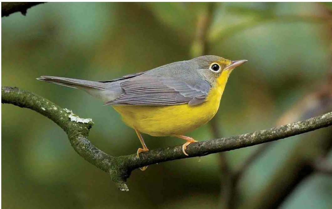
553 Canada Warbler / Canadese Zanger Wilsonia canadensis , Kilbaha, Clare, Ireland, October 2006 (John Carter)