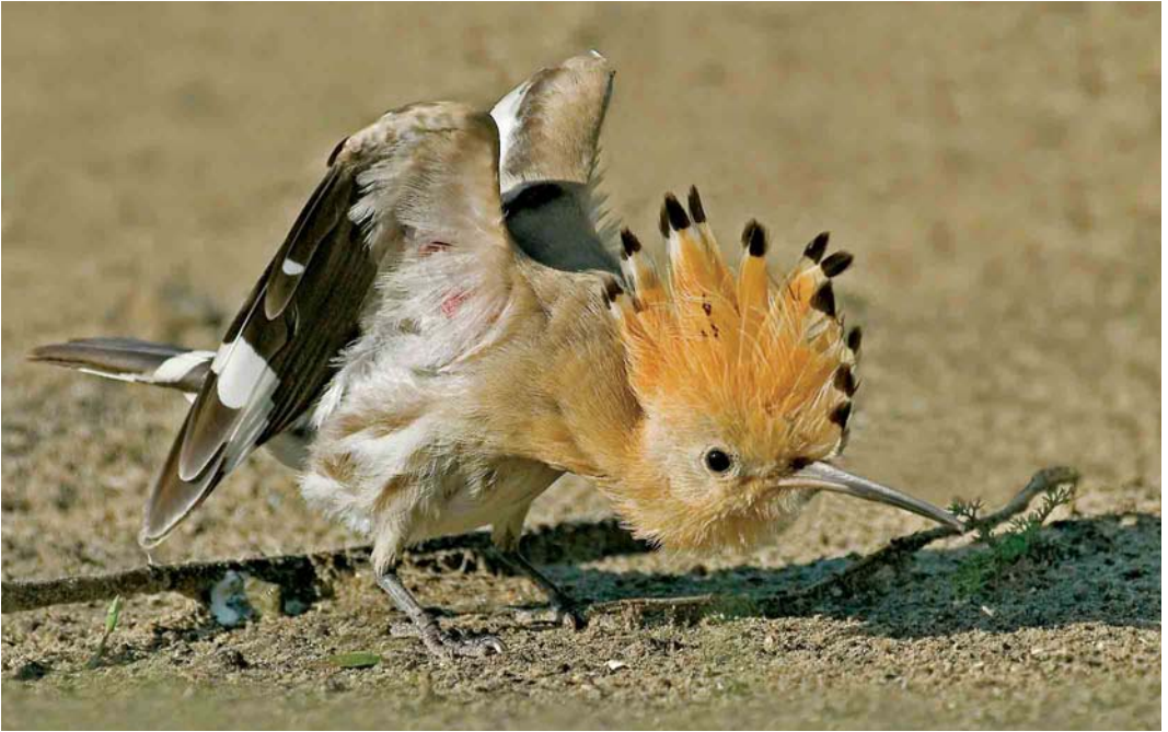
561 Hop / Eurasian Hoopoe Upupa epops , Castricum, Noord-Holland, 9 oktober 2006