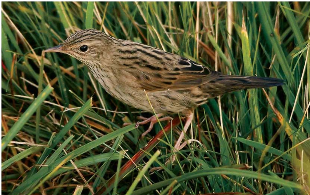
548 Lanceolated Warbler / Kleine Sprinkhaanzanger Locustella lanceolata , Fair Isle, Shetland, Scotland, 15 September 2006