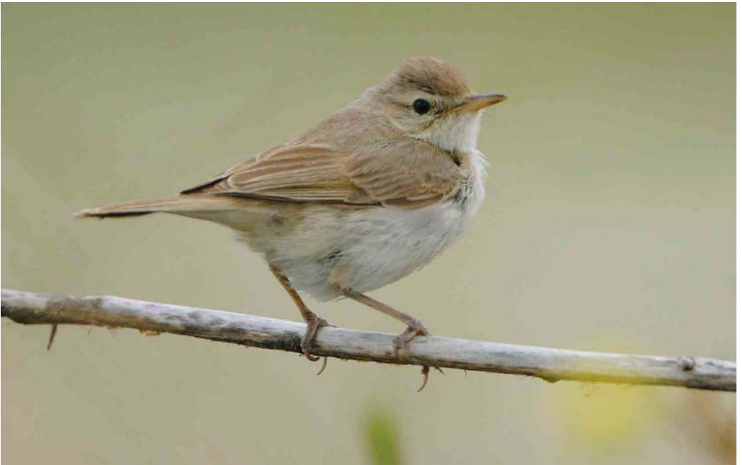
577 Kleine Spotvogel / Booted Warbler Acrocephalus caligatus , Maasvlakte, Zuid-Holland, 9 oktober 2006 (Roland Jansen)