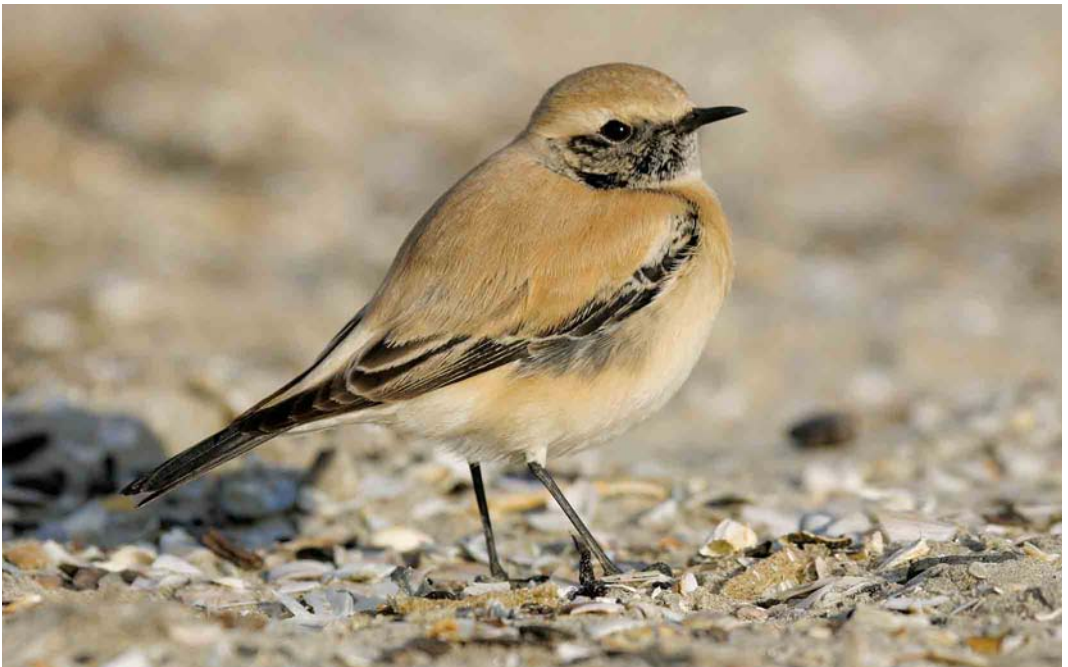
499 Desert Wheatear / Woestijntapuit Oenanthe deserti , first-year male, IJmuiden, Noord-Holland, 22 November 2005