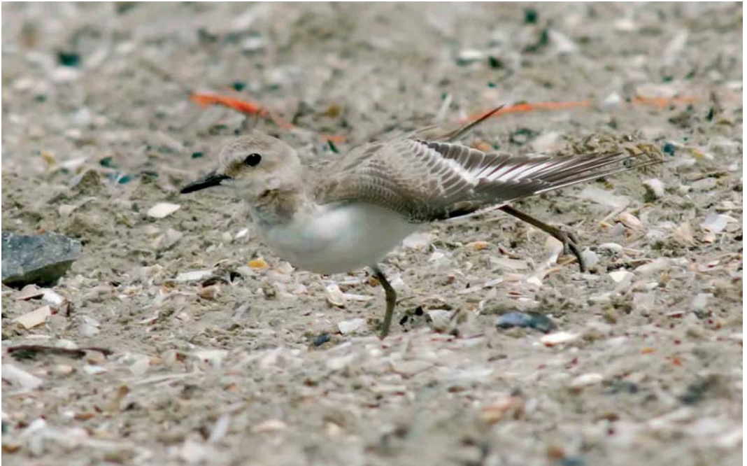
435 Greater Sand Plover / Woestijnplevier Charadrius leschenaultii , first-year, IJmuiden, Noord-Holland, Netherlands, 4 August 2006 (Arnoud B van den Berg)