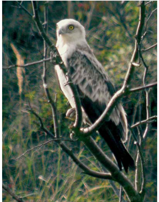
453 Lammergier / Lammergeier Gypaetus barbatus , onvolwassen, met Zeearend / White-tailed Eagle Haliaeetus albicilla en Bruine Kiekendieven / Western Marsh Harriers Circus aeruginosus , Oostvaardersplassen, Flevoland, 15 mei 2006 ( Frank de Roder ) cf Dutch Birding 28: 247, 257, 2006 454 Slangenarend / Short-toed Eagle Circaetus gallicus , Meijendel, Zuid-Holland, 19 augustus 2006 ( Wouter Puyk ) 455 Zwarte Ooievaar / Black Stork Ciconia nigra , Wieringermeer, Noord-Holland, 2 september 2006 ( Harm Niesen )