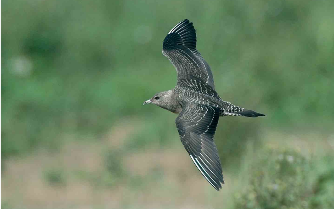
460 Kleinste Jager / Long-tailed Jaeger Stercorarius longicaudus , juveniel, Goudswaard, Zuid-Holland, 5 september 2006 (Norman D van Swelm)