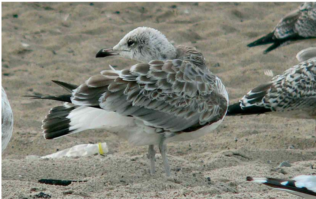
436 Pallas's Gull / Reuzenzwartkopmeeuw Larus ichthyaetus , first-year, Miedzyzdroje, Poland, 19 August 2006