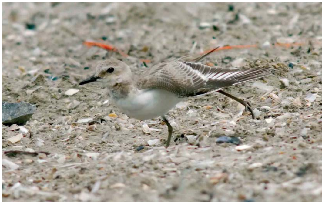
435 Greater Sand Plover / Woestijnplevier Charadrius leschenaultii , first-year, IJmuiden, Noord-Holland, Netherlands, 4 August 2006