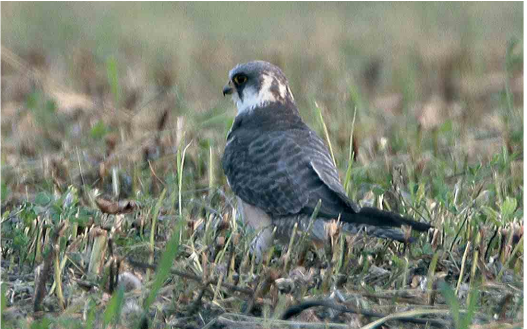
434 Amur Falcon / Amoerroodpootvalk Falco amurensis , female, Jaszbereny, Hungary, July 2006 (János Oláh)