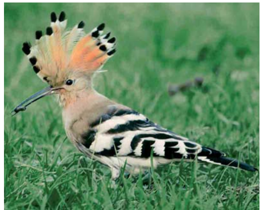
466 Slangenarend / Short-toed Eagle Circaetus gallicus , Meijndel, Zuid-Holland, 14 augustus 2006 (Renée de Kleijn & George Pieterse) 467 Grauwe Fitis / Greenish Warbler Phylloscopus trochiloides , Koarnwerterstân, Friesland, 26 augustus 2006 (Jan Bisschop) 468 Citroenkwikstaart / Citrine Wagtail Motacilla citreola , eerstejaars, Wageningen, 18 augustus 2006 (Marijn Prins) 469 Hop / Eurasian Hoopoe Upupa epops , Bergen, Noord-Holland, 31 augustus 2006 (Jan den Hertog)

Brabant. Een Graszanger Cisticola juncidis bleef de gehele periode bij Zwijndrecht, en tot 4 juli bij Den Bosch, Noord-Brabant. Andere pleisterden op 10 juli bij Ellewoutsdijk, Zeeland, op 5 en 13 augustus bij Cadzand-Bad, Zeeland, op 5 augustus in de Oostvaardersplassen, op 18 en 19 augustus bij Rijnsburg, Zuid-Holland, en op 27 augustus (ten minste drie) bij Graauw, Zeeland. De laatste Orpheusspotvogel Hippolais polyglotta van het seizoen zong op 1 en 2 juli in de Patersgronden bij Valkenswaard, Noord-Brabant. Van 29 juli tot 20 augustus werden 11 Waterrietzangers Acrocephalus paludicola aangetroffen, waaronder vijf in de netten van vogelringers. Van Sperwergrasmus Sylvia nisoria waren er uitsluitend vangsten en geen veldwaarnemingen. Vanaf 7 augustus hingen er her en der al 10 in de netten, waarvan drie op 26 augustus in de AW-duinen, Noord-Holland. Een veelbezochte en af en toe zingende Grauwe Fitis Phylloscopus trochiloi-