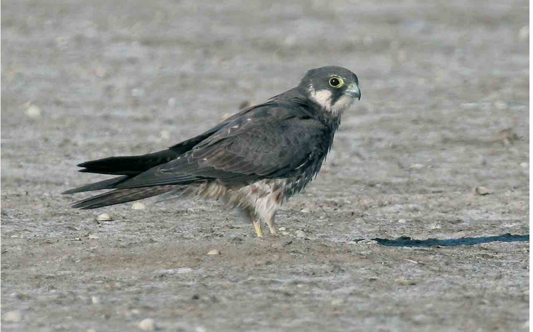
433 Eleonora's Falcon / Eleonora's Valk Falco eleonora , immature, Piémanson, Camargue, Bouches-du-Rhône, France, 14 August 2006