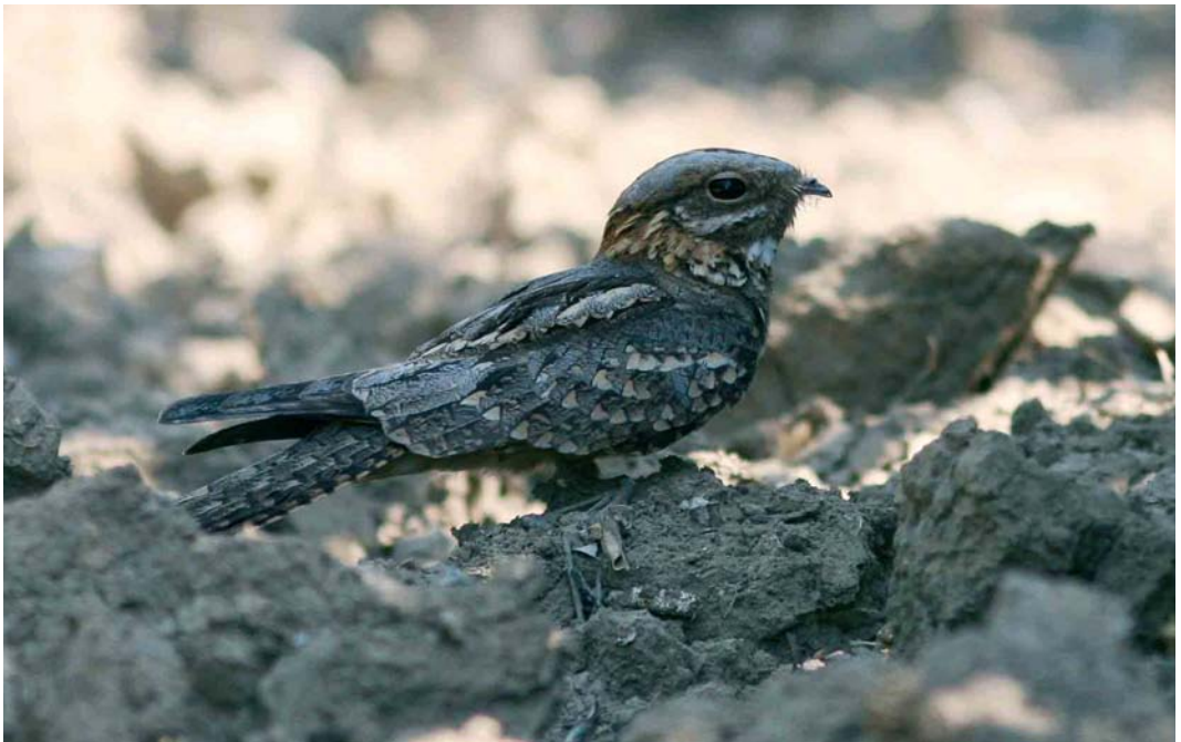
429 Red-necked Nightjar / Moose Nachtzwaluw Caprimulgus ruficollis , Brenes, Sevilla, Andalucía, Spain, 3 June 2006

European Nightjar and Red-necked Nightjar are rather similar in appearance. One of the differences, also visible in the mystery photograph, is the size of the white primary spots. In European, only males have obvious spots. In Red-necked, both males and females show these white spots on the three outermost primaries. In both sexes of Red-necked, the white spots are on average larger than in European. The mystery bird shows rather large white spots and this, therefore, favours Red-necked. Another character favouring Red-necked and also visible in the mystery photograph is the rather brownish-grey colour of the uppertail and mantle. In European, these feathers lack the brownish tinge of Red-necked. The rusty-red patterning visible at the upperwing of the mystery bird is another pointer towards Red-necked. In European, the upperwing is patterned less rusty-red. The most important discriminating character, however, is just visible in the mystery photograph. In Red-necked, all wing-coverts show broad pale buff tips, creating pale wing-bars of equal width and about three rows of these buff wing-bars can be seen on the left wing of the mystery bird. European shows only one broad whitish wing-bar, formed by the