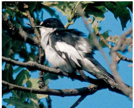
4 Atlas Flycatcher / Atlasvliegenvanger Ficedula speculigera , female, Beni M'tir, Jendouba, Tunisia, 3 May 2005 (René Pop) 5-7 Iberian Pied Flycatcher / Iberische Vliegenvanger Ficedula hypoleuca iberiae , male, Sierra de Gredos, Extremadura, Spain, 12 June 2002 (Arnoud B van den Berg) 8 Iberian Pied Flycatcher / Iberische Vliegenvanger Ficedula hypoleuca iberiae , female, Sierra de Gredos, Extremadura, Spain, 12 June 2002 (Arnoud B van den Berg) 9 Iberian Pied Flycatcher / Iberische Vliegenvanger Ficedula hypoleuca iberiae , male, Sierra de Gredos, Extremadura, Spain, 12 June 2002 (Arnoud B van den Berg)