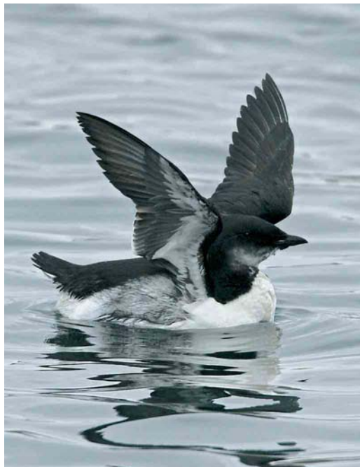
32 Kumlien's Gull / Kumliens Meeuw Larus glaucooides kumlieni , Nimmo's Pier, Galway, Ireland, 2 January 2006 33 Brännich's Murre / Kortbekzeekoet Uria lomvia , Lerwick harbour, Shetland, Scotland, November 2005 34 Forster's Tern / Forsters Stern Sterna forsteri , Cabo da Praia, Terceira, Azores, 22 November 2005