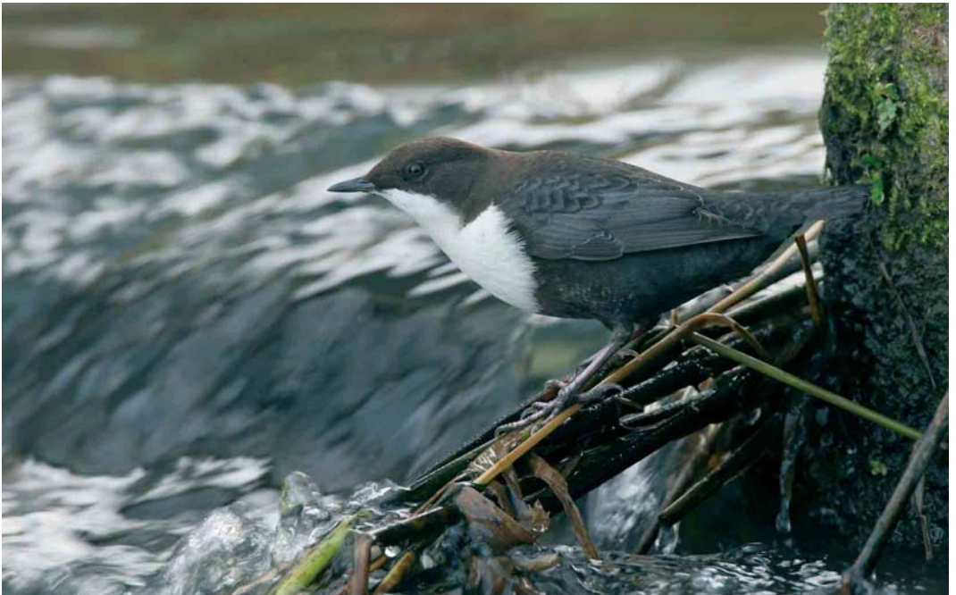
83 Zwartbuikwaterspreeuw / Black-bellied Dipper Cinclus cinclus cinclus , Knardijk, Flevoland, 31 oktober 2005 (Menno van Duijn)