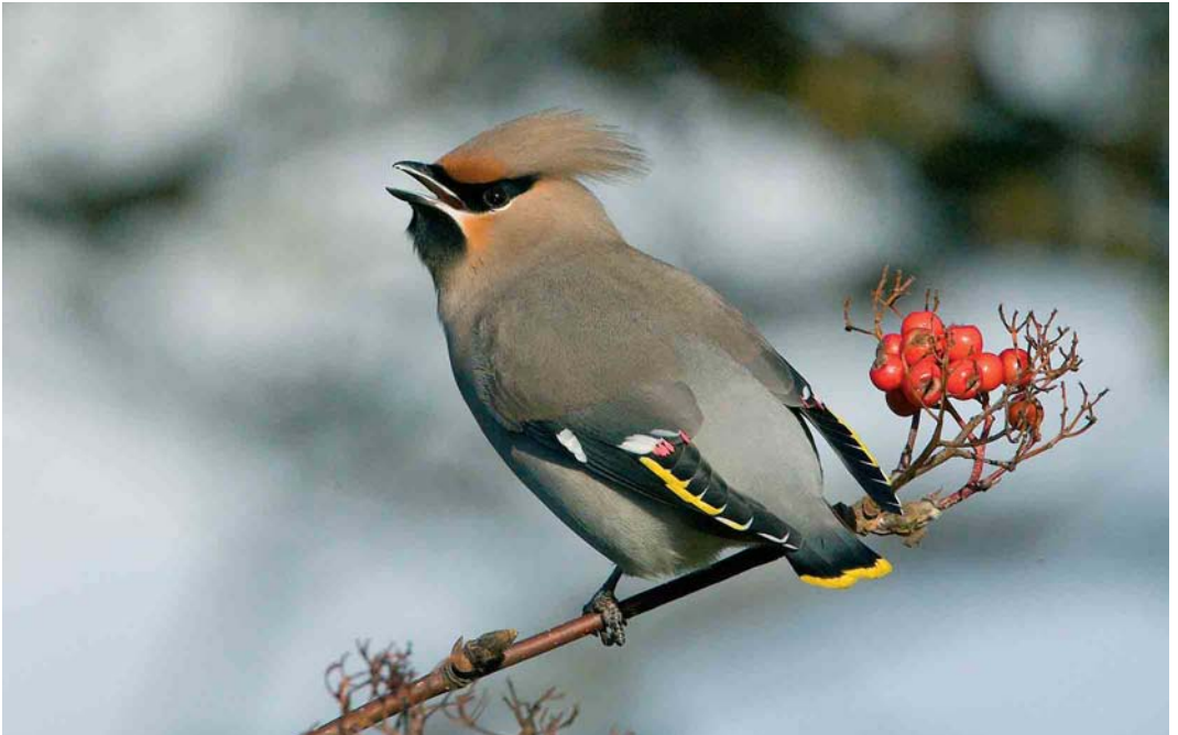
82 Pestvogel / Bohemian Waxwing Bombycilla garrulus , adult, Terschelling, Friesland, 17 november 2005