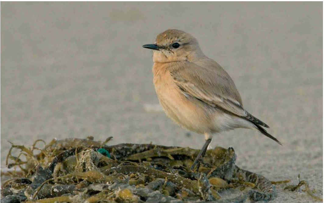
81 Izabeltapuit / Isabelline Wheatear Oenanthe isabellina , Terschelling, Friesland, 18 november 2005 (Arie Ouwerkerk)