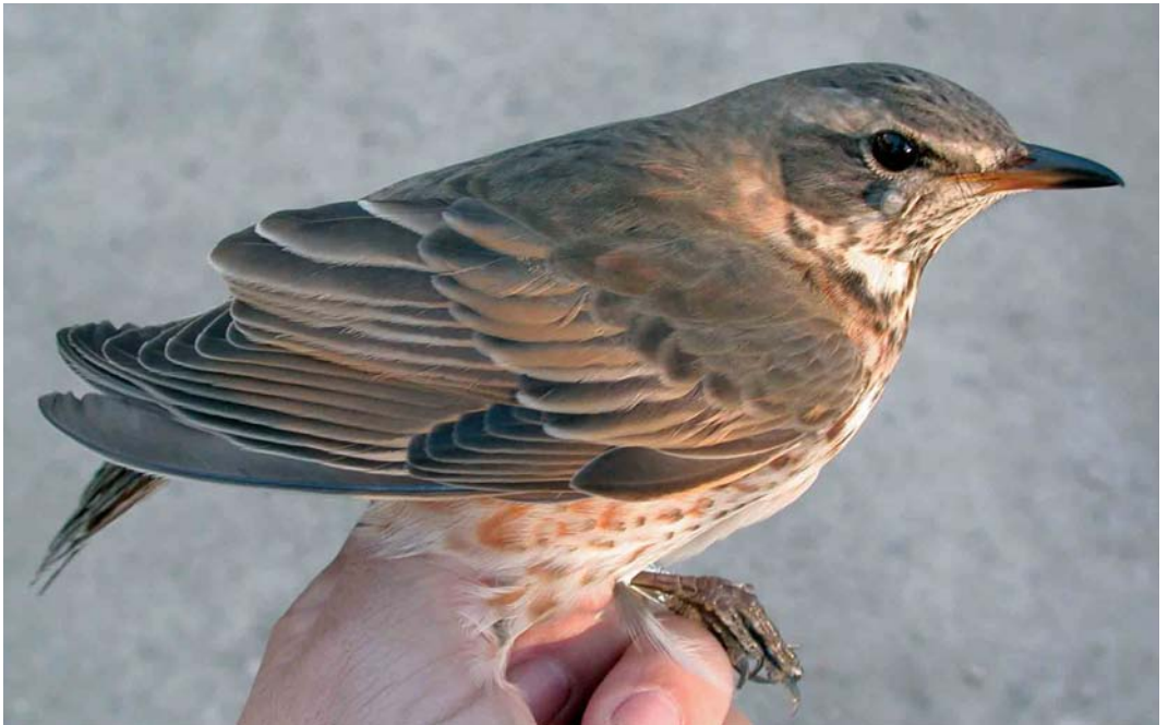
66 Naumann's Thrush / Naumanns Lijster Turdus naumanni , first-winter female, Canal Vell, Ebro delta, Tarragona, Spain, November 2005