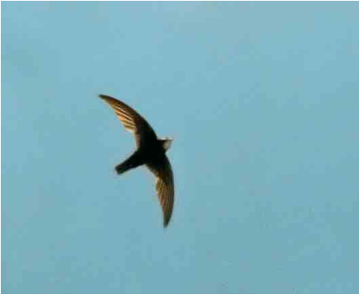
24 Little Swift / Huisgierzwaluw Apus affinis , Cádiz province, Andalucía, Spain, 14 June 2004