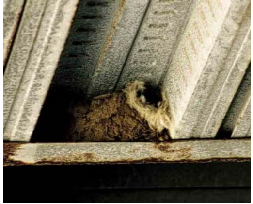
25 Nest of Little Swift / Huisgierzwaluw Apus affinis , Cádiz province, Andalucía, Spain, 14 June 2004