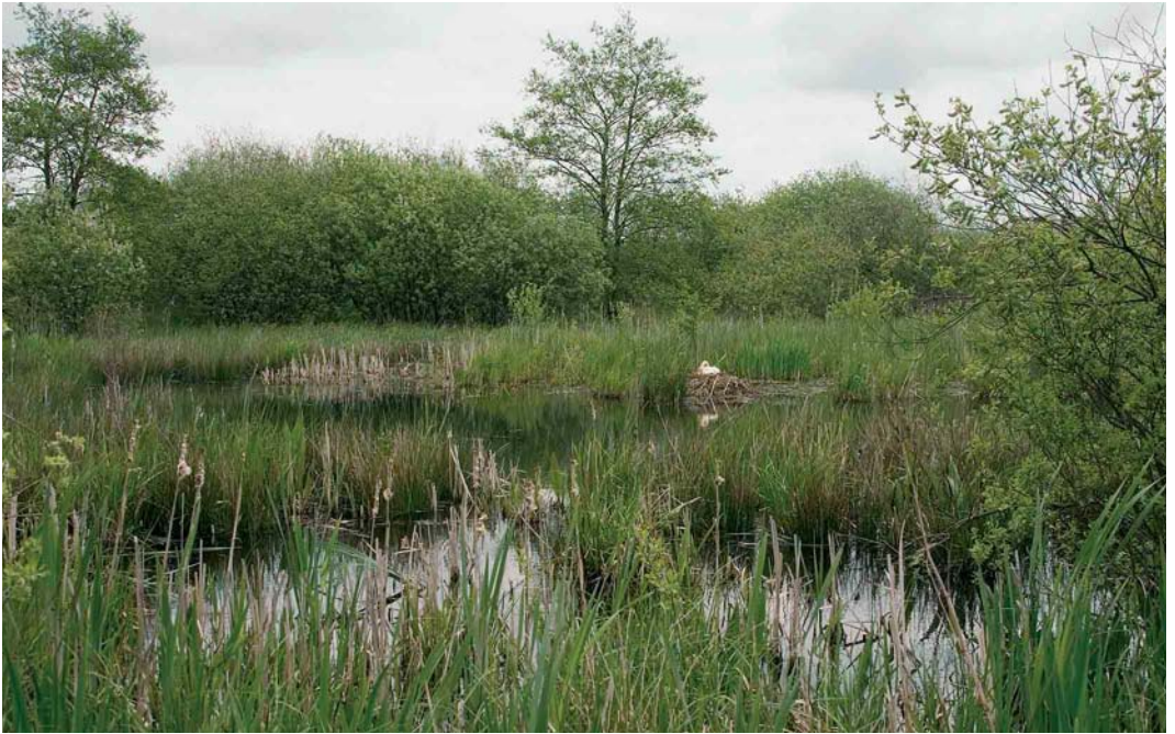
13 Wilde Zwaan / Whooper Swan Cygnus cygnus , adult vrouwtje op nest, Wapserveense Petgaten, Drenthe, 12 mei 2005 (Harvey van Diek)