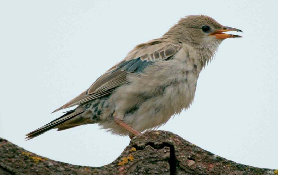
80 Roze Spreeuw / Rose-coloured Starling Sturnus roseus , juveniel ruiend naar eerste-winter, Wassenaar, Zuid-Holland, november 2005