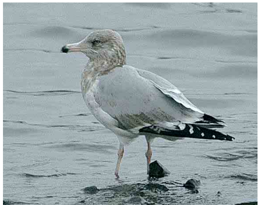
59 Little Swift / Huisgierzwaluw Apus affinis , Overstrand, Norfolk, England, 13 November 2005 cf Dutch Birding 27: 413, 2005 60 Grey Hypocolius / Zijdestaart Hypocolius ampelinus , adult male, Ghanatut, Abu Dhabi, United Arab Emirates, 4 January 2006 61 Dougall's Tern / Dougalls Stern Sterna dougallii , adult, Funchal, Madeira, 14 December 2005 62 Hume's Leaf Warbler / Humes Bladkoning Phylloscopus humei , Ouessant, Finistère, France, 8 January 2006 63 Lesser Sand Plover / Mongoolse Plevier Charadrius mongolus , Rewa, Hel peninsula, Poland, 30 December 2005 64 American Herring Gull / Amerikaanse Zilvermeeuw Larus smithsonianus , third-winter, Nimmo's Pier, Galway, Ireland, 2 January 2006