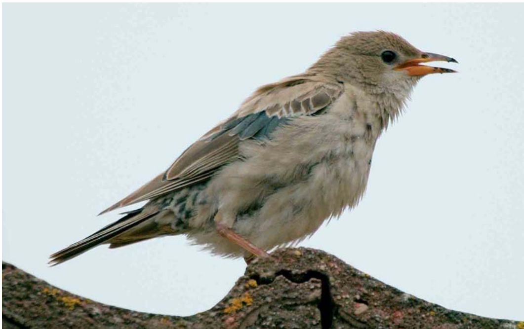
80 Roze Spreeuw / Rose-coloured Starling Sturnus roseus , juveniel ruiend naar eerste-winter, Wassenaar, Zuid-Holland, november 2005