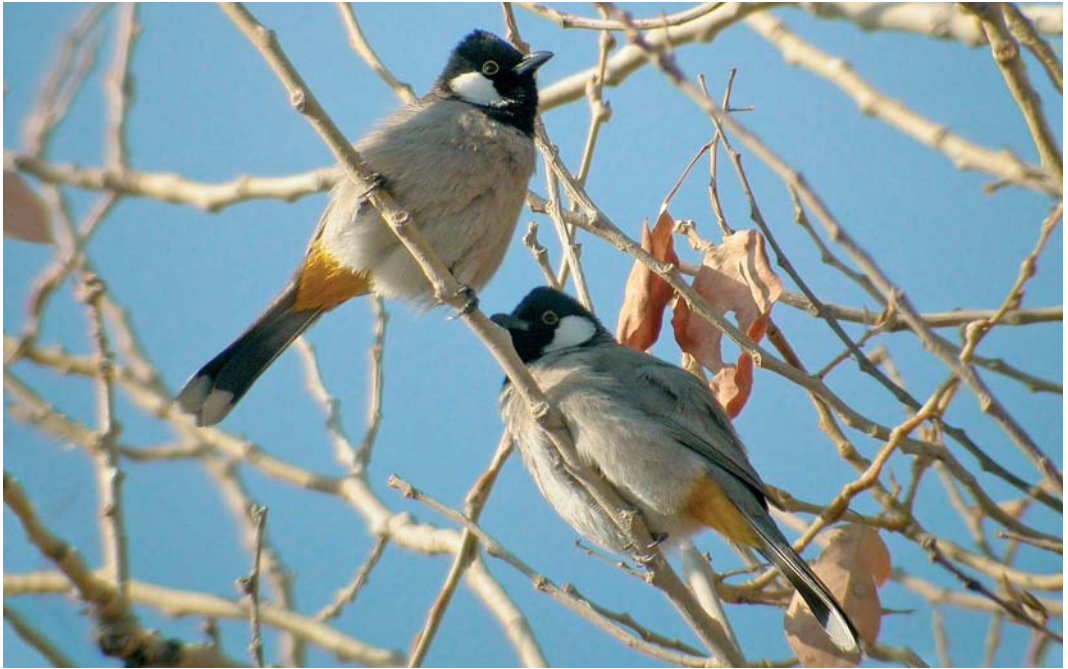
69 White-eared Bulbuls / Witoorbuulbuuls Pycnonotus leucotis , Deir ez-Zor, Syria, January 2006