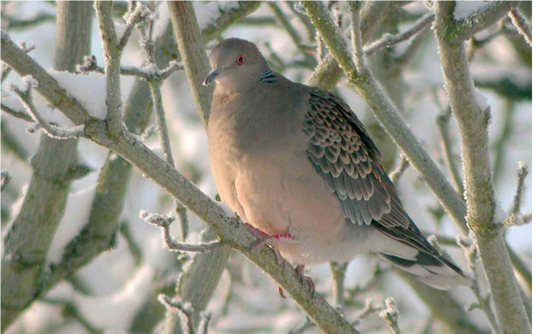
35 Oriental Turtle Dove / Oosterse Tortel Streptopelia orientalis , Falköping, Västergötland, Sweden, 3 January 2006 (David Erterius)