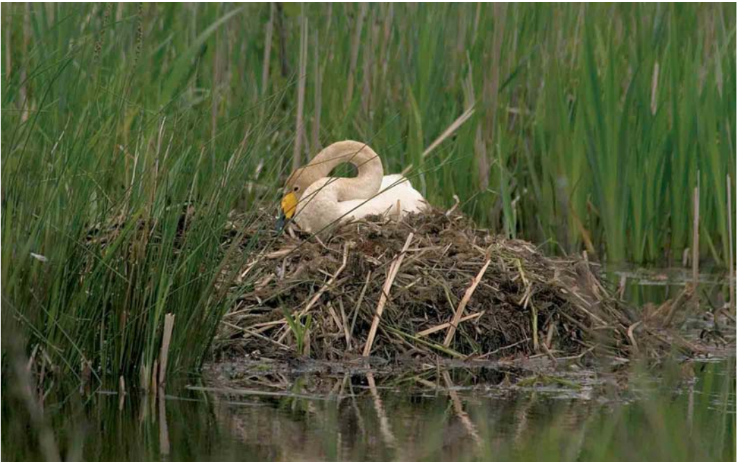
14 Wilde Zwaan / Whooper Swan Cygnus cygnus , adult vrouwtje op nest, Wapserveense Petgaten, Drenthe, 12 mei 2005 (Harvey van Diek)