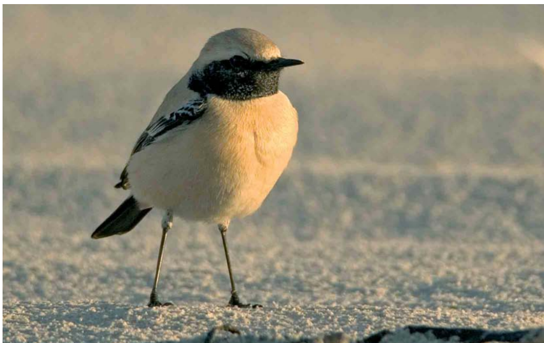
79 Woestijntapuit / Desert Wheatear Oenanthe deserti , mannetje, Vlieland, Friesland, 19 november 2005