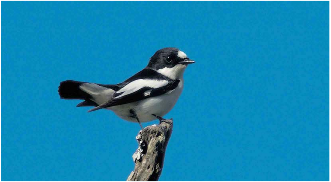
2 Atlas Flycatcher / Atlasvliegenvanger Ficedula speculigera , male, Beni M'tir, Jendouba, Tunisia, 3 May 2005

tant than Collared and European Pied (Sætre 2001ab), with which it was considered conspecific until at least 1977 (Voous 1977).