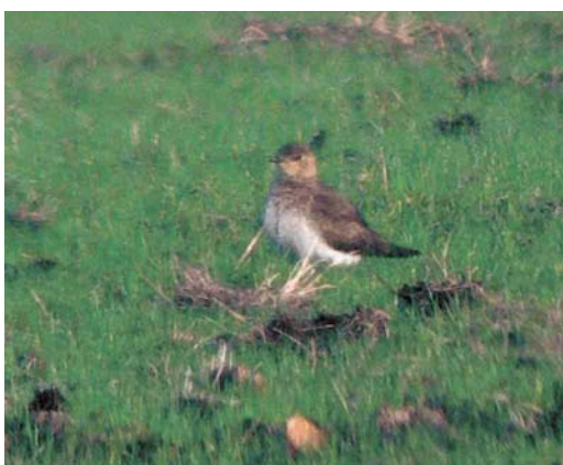
462 Witvleugelstern / White-winged Tern Chlidonias leucopterus , juveniel, Koarnwertersân, Friesland, 30 augustus 2006 463 Witvleugelstern / White-winged Tern Chlidonias leucopterus , juveniel, Ilmuiden, Noord-Holland, 30 augustus 2006 464 Terekruiter / Terek Sandpiper Xenus cinereus , met Scholeksters / Eurasian Oystercatchers Haematopus ostralegus , Den Helder, Noord-Holland, 12 juli 2006 465 Steppevorkstaartplevier / Black-winged Pratincole Glareola nordmanni , Durgerdam, Noord-Holland, 24 augustus 2006

snavelige stern met kenmerken van Sierlijke Stern S elegans werd op 16 juli gefotografeerd in de Mokbaai op Texel (cf Dutch Birding 28: 247, plaat 341, 2006). Op 21 augustus vloog een Zwarte Zeekoet Cephus grylle langs Terschelling, Friesland.