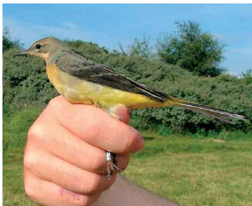
26 Grey Wagtail / Grote Gele Kwikstaart Motacilla cinerea , Meijndel, Zuid-Holland, Netherlands, 13 September 2005 (Ben M Wielstra)