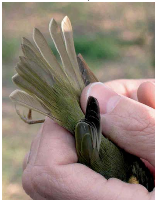
27 Eastern Crowned Warbler / Kroonboszanger Phylloscopus coronatus , Happy Island, Hebei, China, May 2005. Note that t4-6 show white fringes.

By now, we have gone through all Phylloscopus species depicted in the most commonly