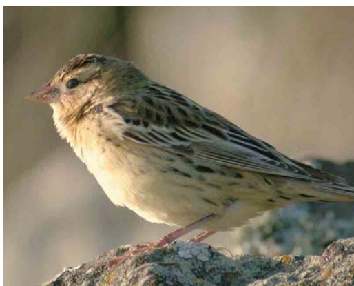
49 Hooded Warbler / Monnikszanger Wilsonia citrina , male, Corvo, Azores, 26 October 2005 (Peter Alfrey) 50 Myrtle Warbler / Mirteszanger Dendroica coronata , Lagoa Azul, São Miguel, Azores, 15 December 2005 (Stefan Pfützke) 51 Indigo Bunting / Indigogors Passerina cyanea , Corvo, Azores, 26 October 2005 (Peter Alfrey) 52 White-crowned Sparrow / Witkruingors Zonotrichia leucophrys , first-winter, Corvo, Azores, 25 October 2005 (Peter Alfrey) 53 Rose-breasted Grosbeak / Roodborstkardinaal Pheucticus ludovicianus , first-winter female, Corvo, Azores, October 2005 (Peter Alfrey) 54 Bobolink / Bobolink Dolichonyx oryzivorus , Corvo, Azores, 24 October 2005 (Peter Alfrey) for all, cf Dutch Birding 27: 413, 424-425, 2005