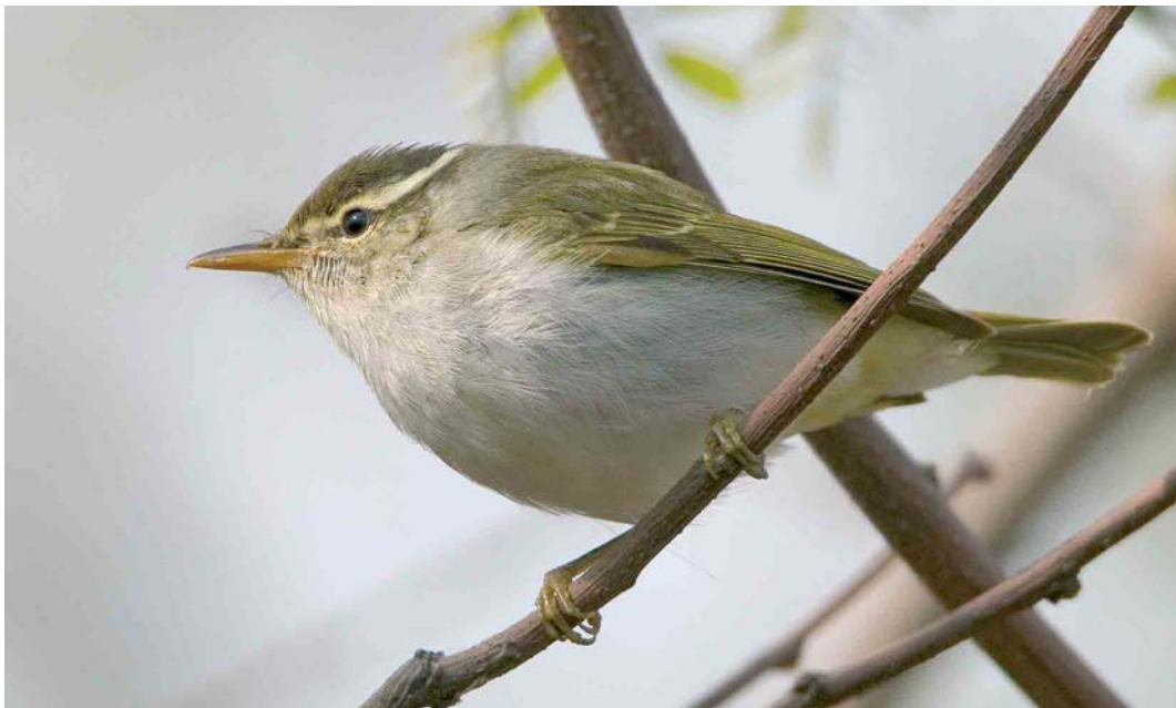
28 Eastern Crowned Warbler / Kroonboszanger Phylloscopus coronatus , Happy Island, Hebei, China, 4 May 2005 (Ran Schols). Eastern Crowned Warbler can appear rather similar to Arctic Warbler P borealis . Distinguishing features visible in this plate include the clean white underparts and the dark crown-side. 29 Eastern Crowned Warbler / Kroonboszanger Phylloscopus coronatus , Happy Island, Hebei, China, May 2005 (Jan Bisschop). From the Phylloscopus warblers recorded in the Western Palearctic, Eastern Crowned Warbler is the only species combining a pale median crown-stripe with plain tertials. Note also the strongly contrasting dark crown-side and the double wing-bar.