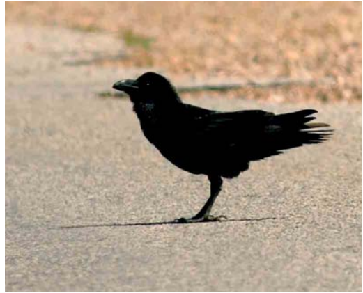
422 African Common Raven / Afrikaanse Raaf Corvus corax tingitanus , Rommani, Morocco, 28 March 2006 (Arnoud B van den Berg). This taxon can be identified by its small size (being the smallest Common Raven) and oily plumage colours.