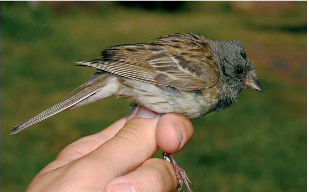
446 Black-faced Bunting / Maskergors Emberiza spodocephala , male, Helgoland, Schleswig-Holstein, Germany, 29 July 2006 (Martin Gottschling)