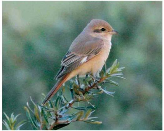
478 Daurische Klauwier / Daurian Shrike Lanius isabellinus , adult vrouwtje, Maasvlakte, Zuid-Holland, 27 augustus 2006

Dutch Birding-vogellijn in en belde veel mensen met de melding van een 'waarschijnlijke Turkse Klauwier, adult vrouwtje, aan de determinatie wordt gewerkt'.