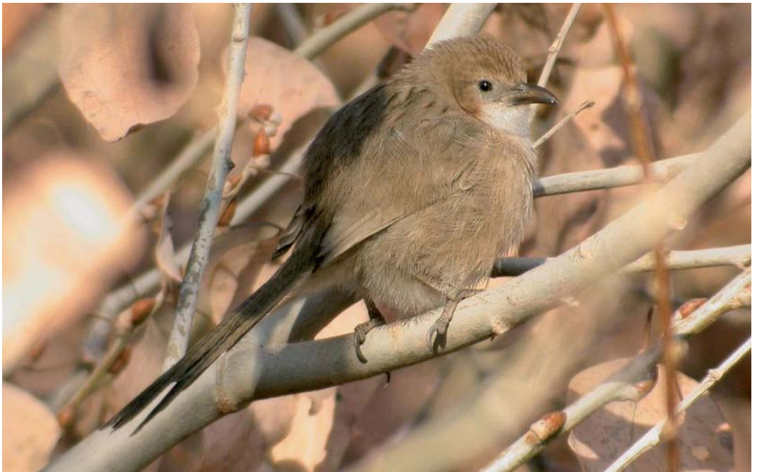
70 Iraq Babbler / Iraakse Babbelaar Turdoides altirostris , Mheimideh, Syria, January 2006