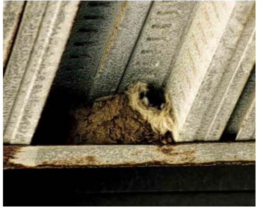
25 Nest of Little Swift / Huisgierzwaluw Apus affinis , Cádiz province, Andalucía, Spain, 14 June 2004 (Willem-Jan Fontijn)