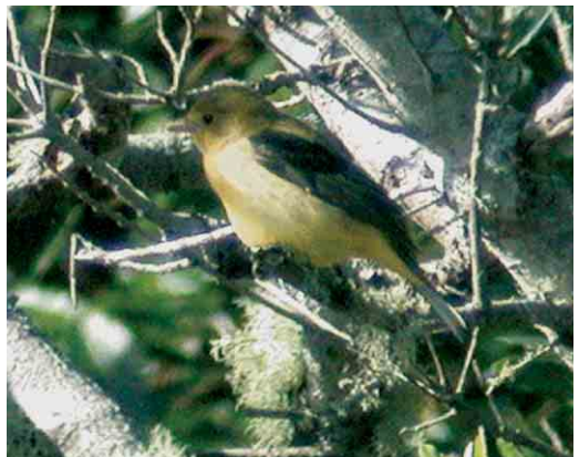
43 Upland Sandpiper / Bartrams Rüter Bartramia longicauda , Ponta Delgada, Flores, Azores, 31 October 2005 (Frédéric Jiguet) 44 Chimney Swift / Schoorsteengierzwaluw Chaetura pelagica , São Miguel, Azores, 28 October 2005 (Frédéric Jiguet) 45 Yellow-billed Cuckoo / Geelsnavelkoekoek Coccyzus americanus , Corvo, Azores, 19 October 2005 (Peter Alfrey) 46 Mourning Dove / Amerikaanse Treurduif Zenaida macroura , Corvo, Azores, 2 November 2005 (Peter Alfrey) 47 American Barn Swallow / Amerikaanse Boerenzwaluw Hirundo rustica erythrogaster , first-winter, Ponta Delgada, Flores, Azores, 30 October 2005 (Frédéric Jiguet) 48 Scarlet Tanager / Zwartvleugeltangare Piranga olivacea , first-winter male, Corvo, Azores, 28 October 2005 (Peter Alfrey) for all, cf Dutch Birding 27: 413, 424-425, 2005