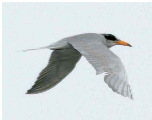
21-23 River Tern / Rivierstern Sterna aurantia , adult, Emer-Ab-Bandan, Golestan, Iran, 18 January 2005 (Jaap Schelvis)

HEAD Black cap extending beneath eye, with some white feathers on forehead and crown. Lore with some dark speckling.