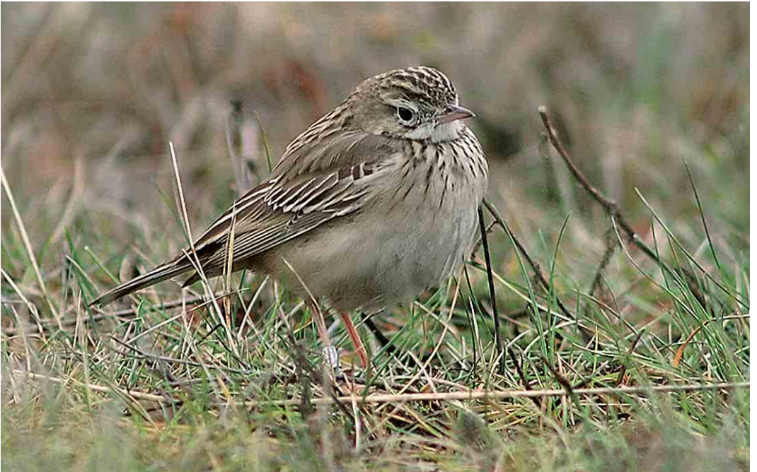
71 Blyth's Pipit / Mongoolse Pieper Anthus godlewskii , Lumijoki Varjakka, Finland, 22 November 2005 cf Dutch Birding 27: 413, 2005