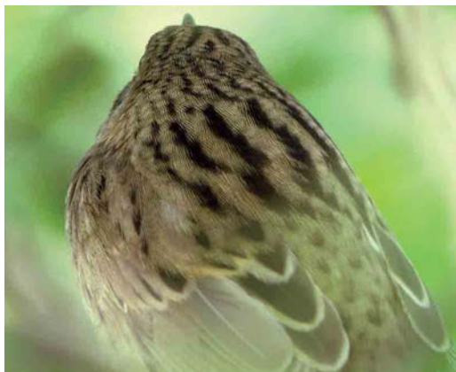
Mystery photograph II (May)

below carefully and identify the birds in the photographs. Solutions can be sent in three different ways: