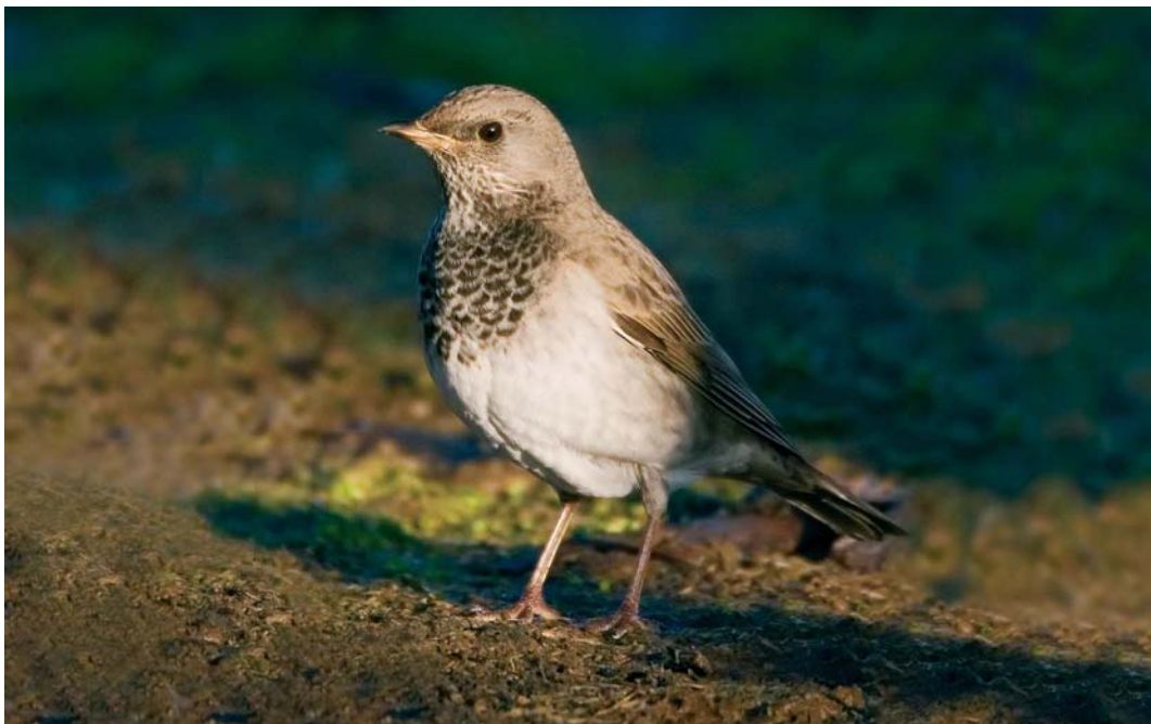
68 Black-throated Thrush / Zwartkeellijster Turdus atrogularis , male, Leira, Garður, Iceland, 14 November 2005 (Daniel Bergmann)