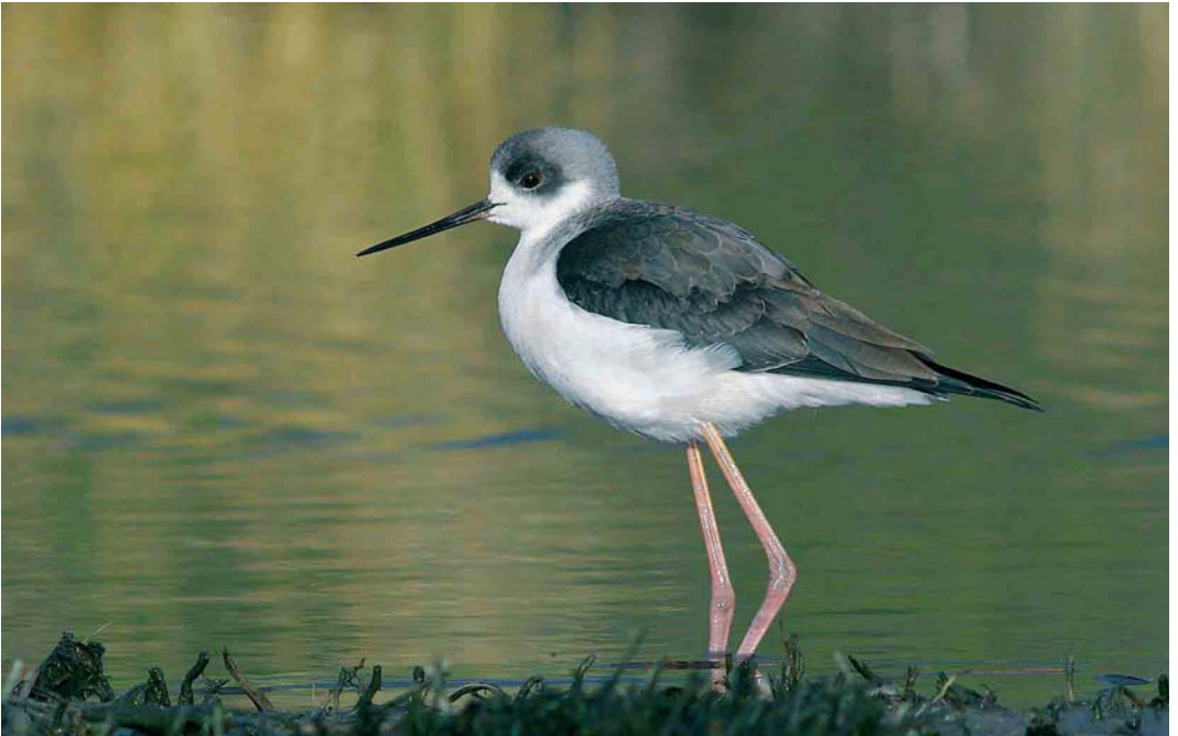
76 Steltkluut / Black-winged Stilt Himantopus himantopus , eerstejaars, Holwerd, Friesland, 25 december 2005