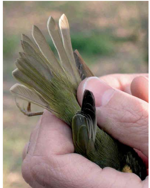
27 Eastern Crowned Warbler / Kroonboszanger Phylloscopus coronatus , Happy Island, Hebei, China, May 2005. Note that t4-6 show white fringes.

By now, we have gone through all Phylloscopus species depicted in the most commonly