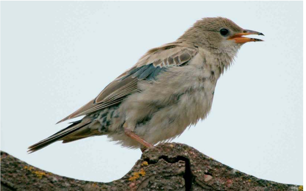
80 Roze Spreeuw / Rose-coloured Starling Sturnus roseus , juveniel ruiend naar eerste-winter, Wassenaar, Zuid-Holland, november 2005