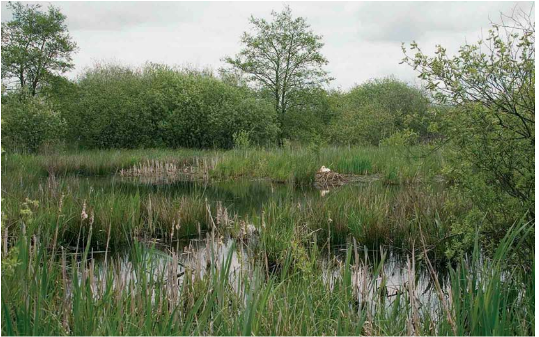
13 Wilde Zwaan / Whooper Swan Cygnus cygnus , adult vrouwtje op nest, Wapserveense Petgaten, Drenthe, 12 mei 2005