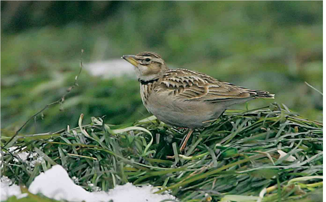
36 Bimaculated Lark / Bergkalanderleeuwerik Melanocorypha bimaculata , Ølsemagle Revle, Sjælland, Denmark, 4 January 2006 (Ole Krogh)