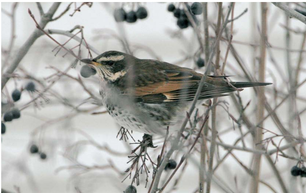
67 Dusky Thrush / Bruine Lijster Turdus eunomus , first-year, Raahe, Pitkäkari, Finland, 28 December 2005 (Pekka Komi)