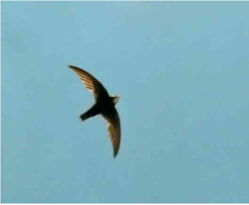
24 Little Swift / Huisgierzwaluw Apus affinis , Cádiz province, Andalucía, Spain, 14 June 2004 (Willem-Jan Fontijn)