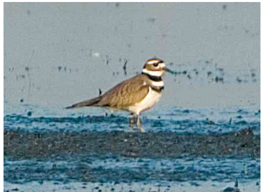
10-11 Killdeerplevier / Killdeer Charadrius vociferus , eerstejaars, Rottige Meente, Friesland, 4 april 2005

rand in veld moeilijk te zien maar op sommige foto's roodachtige tint zichtbaar. Poot grijsachtig groen.