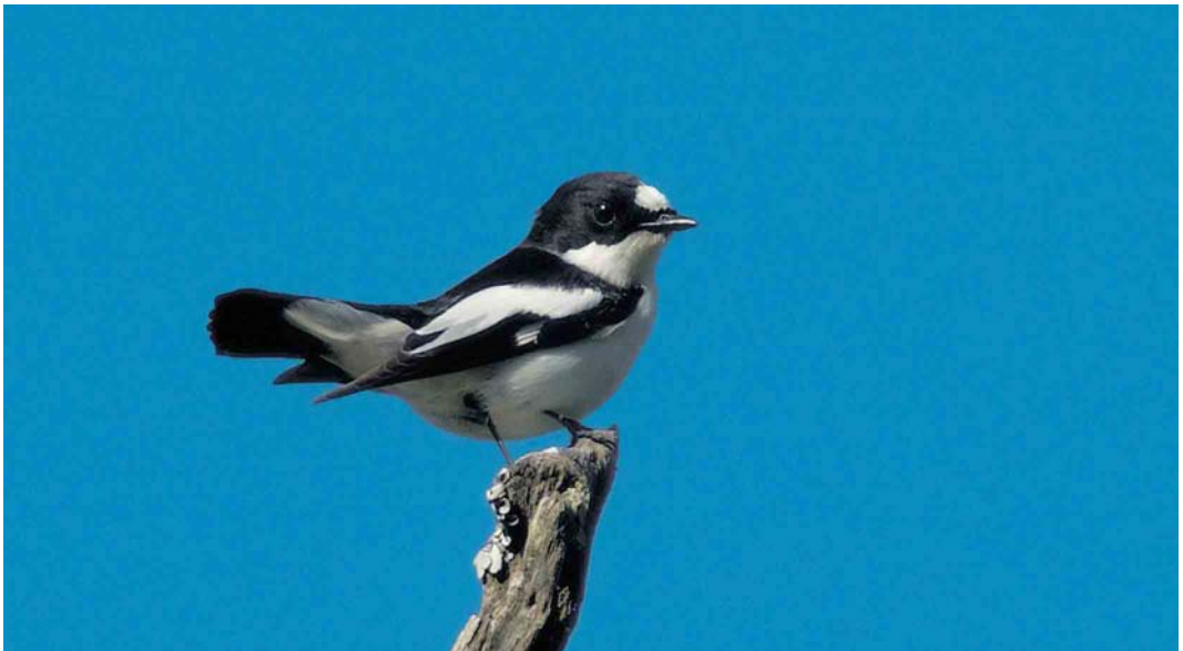
2 Atlas Flycatcher / Atlasvliegenvanger Ficedula speculigera , male, Beni M'tir, Jendouba, Tunisia, 3 May 2005

tant than Collared and European Pied (Sætre 2001ab), with which it was considered conspecific until at least 1977 (Voous 1977).