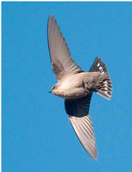
55 Steppe Grey Shrike / Steppeklapekster Lanius pallidirostris , Ree, Jæren, Rogaland, Norway, 22 November 2005 cf Dutch Birding 27: 421, 2005 56 Moroccan Pale Crag Martin / Marokkaanse Vale Rotszwaluw Ptyonoprogne obsoleta presaharica , Aouinet Torkoz, Lower Draa, Morocco, 10 January 2006 57 Desert Wheatear / Woestijntapuit Oenanthe deserti , Migra Ferha, Malta, December 2005 58 Upland Sandpiper / Bartrams Ruitter Bartramia longicauda , juvenile, Kingston Seymour, Somerset, England, 23 November 2005