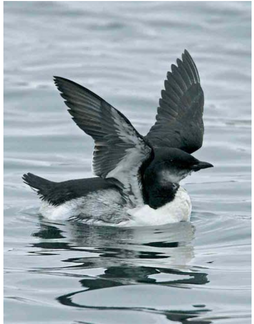
32 Kumlien's Gull / Kumliens Meeuw Larus glaucooides kumlieni , Nimmo's Pier, Galway, Ireland, 2 January 2006 33 Brännich's Murre / Kortbekzeekoet Uria lomvia , Lerwick harbour, Shetland, Scotland, November 2005 34 Forster's Tern / Forsters Stern Sterna forsteri , Cabo da Praia, Terceira, Azores, 22 November 2005