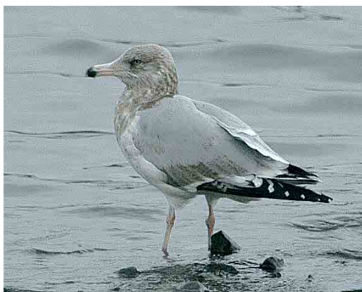
59 Little Swift / Huisgierzwaluw Apus affinis , Overstrand, Norfolk, England, 13 November 2005 cf Dutch Birding 27: 413, 2005 60 Grey Hypocolius / Zijdestaart Hypocolius ampelinus , adult male, Ghanatut, Abu Dhabi, United Arab Emirates, 4 January 2006 61 Dougall's Tern / Dougalls Stern Sterna dougallii , adult, Funchal, Madeira, 14 December 2005 62 Hume's Leaf Warbler / Humes Bladkoning Phylloscopus humei , Ouessant, Finistère, France, 8 January 2006 63 Lesser Sand Plover / Mongoolse Plevier Charadrius mongolus , Rewa, Hel peninsula, Poland, 30 December 2005 64 American Herring Gull / Amerikaanse Zilvermeeuw Larus smithsonianus , third-winter, Nimmo's Pier, Galway, Ireland, 2 January 2006