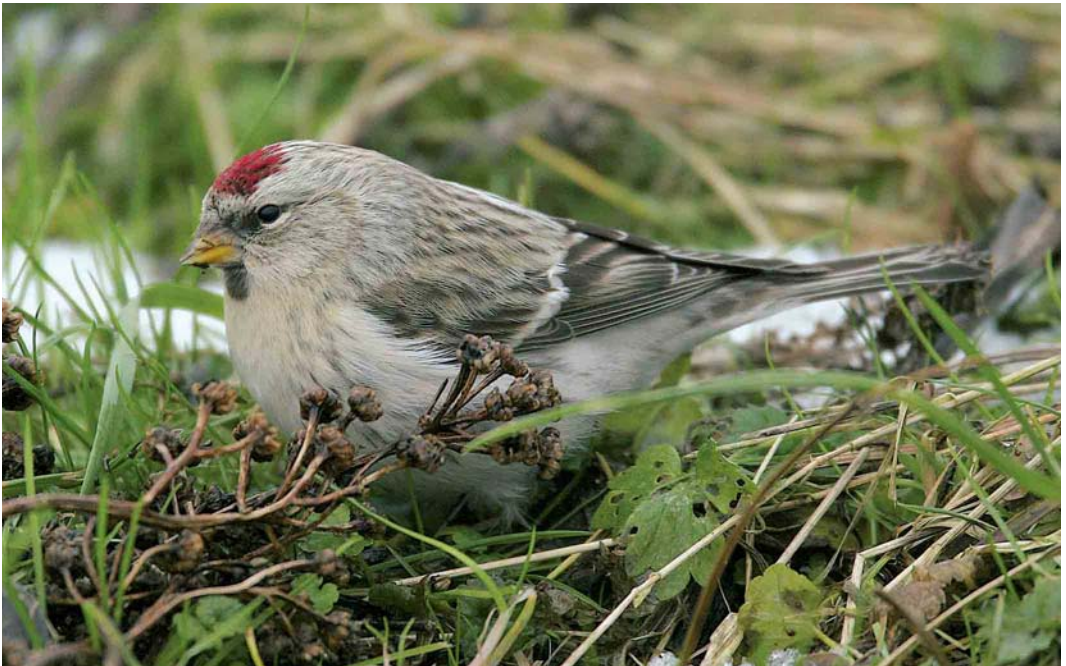
85 Witstuitbarmsijns / Arctic Redpoll Carduelis hornemanni , Zutphen, Gelderland, 31 december 2005