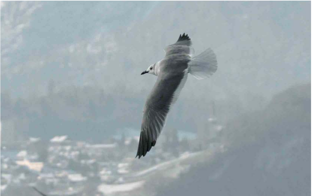
30 Laughing Gull / Lachmeeuw Larus atricilla , Merligen, Thuner See, Bern, Switzerland, 20 December 2005