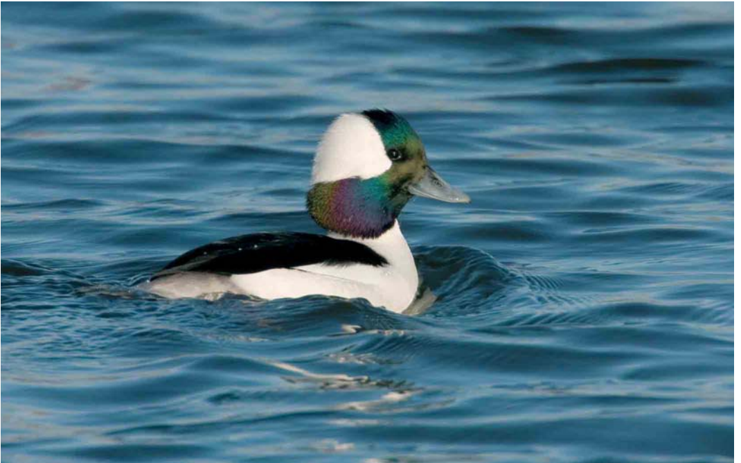
74 Buffelkopeend / Bufflehead Bucephala albeola , mannetje, Gaatkensplas, Barendrecht, Zuid-Holland, 26 december 2005