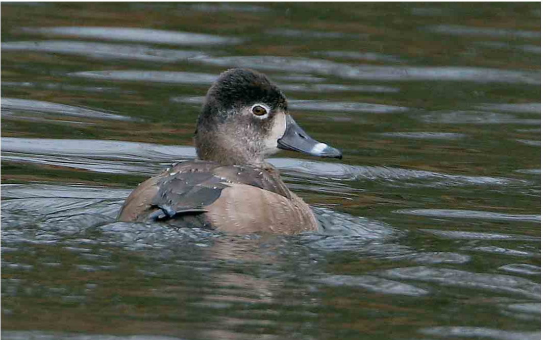
75 Ringsnaveleend / Ring-necked Duck Aythya collaris , vrouwtje, Zwolle, Overijssel, 5 december 2005 (Roland Jansen)