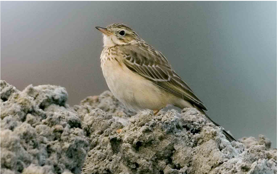
91 Mongoolse Pieper / Blyth's Pipit Anthus godlewskii , Oostende, West-Vlaanderen, 19 november 2005