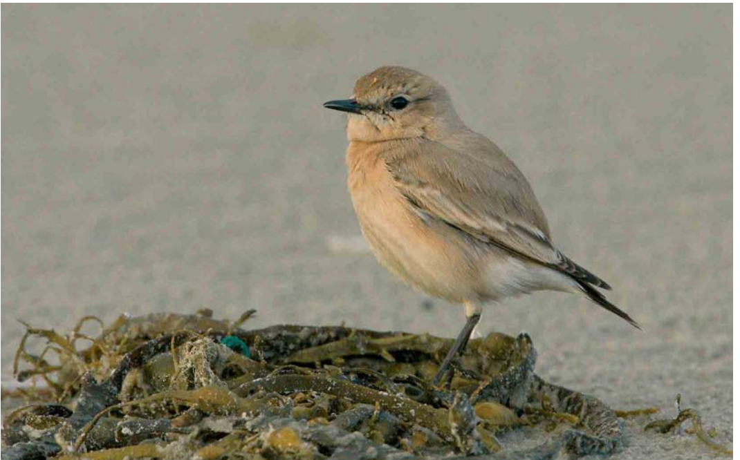
81 Izabeltapuit / Isabelline Wheatear Oenanthe isabellina , Terschelling, Friesland, 18 november 2005 (Arie Ouwerkerk)