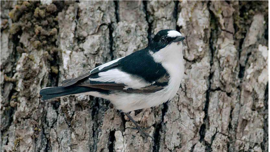
1 Atlas Flycatcher / Atlasvliegenvanger Ficedula speculigera , male, Beni M'tir, Jendouba, Tunisia, 3 May 2005 (René Pop)

Like Atlas Flycatcher, Iberian Pied Flycatcher is an allopatric taxon, coming into contact with other pied flycatcher taxa on migration only. The mitochondrial genetic distances between Semi-collared, Collared, nominate European Pied F h hypoleuca , Atlas and Iberian Pied Flycatchers are all of the order of 3-4%, apart from nominate European Pied and Iberian Pied which are c 0.5%, close to the intra-taxon differences of 0.12-0.39% (Sangster et al 2004). The latter is somewhat surprising because Iberian Pied looks much more similar to Atlas than to nominate European Pied (cf Cramp & Perrins 1993, Mild 1993). Of all pied flycatchers, Semi-collared appears to be more dis-