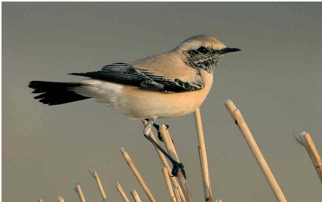
78 Woestijntapuit / Desert Wheatear Oenanthe deserti , adult mannetje, IJmuiden, Noord-Holland, 12 november 2005 (Christiaan Giljam)