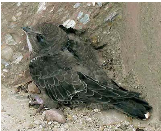
Mystery photograph I (July)