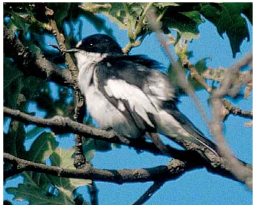
4 Atlas Flycatcher / Atlasvliegenvanger Ficedula speculigera , female, Beni M'tir, Jendouba, Tunisia, 3 May 2005 (René Pop) 5-7 Iberian Pied Flycatcher / Iberische Vliegenvanger Ficedula hypoleuca iberiae , male, Sierra de Gredos, Extremadura, Spain, 12 June 2002 (Arnoud B van den Berg) 8 Iberian Pied Flycatcher / Iberische Vliegenvanger Ficedula hypoleuca iberiae , female, Sierra de Gredos, Extremadura, Spain, 12 June 2002 (Arnoud B van den Berg) 9 Iberian Pied Flycatcher / Iberische Vliegenvanger Ficedula hypoleuca iberiae , male, Sierra de Gredos, Extremadura, Spain, 12 June 2002 (Arnoud B van den Berg)