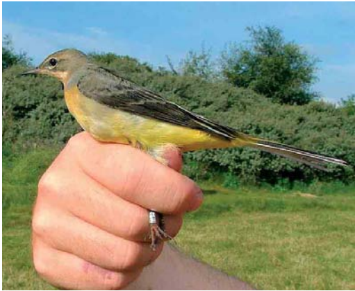
26 Grey Wagtail / Grote Gele Kwikstaart Motacilla cinerea , Meijndel, Zuid-Holland, Netherlands, 13 September 2005 (Ben M Wielstra)