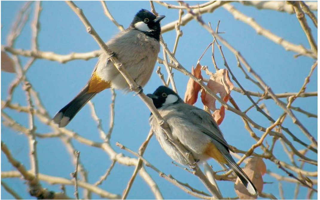
69 White-eared Bulbuls / Witoorbuulbuuls Pycnonotus leucotis , Deir ez-Zor, Syria, January 2006