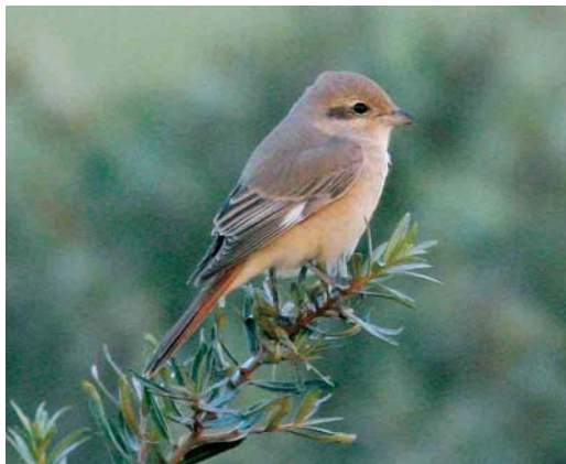
478 Daurische Klauwier / Daurian Shrike Lanius isabellinus , adult vrouwtje, Maasvlakte, Zuid-Holland, 27 augustus 2006

Dutch Birding-vogellijn in en belde veel mensen met de melding van een 'waarschijnlijke Turkse Klauwier, adult vrouwtje, aan de determinatie wordt gewerkt'.