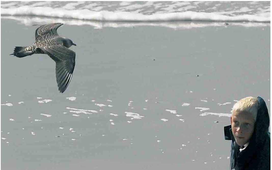
458 Kleinste Jager / Long-tailed Jaeger Stercorarius longicaudus , juveniel, Hondsbossche Zeewering, Noord-Holland, 30 augustus 2006 (Harm Niesen)