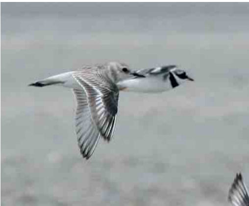
472-473 Woestijnplevier / Greater Sand Plover Charadrius leschenaultii , eerstejaars, met Bontbekplevier / Common Ringed Plover C hiaticula , IJmuiden, Noord-Holland, 4 augustus 2006

Kortbekzeekoet in Belgisch binnenland In de ochtend van 5 augustus 2006 kreeg ik (Tom Goossens), een telefoontje van boswachter Werner Van Hove met de mel-