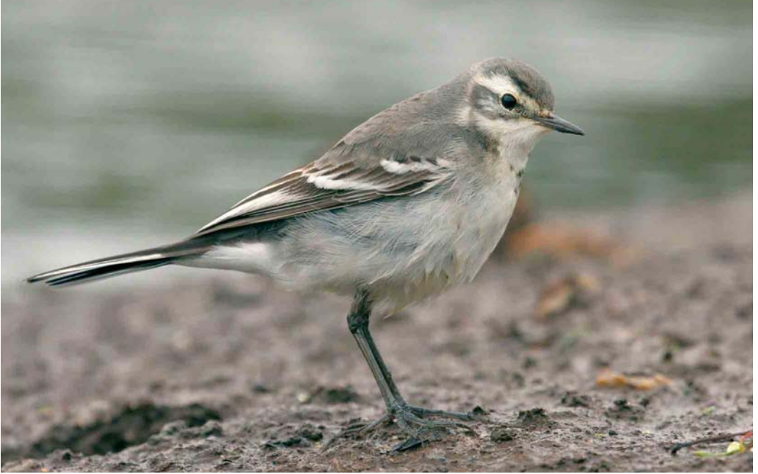
445 Citrine Wagtail / Citroenkwikstaart Motacilla citreola , first-year, Ouessant, Finistère, France, 2 September 2006 (Aurélien Audevard)