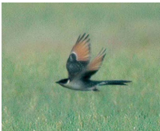
441 Eleonora's Falcon / Eleonora's Valk Falco eleonora , female, Albaron, Camargue, Bouches-du-Rhône, France, 4 August 2006 442 Franklin's Gull / Franklins Meeuw Larus pipixcan , adult, Larnaca, Cyprus, 5 August 2006 443 Olive-tree Warbler / Griekse Spotvogel Hippolais olivetorum , Boddam, Mainland, Shetland, Scotland, 16 August 2006 444 Great Spotted Cuckoo / Kuifkoekeek Clamator glandarius , Birkepøl, Als, Sønderjylland, Denmark, 2 August 2006

wild birds in Turkey had disappeared (cf Dutch Birding 11: 128-131, 1989). From a reintroduction scheme in Austria and Italy, colour-ringed individuals turned up at sites like Postojna, Slovenia, on 26 April (three) and La Tomina reserve, north of Modena, north-eastern Italy, from 19 August (five second-years).