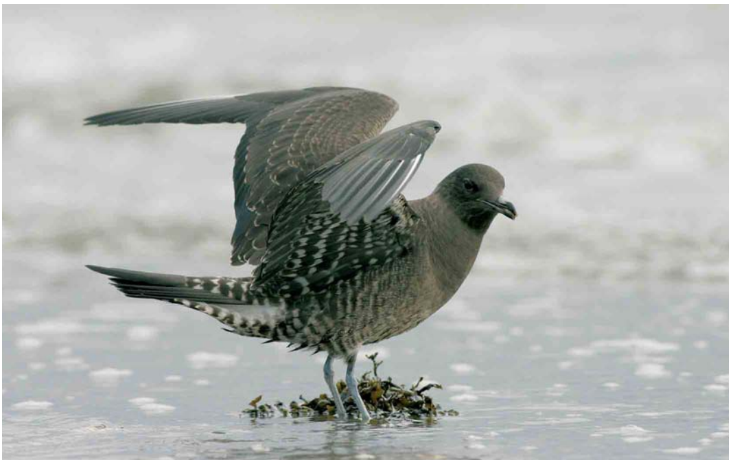
459 Kleinste Jager / Long-tailed Jaeger Stercorarius longicaudus , juveniel, Vlissingen, Zeeland, 31 augustus 2006