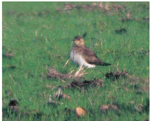
462 Witvleugelstern / White-winged Tern Chlidonias leucopterus , juveniel, Koarnwertersân, Friesland, 30 augustus 2006 463 Witvleugelstern / White-winged Tern Chlidonias leucopterus , juveniel, Ilmuiden, Noord-Holland, 30 augustus 2006 464 Terekruijer / Terek Sandpiper Xenus cinereus , met Scholeksters / Eurasian Oystercatchers Haematopus ostralegus , Den Helder, Noord-Holland, 12 juli 2006 465 Steppevorkstaartplevier / Black-winged Pratincole Glareola nordmanni , Durgerdam, Noord-Holland, 24 augustus 2006

snavelige stern met kenmerken van Sierlijke Stern S elegans werd op 16 juli gefotografeerd in de Mokbaai op Texel (cf Dutch Birding 28: 247, plaat 341, 2006). Op 21 augustus vloog een Zwarte Zeekoet Cephus grylle langs Terschelling, Friesland.