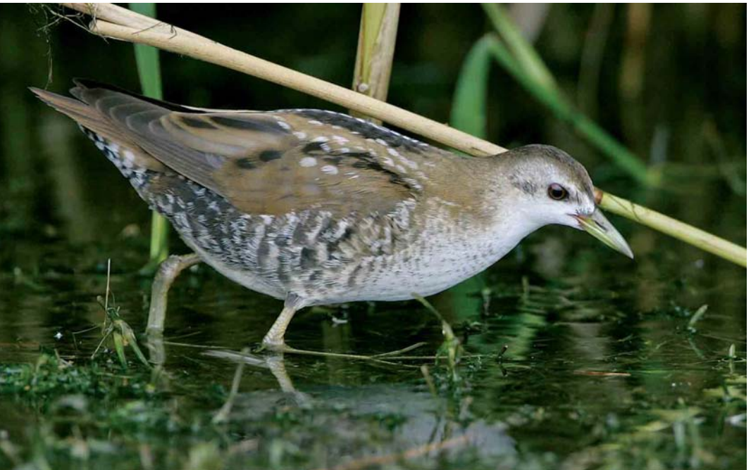
432 Little Crane / Klein Waterhoen Porzana parva , juvenile, Chablais de Cudrefin, Vaud, Switzerland, 20 August 2006