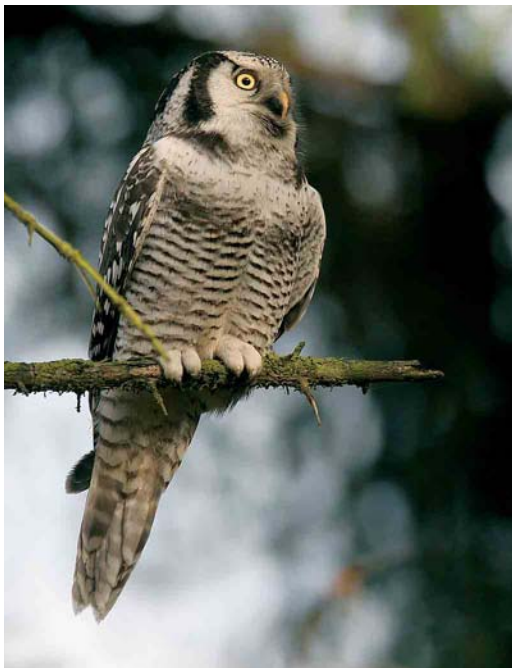
411 Sperweruil / Northern Hawk Owl Surnia ulula ulula , eerstejaars, Westerbork, Drenthe, 31 oktober 2005 412-413 Sperweruil / Northern Hawk Owl Surnia ulula ulula , eerstejaars, Westerbork, Drenthe, 31 oktober 2005