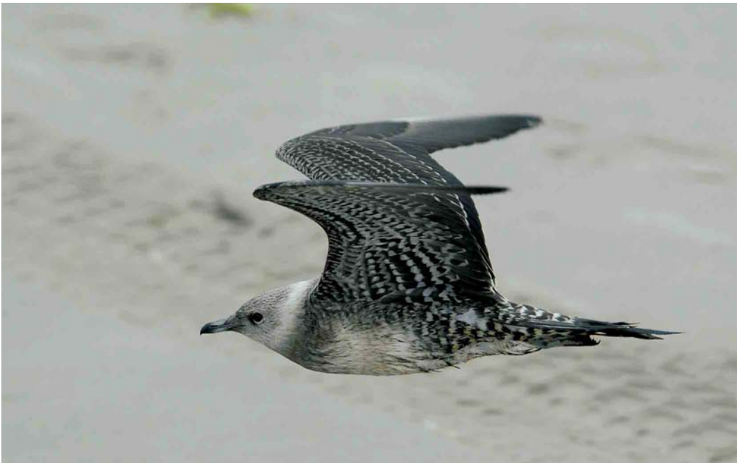
461 Kleinste Jager / Long-tailed Jaeger Stercorarius longicaudus , juveniel, Hondsbossche Zeewering, Noord-Holland, 30 augustus 2006 (Harm Niesen)