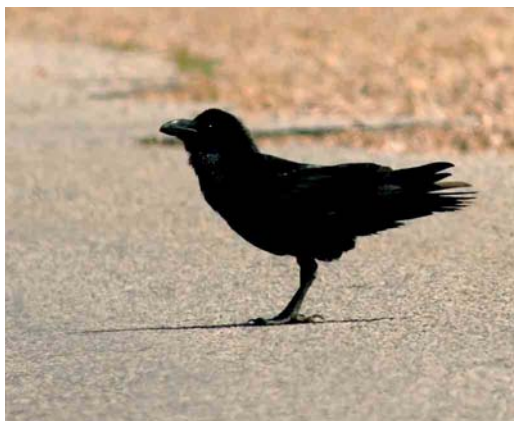
422 African Common Raven / Afrikaanse Raaf Corvus corax tingitanus , Rommani, Morocco, 28 March 2006. This taxon can be identified by its small size (being the smallest Common Raven) and oily plumage colours.