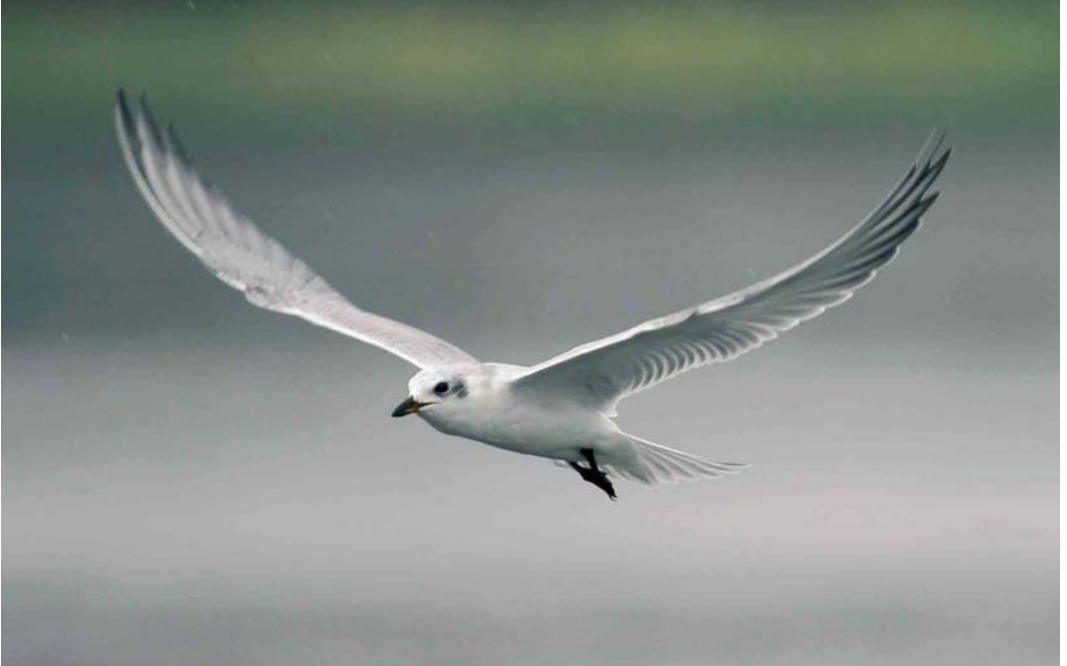
456 Lachstern / Gull-billed Tern Gelochelidon nilotica , 't Zand, Noord-Holland, 30 juli 2006 (Harm Niesen)