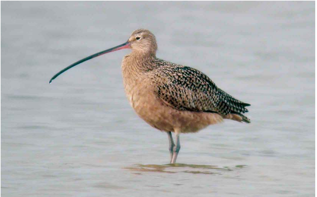
417 Long-billed Curlew / Amerikaanse Wulp Numenius americanus , Riohacha, Colombia, 16 March 2006

Long-billed Curlew is a breeding species in prairie habitats in North America. Two subspecies are recognized: the northerly breeding N a parvus and the more southerly N a americanus . Differences are very slight and probably clinal and only, as the name parvus (small) suggests, refer to size (Hayman et al 1986,