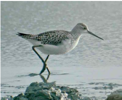
471 Poelruiter / Marsh Sandpiper Tringa stagnatilis , juveniel, Uitkerkse Polders, West-Vlaanderen, 2 augustus 2006 (Koen Verbanck)

KRAANVOGELS TOT ALKEN Bij Elsenborn, Liège, liep op 2 juli een Kraanvogel Grus grus . Een vorkstaartplevier Glareola vloog op 27 augustus roepend over het Houbenhof in Geistingen. De eerste Morinelplevier Charadrius morinellus voor het najaar trok op 12 augustus over Lommel. Daarna volgden waarnemingen bij Boneffe, Brabant-Wallon (c 13); Burdinne, Brabant-Wallon (zeven); Clermont-Viscourt, Brabant-Wallon (c 31); Diksmuide, West-Vlaanderen; Doornzele; Erps-Kwerps, Vlaams-Brabant (20+); Marche-en-Famenne, Luxembourg (acht); Knokke; Lampernisse, West-Vlaanderen; Meer, Vlaams-Brabant (17); Relegem-Asse, Vlaams-Brabant; Seraing-le-Château, Liège; en Tourinnes-la-Grosse, Brabant-Wallon (12). Op 19 juli verscheen een Temmincks Strandloper Calidris temminckii in Hollogne-sur-Geer, Liège, en in augustus werden er in totaal negen waargenomen. Een Poelsnip Gallinago media liet zich op 19 augustus erg kortstondig bekijken in de Uitkerkse Polders, West-Vlaanderen. Hier pleisterden van 30 juli tot 2 augustus twee juveniele Poelruiters Tringa stagnatilis die het de waar-