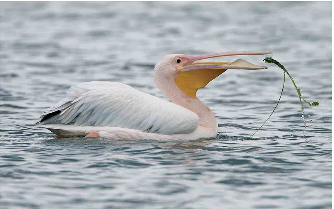
452 Roze Pelikaan / Great White Pelican Pelecanus onocrotalus , Mariëndal, Den Helder, Noord-Holland, 9 augustus 2006 (Christiaan Giljam)