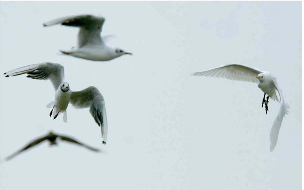
451 Koereiger / Cattle Egret Bubulcus ibis , met Kokmeeuwen / Black-headed Gulls Larus ridibundus , Middelaar, Limburg, 28 juli 2006