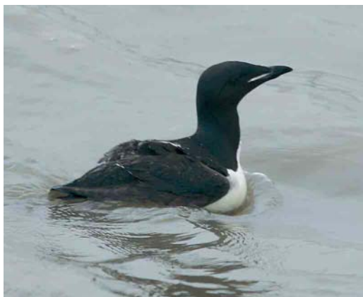
475 Kortbekzeekoet / Brännich's Murre Uria lomvia , adult (opgeraapt bij Lille, Antwerpen, op 5 augustus 2006), Oostende, West-Vlaanderen, 15 augustus 2006