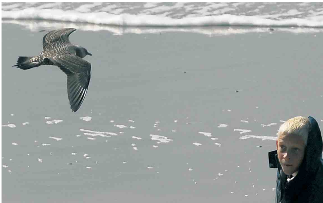
458 Kleinste Jager / Long-tailed Jaeger Stercorarius longicaudus , juveniel, Hondsbossche Zeewering, Noord-Holland, 30 augustus 2006 (Harm Niesen)