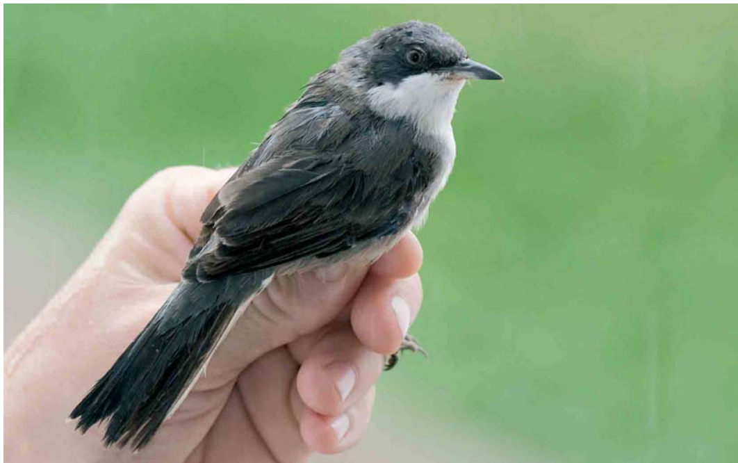
448 Eastern Orphean Warbler / Oostelijke Orpheusgrasmus Sylvia crassirostris , Halten, Sør-Trøndelag, Norway, 3 September 2006

SHRIKES TO BUNTINGS An adult female Daurian Shrike Lanius isabellinus watched briefly at Maasvlakte, Rotterdam, Zuid-Holland, on 27 August was the fifth for the Netherlands. Lesser Grey Shrikes L. minor were present at Borris Hede, Vestjylland, on 5-6 August and at Kvåle, Voss, Hordaland, Norway, on 20 August. A second pair of 'wild' Red-billed Choughs Pyrrhonorax pyrrhonorax raised three young in Cornwall this summer. In 2001, the first pair turned up in Lizard after a long absence of the species from Cornwall; it bred every year since, producing a total offspring of 20 in five seasons. The second pair consists of a Cornish born male from the 2004 Lizard brood and a female that arrived naturally. The species' natural recolonization process is threatened by plans to release captive-bred individuals. A Trumpeter Finch Bucanetes githagineus was found in Toscana in central Italy on 16 July. The third Black-faced Bunting Emberiza spodocephala for Helgoland was a male trapped on 29 July. On 24 June, a male Cirl Bunting E. cirlus was photographed at Zielbeek, Limburg, Belgium, c 5 km from the Dutch border. On Utsira, a Yellow-breasted Bunting E. aureola was seen on 18 August and a male Black-headed Bunting E. melanocephala on 8 August. A first-year Yellow-breasted Bunting was briefly seen at West