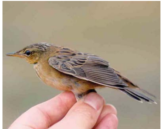
395-396 Siberische Sprinkhaanzanger / Pallas's Grasshopper Warbler Locustella certhiola , eerstejaars, Castricum, Noord-Holland, 27 september 2002 397-398 Siberische Sprinkhaanzanger / Pallas's Grasshopper Warbler Locustella certhiola , Castricum, Noord-Holland, 12 september 2003

geringd (Arnhem AE77710). Ook nu werden andere ringers telefonisch gewaarschuwd maar de belangstelling om te komen was, na de vogel van zes dagen eerder, matig. Alleen René Dekker was genegen de vogel op de gevoelige plaat vast te leggen. Hij werd nabij de ringershut losgelaten en vloog hoog naar het zuiden weg; tijdens een latere mistnetronde werd hij 100 m zuidelijker nog even in een struweel van Witte Abelen Populus alba gezien. Een beschrijving van de vogel staat in appendix 1.