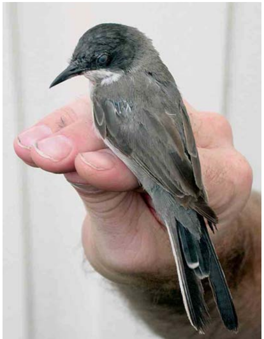
447 Eastern Orphean Warbler / Oostelijke Orpheusgrasmus Sylvia crassirostris , Halten, Sør-Trøndelag, Norway, 12 August 2006 (Magne Myklebust)

THRUSHES TO BABBLERS An Isabelline Wheatear Oenanthe isabellina at Eemshaven, Groningen, from 31 August to 4 September was the fifth for the Netherlands and the earliest ever. A Zitting Cisticola Cisticola juncidis photographed at Saint Margaret's, Cliffe, Kent, on 25 August was the fifth for Britain. A first-winter Olive-tree Warbler Hippolais olivetorum photographed at Boddam, Mainland, Shetland, on 16 August was the first for western Europe (except for claims on Helgoland in May 1860 and May 1954). Paddyfield