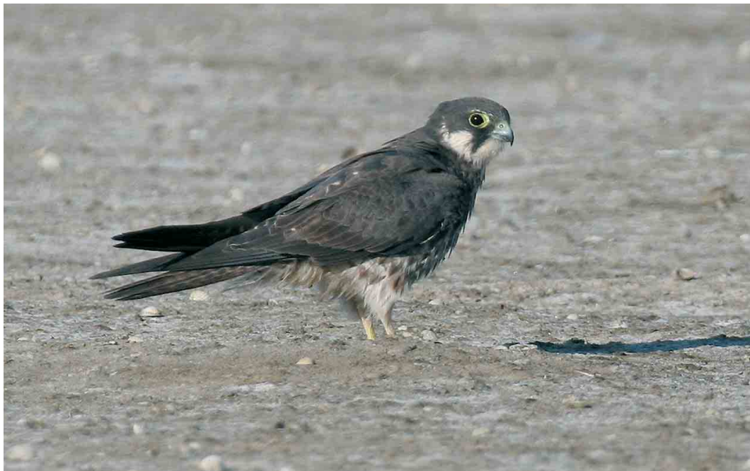
433 Eleonora's Falcon / Eleonora's Valk Falco eleonora , immature, Piémanson, Camargue, Bouches-du-Rhône, France, 14 August 2006 (Marc Thibault)