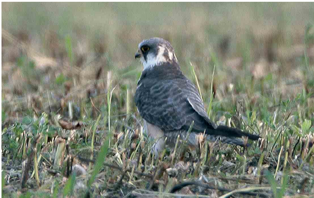
434 Amur Falcon / Amoerroodpootvalk Falco amurensis , female, Jaszbereny, Hungary, July 2006 (János Oláh)