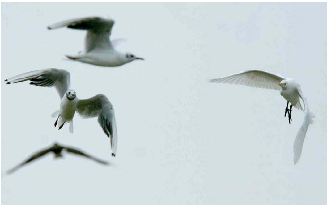
451 Koereiger / Cattle Egret Bubulcus ibis , met Kokmeeuwen / Black-headed Gulls Larus ridibundus , Middelaar, Limburg, 28 juli 2006