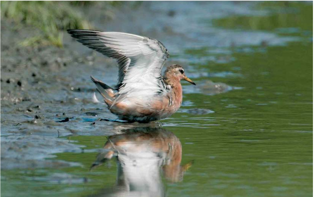
457 Rosse Franjepoot / Red Phalarope Phalaropus fulicarius , Wanteskuup, Zeeland, 1 juli 2006 (Niels de Schipper)