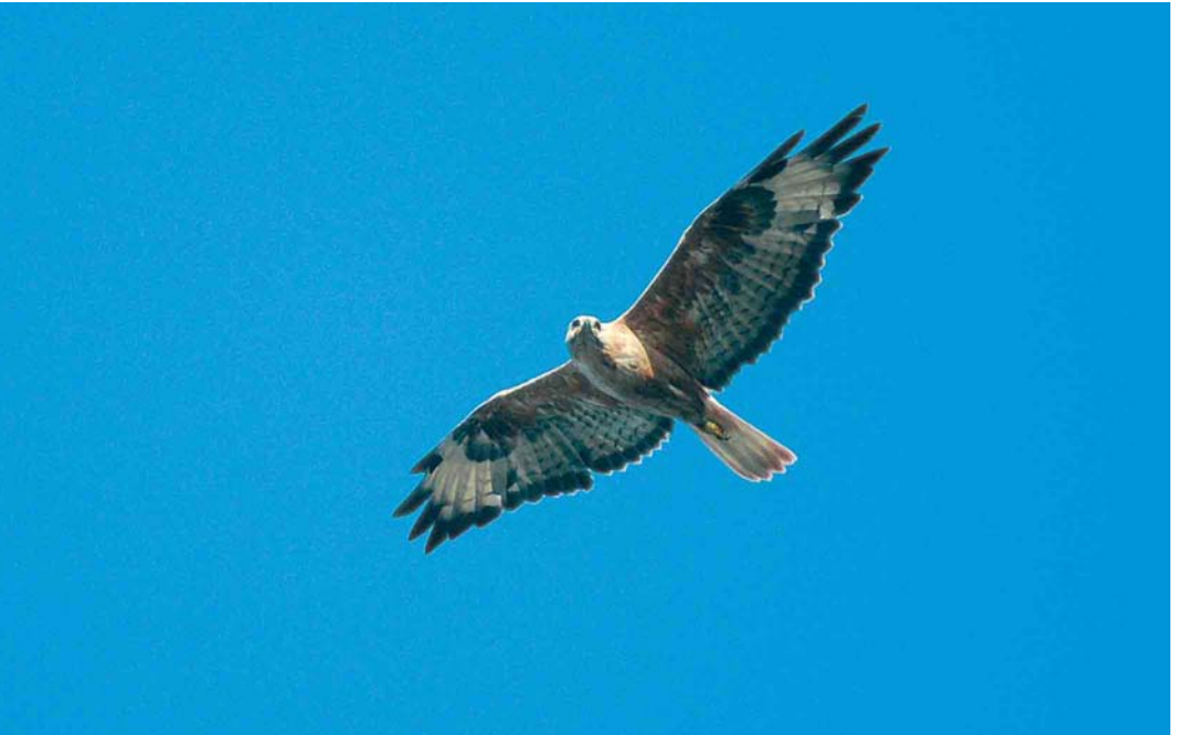
431 Long-legged Buzzard / Arendbuizerd Buteo rufinus , Helgoland, Schleswig-Holstein, Germany, 16 July 2006 (Martin Gottschling)