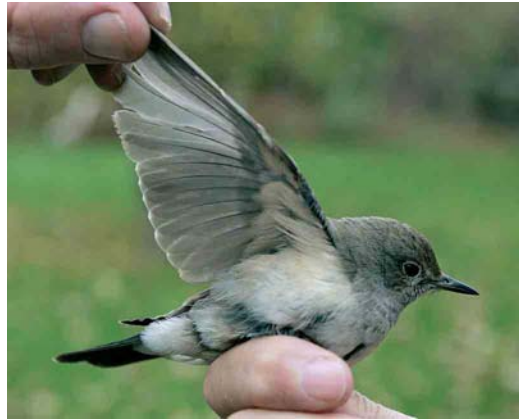
419-420 Perzische Roodborst / White-throated Robin Irania gutturalis , eerste-winter, Roptazijl, Pietersbierum, Friesland, 31 oktober 2005