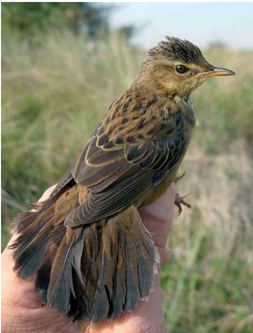
400 Siberische Sprinkhaanzanger / Pallas's Grasshopper Warbler Locustella certhiola , Castricum, Noord-Holland, 20 september 2005

wind (zuidwest 1) en vrijwel onbewolkt. Om 08:15 werd de vijfde Siberische Sprinkhaanzanger uit de geschiedenis van het ringstation gevangen. Ook deze vogel hing in een mistnet van de 'brugsectie'. Hij werd om 08:30 geringd (Arnhem AJ12720). In afwachting van de komst van de telefonisch gewaarschuwde André van Loon kreeg de vogel wat water en werd in een bewaarzak gedaan. Om 10:00 werd hij in één sessie gemeten, beschreven, gevideod en gefotografeerd, en om 11:00 bij de vinkershut losgelaten. Een beschrijving van de vogel staat in appendix 1.