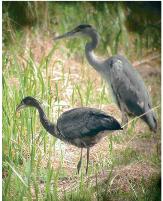
416 Blauwe Reigers / Grey Herons Ardea cinerea , Capelle aan den IJssel, Zuid-Holland, 23 juli 2006 (Willem van Rijswijk)

kant te vissen maar was hierin niet succesvol. Op basis van deze kenmerken is het het meest waarschijnlijk dat het een afwijkende (eerstejaars) Blauwe Reiger was.