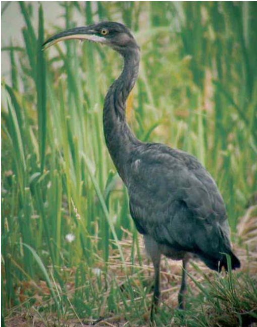
415 Blauwe Reiger / Grey Heron Ardea cinerea , Capelle aan den IJssel, Zuid-Holland, 23 juli 2006 (Willem van Rijswijk)