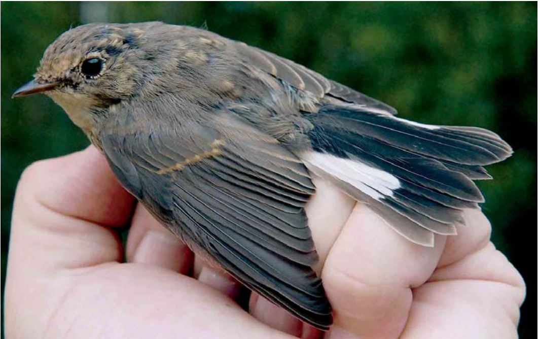
470 Kleine Vliegenvanger / Red-breasted Flycatcher Ficedula parva , eerstejaars, Groene Glop, Schiermonnikoog, Friesland, 26 augustus 2006

Camperduin, op 4 augustus over het Ballooërveld, Drenthe, en op 5 augustus bij Bennekom, Gelderland. Na 17 augustus volgden nog eens 26 exemplaren. De