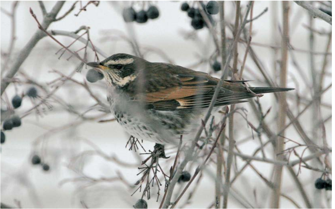
67 Dusky Thrush / Bruine Lijster Turdus eunomus , first-year, Raahe, Pitkäkari, Finland, 28 December 2005