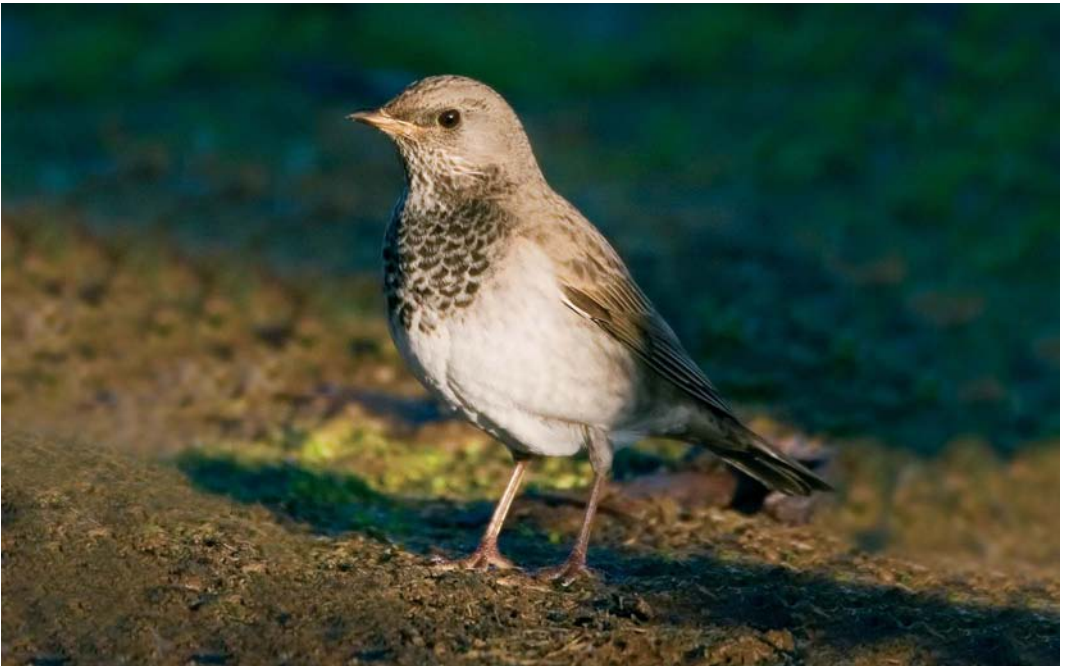
68 Black-throated Thrush / Zwartkeellijster Turdus atrogularis , male, Leira, Garður, Iceland, 14 November 2005 (Daniel Bergmann)