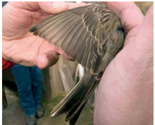
405 Steenortolaan / Grey-necked Bunting Emberiza buchanani , eerstejaars mannetje, Castricum, Noord-Holland, 16 oktober 2004 406 Steenortolaan / Grey-necked Bunting Emberiza buchanani , eerstejaars mannetje, Castricum, Noord-Holland, 16 oktober 2004 407-408 Steenortolaan / Grey-necked Bunting Emberiza buchanani , eerstejaars mannetje, Castricum, Noord-Holland, 16 oktober 2004

keelortolaan, het lichtst bij Steenortolaan) en een witte keel, buik en anaalstreek, en lijken daarmee op juveniele; dit is vooral bij vrouwtjes het geval. Veel vogels (vooral mannetjes) tonen echter de kleuren van het adulte kleed op de onderzijde, al zijn die kleuren vaak nog geheel of ten dele bedekt onder bredere of smalle witte veerranden. Bij Ortolaan zijn de mondstreep en keel vaak al grotendeels bleekgeel en is wat grijs zichtbaar op de bovenborst en rossig oranje op de benedenborst en buik; bij Bruinkeelortolaan en Steenortolaan kunnen mondstreep, keel, borst en buik al iets tot veel rossig oranje tonen, een tint die zich bij Bruinkeelortolaan (maar niet Steenortolaan) uitbreidt tot de onderstaartdekveren. De Castricum-vogel, met (deels verborgen) rossig oranje tinten op keel, borst en buik, kan op grond van dit kenmerk geen Ortolaan zijn, terwijl de rozewitte onderstaart Bruinkeelortolaan uitsluit.