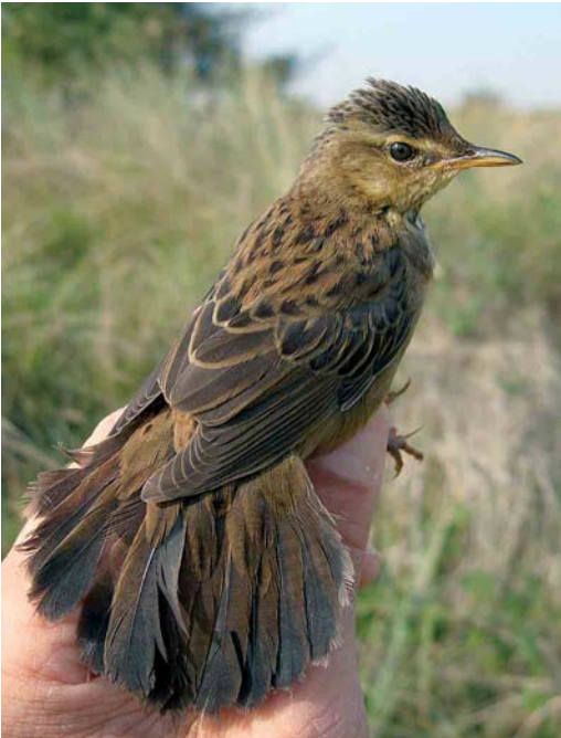
400 Siberische Sprinkhaanzanger / Pallas's Grasshopper Warbler Locustella certhiola , Castricum, Noord-Holland, 20 september 2005

wind (zuidwest 1) en vrijwel onbewolkt. Om 08:15 werd de vijfde Siberische Sprinkhaanzanger uit de geschiedenis van het ringstation gevangen. Ook deze vogel hing in een mistnet van de 'brugsectie'. Hij werd om 08:30 geringd (Arnhem AJ12720). In afwachting van de komst van de telefonisch gewaarschuwde André van Loon kreeg de vogel wat water en werd in een bewaarzak gedaan. Om 10:00 werd hij in één sessie gemeten, beschreven, gevideod en gefotografeerd, en om 11:00 bij de vinkershut losgelaten. Een beschrijving van de vogel staat in appendix 1.