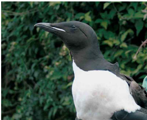
474 Kortbekzeekoet / Brunnich's Murre Uria lomvia , adult, Lille, Antwerpen, 5 augustus 2006