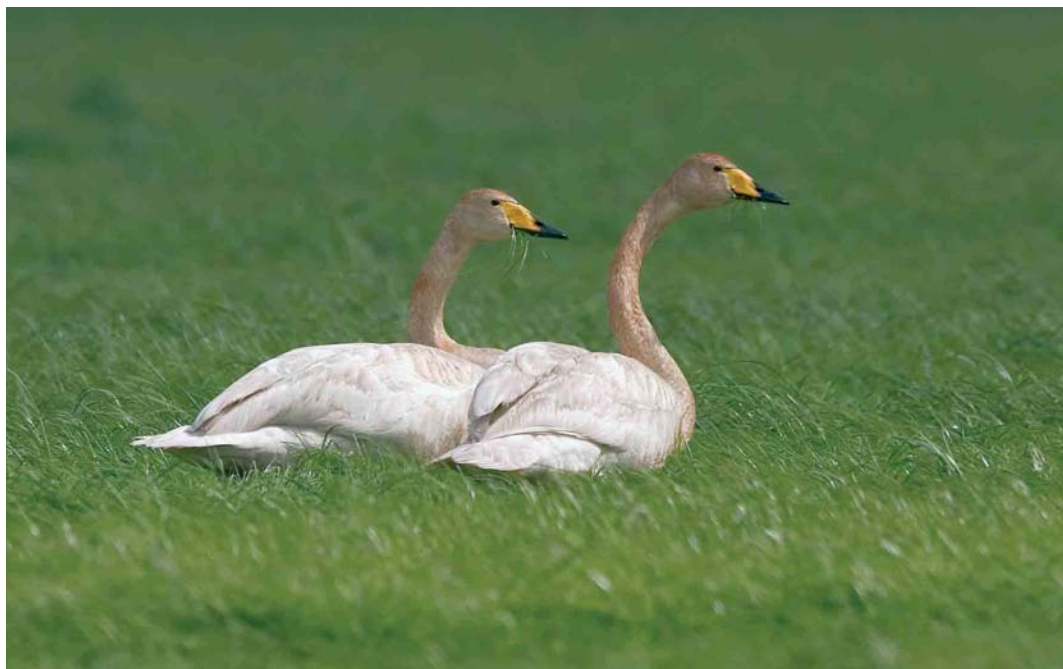
15 Wilde Zwanen / Whooper Swans Cygnus cygnus , adult vrouwtje (rechts) en adult mannetje, Wapserveense Petgaten, Drenthe, 13 juni 2005