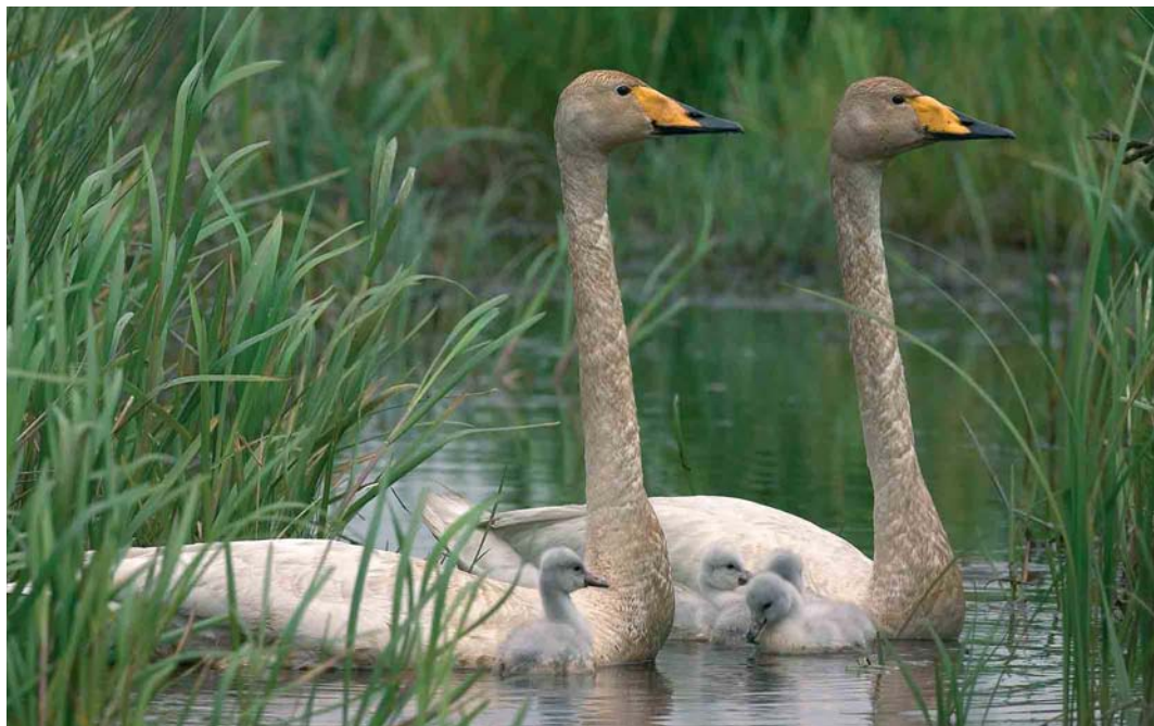
16 Wilde Zwanen / Whooper Swans Cygnus cygnus , Wapserveense Petgaten, adult vrouwtje (rechts), adult mannetje en vier jongen, Drenthe, 24 mei 2005 (Harvey van Diek)