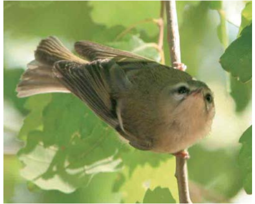
328 Firecrest / Vuurgoudhaan Regulus ignicapilla , juvenile, Santa Cilia de Jaca, Huelva, Spain, 4 August 2005. Note absence of median crown-stripe and small black secondary patch. Furthermore, the bird shows a pale supercilium and black lore and moustachial stripe.

Kinglet R. madeirensis . In the past, Canary Island and Azores were considered conspecific with Goldcrest and Madeira with Firecrest.