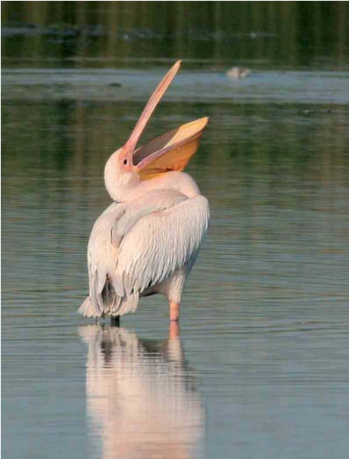
330 Great White Pelican / Roze Pelikaan Pelecanus onocrotalus , Sehlendorfer See, Schleswig-Holstein, Germany, 13 July 2006 (Stefan Pflützke)