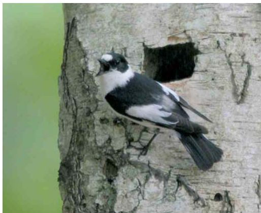
350 Audouin's Gull / Audouins Meeuw Larus audouinii , Helsingør, Sjælland, Denmark, 9 June 2006 351 Red-billed Tropicbird / Roodsnavelkeerringvogel Phaethon aethereus , south of Madeira, 29 June 2006 352 Subalpine Warbler / Baardgrasmus Sylvia cantillans , male, Helgoland, Schleswig-Holstein, Germany, 15 May 2006 353 Rock Bunting / Grijze Gors Emberiza cia , male, Helgoland, Schleswig-Holstein, Germany, 11 May 2006 354 Blyth's Reed Warbler / Struikrietzanger Acrocephalus dumetorum , male, Bialystok, Podfaskie, Poland, 3 June 2006 355 Collared Flycatcher / Withalsvliegenvanger Ficedula albicollis , adult male, Noord-Ginkel, Ede, Gelderland, Netherlands, 5 June 2006