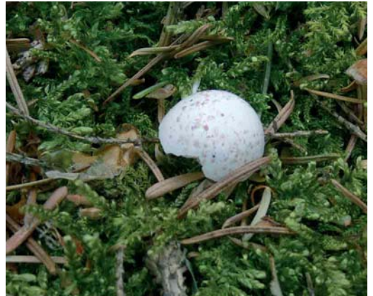
310 Kortsnavelboomkruiper / European Treecreeper Certhia familiaris macrodactyla , Lonnekerberg, Overijssel, 9 mei 2006 (Carl Derks) 311 Kortsnavelboomkruiper / European Treecreeper Certhia familiaris macrodactyla , Lonnekerberg, Overijssel, 21 mei 2006 (Carl Derks) 312 Kortsnavelboomkruiper / European Treecreeper Certhia familiaris macrodactyla , Lonnekerberg, Overijssel, 9 mei 2006 (Carl Derks) 313 Eierschaal van Kortsnavelboomkruiper / egg shell of European Treecreeper Certhia familiaris macrodactyla , Lonnekerberg, Overijssel, 15 mei 2006 (Carl Derks)

Duitse bosreservaat Samerrott nabij Schüttof, Niedersachsen, c 25 km ten oosten van Oldenzaal, Overijssel (Winkel et al 2006).