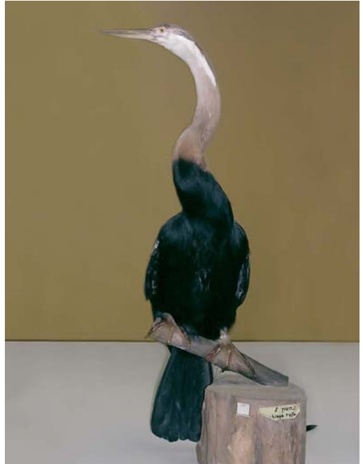
301-302 African Darter / Afrikaanse Slangenhalsvogel Anhinga melanogaster rufa , adult-winter male (collected at Hula valley, Israel, on 30 September 1950), National Museum of Natural History of Tel Aviv University, Tel Aviv, Israel, June 2006

rivers Euphrates and Tigris), in southern Iraq and neighbouring Iran. These birds are supposedly still mostly resident in Iraq. Scott & Evans (1994) summarized the historical records in Iraq. It was supposedly quite common in the early 20th century with many found nesting in various parts of the marshes. However, by the 1940s, it was already considered a scarcer and more localized species by some sources (Scott & Evans 1994).