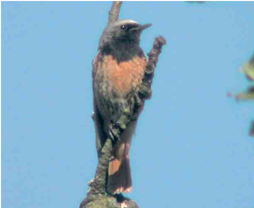
389 Hybride Gekraagde x Zwarte Roodstaart / hybrid Common x Black Redstart Phoenicurus phoenicurus ochrus , Grembergen, Oost-Vlaanderen, 13 juni 2006 (Albert Mannaert)