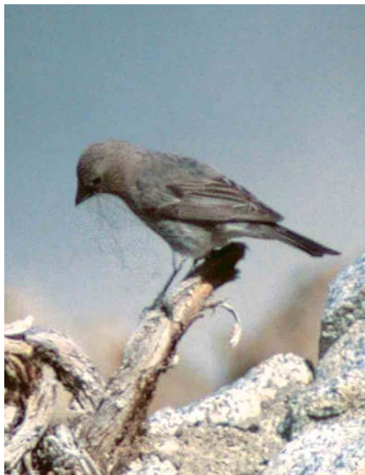
300 Spotted Great Rosefinch / Severtzovs Grote Roodmus Carpodacus severtzovi , female-type, Jelondy, western Pamir, Tajikistan, July 2005 (Raffael Ayé). Female-type Spotted Great Rosefinch shows faint, beige supercilium behind eye, primary projection almost equalling visible length of tertials, and obvious pale wing-panel on bases of secondaries.

Females Himalayan Beautiful Rosefinch C pulcherri-mus could potentially also be confused with female grandis but the former is much smaller (even smaller than Himalayan White-browed Rosefinch) and relatively longer tailed, smaller billed and more prominently streaked overall, especially on the upperparts (Rasmussen & Anderton 2005).