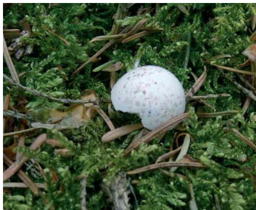
310 Kortsnavelboomkruiper / European Treecreeper Certhia familiaris macrodactyla , Lonnekerberg, Overijssel, 9 mei 2006 (Carl Derks) 311 Kortsnavelboomkruiper / European Treecreeper Certhia familiaris macrodactyla , Lonnekerberg, Overijssel, 21 mei 2006 (Carl Derks) 312 Kortsnavelboomkruiper / European Treecreeper Certhia familiaris macrodactyla , Lonnekerberg, Overijssel, 9 mei 2006 (Carl Derks) 313 Eierschaal van Kortsnavelboomkruiper / egg shell of European Treecreeper Certhia familiaris macrodactyla , Lonnekerberg, Overijssel, 15 mei 2006 (Carl Derks)

Duitse bosreservaat Samerrott nabij Schüttof, Niedersachsen, c 25 km ten oosten van Oldenzaal, Overijssel (Winkel et al 2006).