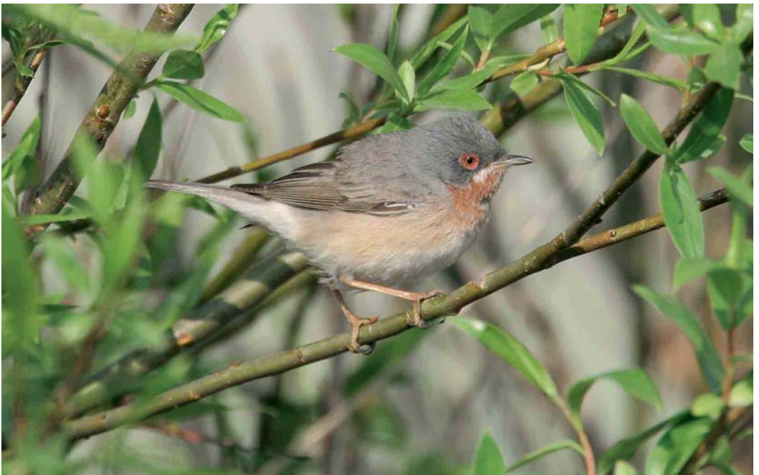
386 Baardgrasmus / Subalpine Warbler Sylvia cantillans , mannetje, Maasvlakte, Zuid-Holland, 11 mei 2006 (Chris van Rijswijk)