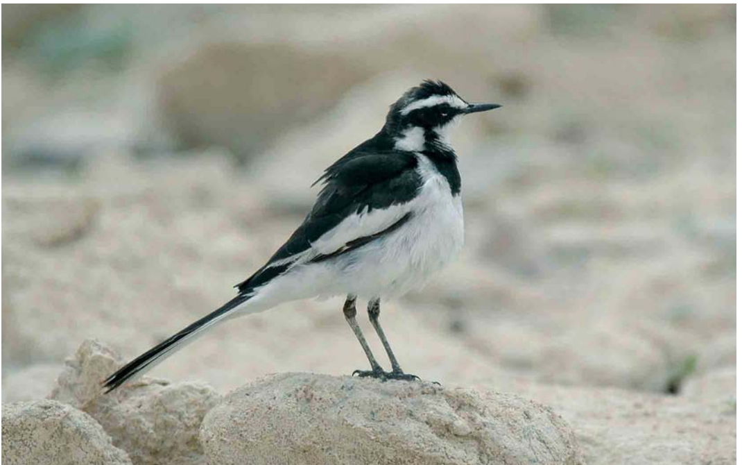
346 African Pied Wagtail / Afrikaanse Bonte Kwikstaart Motacilla aguimp , Abu Simbel, Egypt, 2 May 2006