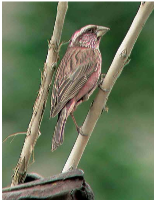
291 Blyth's Rosefinch / Blyths Roodmus Carpodacus grandis , adult male, Ladakh, India, July 2004 ( Daniel Matti ). Typical bird showing strong and sharply demarcated supercilium, strong white marking on cheek and rather long primary projection.

Numerous slight differences in basic colour have been described between the two taxa. In absence of a colour standard, however, these specifications do often not become very clear and even seem contradictory. We think that calling rhodochlamys 'brighter' is misleading, because grandis can be quite pale and intensively coloured in pinkish and even visibly orange colour tones. In the numerous skins, we found extraordinary variation in underpart coloration of both taxa and, also in the field, we could not detect any consistent differences. As far as the upperparts are concerned, we prefer to call male rhodochlamys 'richer'