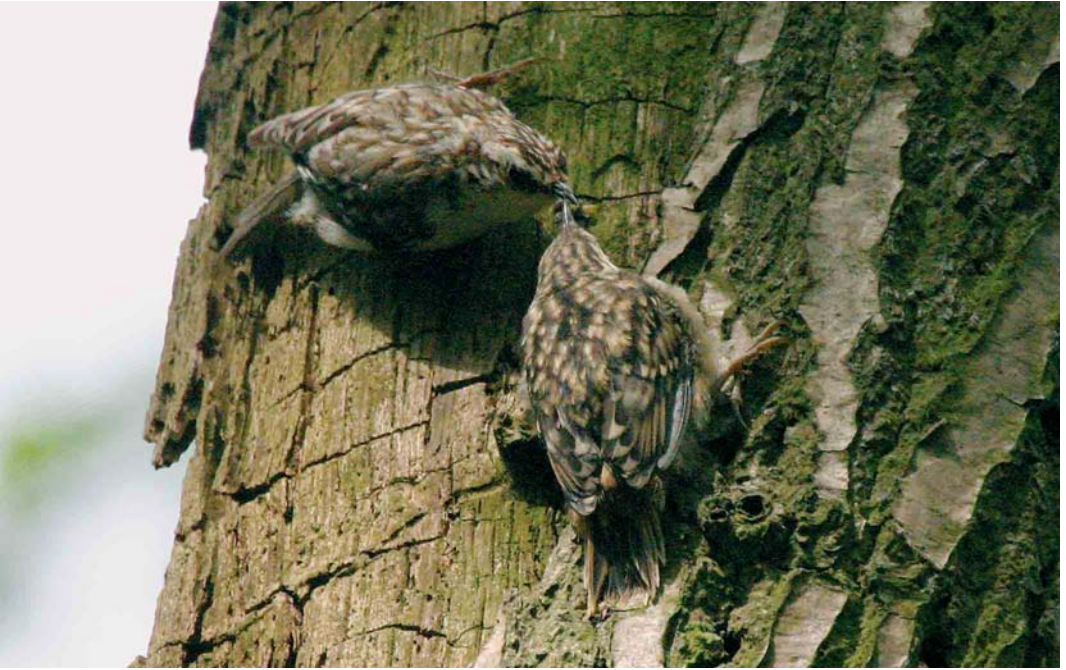
309 Taigaboomkruiper / Eurasian Treecreeper Certhia familiaris met hybride jong Taigaboomkruiper x Boomkruiper / Eurasian x Short-toed Treecreeper C familiaris x brachydactyla , Olst, Overijssel, 25 mei 2005 (Edwin Winkel)

C f familiaris (hierna nominaat familiaris ). Bovendien passen met name de erg witte onderdelen minder goed op Kortsnavelboomkruiper C f macrodactyla (hierna macrodactyla ). De gedachten gingen daarom voorzichtig richting een overzomerende nominaat familiaris die wellicht ging broeden en WT en EW belden nogmaals MZ. Deze arriveerde 's middags en concludeerde, nadat hij de zang en typische srie -roepjes had gehoord, dat het met zekerheid om een Taigaboomkruiper ( macrodactyla of nominaat familiaris ) ging. Ook Rolf de By en Carl Derks bevestigden tijdens een bezoek met MZ op zaterdag 7 mei deze bevinding.