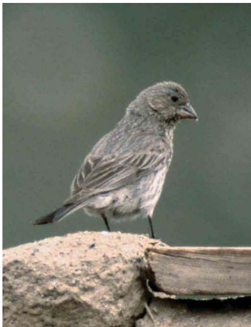
299 Spotted Great Rosefinch / Severtzovs Grote Roodmus Carpodacus severtzovi , female-type, Bash Gumbez, eastern Pamir, Tajikistan, July 2004 (Raffael Ayé). Female-type Spotted Great Rosefinch has long primary projection and only faint streaking on mantle and flank. Also note strong pale wing-panel on bases of secondaries.