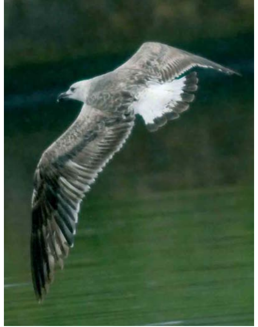
364-365 Baltische Mantelmeeuw / Baltic Gull Larus fuscus fuscus , eerste-zomer, Erasmusgracht, Amsterdam, Noord-Holland, 25 mei 2006 (Arnoud B van den Berg) 366 Slangenarend / Short-toed Eagle Circaetus gallicus (opgeraapt bij Maarheeze, Noord-Brabant, op 26 mei 2006), Someren, Noord-Brabant, 30 mei 2006 (René Weenink) 367 Noordse Nachtegaal / Thrush Nightingale Luscinia luscinia , Thorn, Limburg, 15 mei 2006 (Otto Plantema)