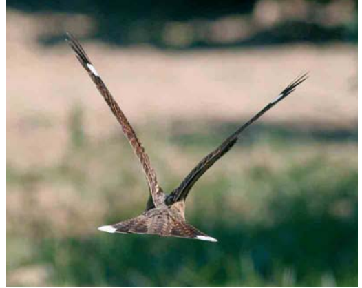
Mystery photograph VIII (June)

islands, is undoubtedly best explained by the age of the bird.