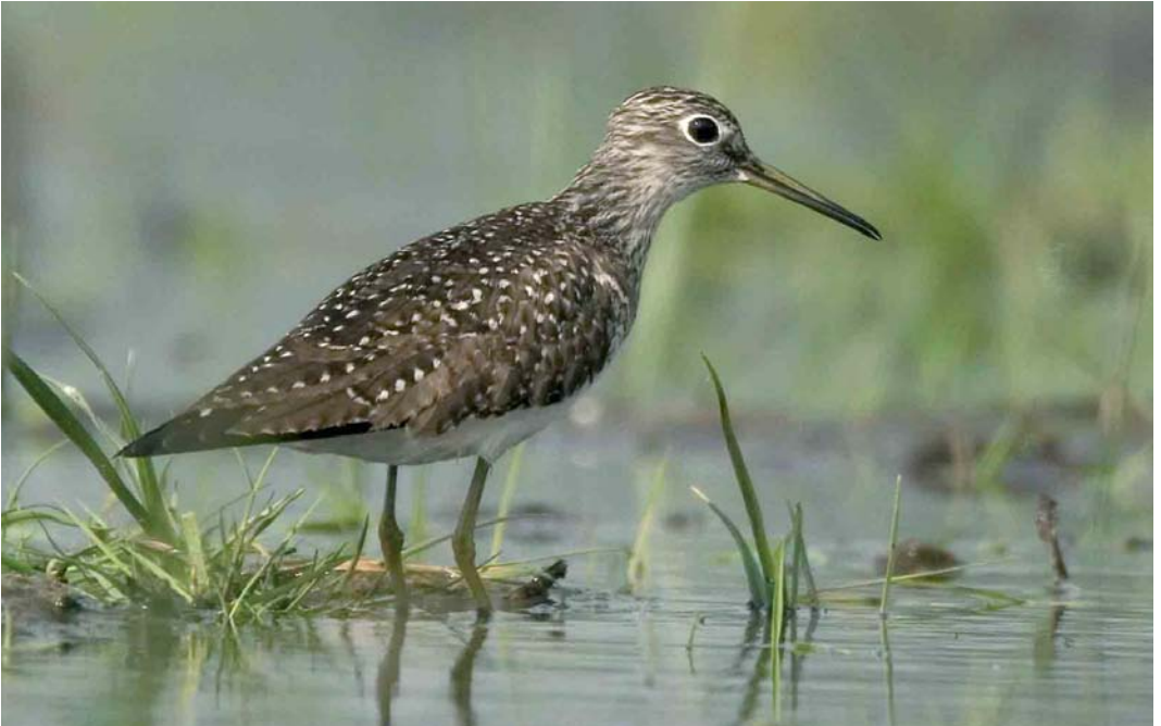
359 Amerikaanse Bosruiter / Solitary Sandpiper Tringa solitaria , Bokkegat, Wissenkerke, Zeeland, 17 mei 2006 (Harvey van Diek)