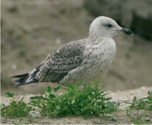
Mystery photograph VII (July)