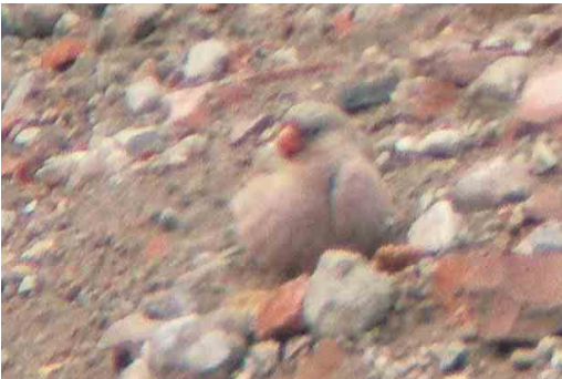
323-324 Woestijnvink / Trumpeter Finch Bucanetes githagineus , Eemshaven, Groningen, 12 juni 2005

De determinatie van de vogel was vrij eenvoudig door de combinatie van klein formaat, plompe bouw, rozeachtig verenkleed en grote rode snavel (cf Clement et al 1993, Cramp & Simmons 1994, Snow & Perrins 1998, Svensson et al 2002). Woestijnvink kan worden verward met Vale Woestijnvink Rhodospiza obsoleta . Deze is echter zandkleurig en heeft een zwarte snavel. Deze soort is grotendeels standvogel en een onwaarschijnlijke dwaalgast in Europa (de westrand van het verspreidingsgebied ligt in Oost-Turkije); er zijn echter wel verschillende waarnemingen van escapes in Nederland bekend (Ebels 1996, 2004). Verder lijkt Woestijnvink wel wat op Rode Woestijnvink Rhodopechys sanguineus . Deze soort komt voor in de berggebieden van Azië (Aziatische Rode Woestijnvink R s sanguineus ) en in de Hoge Atlas in Noordwest-Afrika (Afrikaanse Rode Woestijnvink R s alienus ). In tegenstelling tot Woestijnvink heeft Rode Woestijnvink een zwarte kruin en bruine flanken. Het is een bergvogel en grotendeels standvogel, die 's winters soms naar lager gelegen gebieden migreert. Voorkomen als wilde vogel in Europa is onwaarschijnlijk; er zijn ook (nog) geen meldingen van deze soort als escape bekend. De enige andere Bucanetes -soort is Mongoolse Woes-