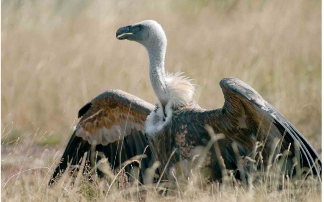
332 Eurasian Griffon Vulture / Vale Gier Gyps fulvus , Baumholder, Rheinland-Pfalz, Germany, 14 July 2006 (Christian Gelpke)