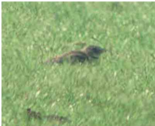
314 Kalanderleeuwerik / Calandra Lark Melanocorypha calandra , Eemshaven, Groningen, 27 mei 2005 (Martijn Bot)

in vlucht éénmaal korter rateltje gehoord, minder hard en bijna 'binnensmonds'.