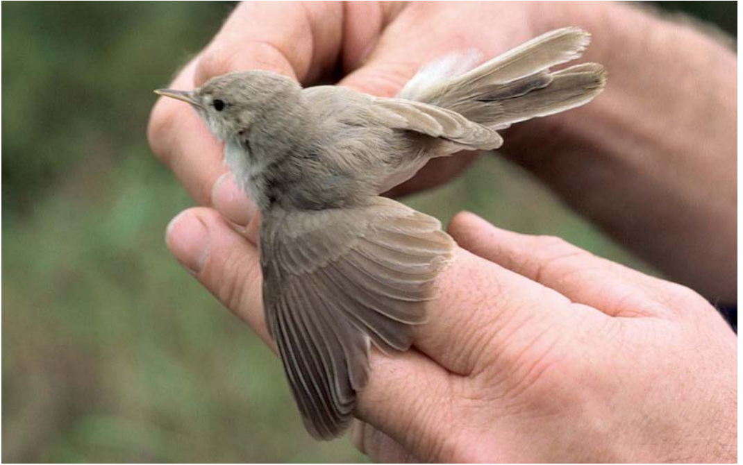
304-305 Sykes' Spotvogel / Sykes's Warbler Acrocephalus rama , Almere-Haven, Flevoland, 11 oktober 1986 (Karel A Mauer)