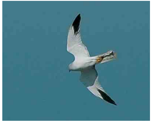
372 Vale Gier / Eurasian Griffon Vulture Gyps fulvus , Koudekerke, Zeeland, 5 juni 2006 373 Vale Gier / Eurasian Griffon Vulture Gyps fulvus , Daalackers, Westerhoven, Noord-Brabant, 19 juni 2006 374 Lammergeier / Lammergeier Gypaetus barbatus , onvolwassen, Kale Duinen, Appelscha, Friesland, 17 mei 2006 375 Steppekiekendief / Pallid Harrier Circus macrourus , mannetje, Eemshaven, Groningen, 5 mei 2006

ge kennis van zaken is vooralsnog niet hard te maken dat het inderdaad deze soort betrof. Er werden c acht Grote Burgemeesters L hyperboreus gemeld, waaronder de trouwe vogel van Katwijk aan Zee, Zuid-Holland, die tot in juli bleef. Kleine Burgemeesters L glaucoides werden gezien op 1 mei bij Bergen op Zoom, Noord-Brabant; op 3 en 6 mei bij Egmond aan Zee, Noord-Holland; op 9 mei langs de Eemshaven; op 4 juni bij de Westerslag op Texel; en op 8 juni bij Katwijk aan Zee. Verspreid over de maand mei werden 11 Lachsterns Gelochelidon nilotica gezien en in juni nog drie, waaronder een exemplaar op 13 en 14 juni in de Balgzandpolder. Er waren veel Witwangsterns Chlidonias hybrida met in mei 53, waaronder van 6 tot 14 mei maximaal zeven op de vloeivelden van de suikerfabriek bij Hoogkerk, Groningen, tussen 6 en 14 mei 19 langs de Eemshaven, met alleen al op 14 mei negen, op 10 mei vijf bij Nieuwolda, Groningen, en