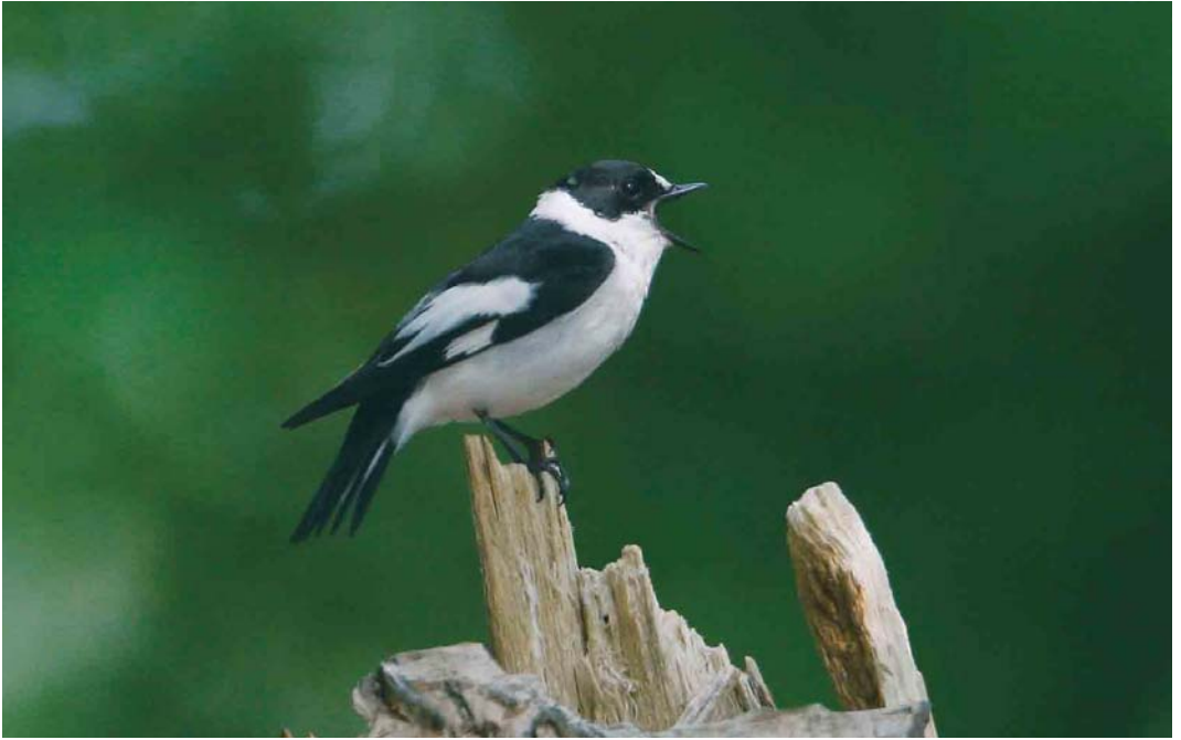
385 Withalsvliegenvanger / Collared Flycatcher Ficedula albicollis , adult mannetje, Noord-Ginkel, Ede, Gelderland, 5 juni 2006