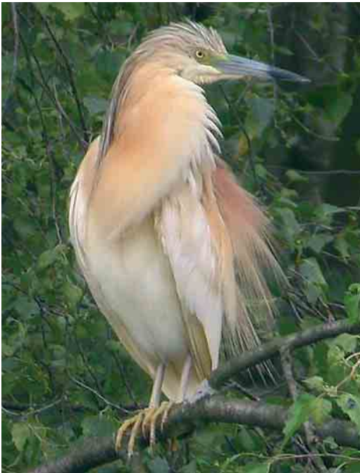
387 Ralreiger / Squacco Heron Ardeola ralloides , Wachtebeke, Oost-Vlaanderen, 27 juni 2006

9 juni in de Achterhaven van Zeebrugge en op 18 juni in Wortel, Antwerpen. Twee schijnbaar ongepaarde mannetjes Woudaap Ixobrychus minutus lieten zich vanaf 4 juni zeer goed bekijken in de Abdij van 't Park in Heverlee. Op 4 mei waren twee Kwakken Nycticorax nycticorax aanwezig bij Watervliet, Oost-Vlaanderen, en van 14 tot 25 mei nog een exemplaar. Op 6 mei was er één in Tervate, West-Vlaanderen; op 5 juni in Lille, Antwerpen; op 11 juni in Hensies; en op 27 juni in De Maten in Genk, Limburg. Een Ralreiger Ardeola ralloides die op 21 mei opdook in Het Vinne in Zoutleeuw, Vlaams-Brabant, bleef daar de hele periode maar bleek doorgaans bijzonder moeilijk te vinden. Op 24 mei foerageerde er één in de Wijvenheide in Zonhoven, Limburg, en op 27 en 28 juni verbleef er één in het Provinciaal Domein Puyenbroeck bij Wachtebeke, Oost-Vlaanderen. De Koereiger Bubulcus ibis die van 2 tot 21 mei in de Kalkense Meersen bij Laarne, Oost-Vlaanderen, verbleef, overnachtte dagelijks in het Molsbroek in Lokeren, Oost-Vlaanderen. Op 3 juni verscheen er kortstondig één in het Mechels Broek bij Mechelen, Antwerpen, en op 9 juni was er één aanwezig bij de Moervaart in Mendonk, Oost-Vlaanderen. Kleine Zilverreigers Egretta garzetta lieten het nagenoeg afweten met maxima van 33 in Het Zwin in Knokke, West-Vlaanderen, op 30 mei; vier in Zeebrugge op 11 en 31 mei; en vier in de Uitkerkse Polders, West-Vlaanderen, op 16 mei. Daarom is de waarneming inte-