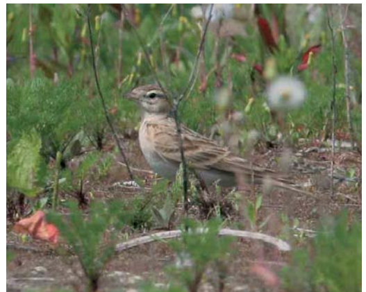
381 Rode Rotslijster / Rufous-tailed Rock Thrush Monticola saxatilis , vrouwtje, Flevocentrale, Lelystad, Flevoland, 8 mei 2006 ( Martijn Renders ) 382 Roodkopklauwier / Woodchat Shrike Lanius senator , Diemen, Noord-Holland, 13 juni 2006 ( Jan den Hertog ) 383 Citroenkwikstaart / Citrine Wagtail Motacilla citreola , vrouwtje, Mariëndal, Den Helder, 5 mei 2006 ( Harm Niesen ) 384 Kortteenleeuwerik / Greater Short-toed Lark Calandrella brachydactyla , Ramspolplaten, Ketelmeer, Overijssel, 12 mei 2006 ( Mark Zekhuis )

Bijeneters Merops apiaster gesignaleerd, waaronder acht op 12 juni bij Heumensoord, Gelderland. Daarna volgden er nog vijf op 24 juni bij de Putten van Camperduin. Hoppen Upupa epops fleurden de omgeving op bij de Haringvlietdam, Zuid-Holland, op 2 mei; bij Geldermalsen, Gelderland, op 8 mei; bij De Pan, Zuid-Holland, op 14 mei; bij Nieuw-Leusen, Overijssel, op 16 mei; en in Groningen op 28 mei. Langsvliegende Kortteenleeuweriken Calandrella brachydactyla werden gedetermineerd op 6 en 12 mei bij de Eemshaven en op 8 mei bij Breskens. Op 7 mei foerageerde een exemplaar bij De Cocksdorp op Texel en op 12 mei werd een exemplaar gefotografeerd op het eilandje Ramspolplaten in het Ketelmeer bij Kampen, Overijssel. Een Rotswaluw Ptyonoprogne rupestris werd gemeld op 3 mei langs de Eemshaven. Tussen 3 en 13 mei stoven 17 Roodstuitzwaluwen Cecropis daurica langs diverse telposten. Grote Piepers Anthus