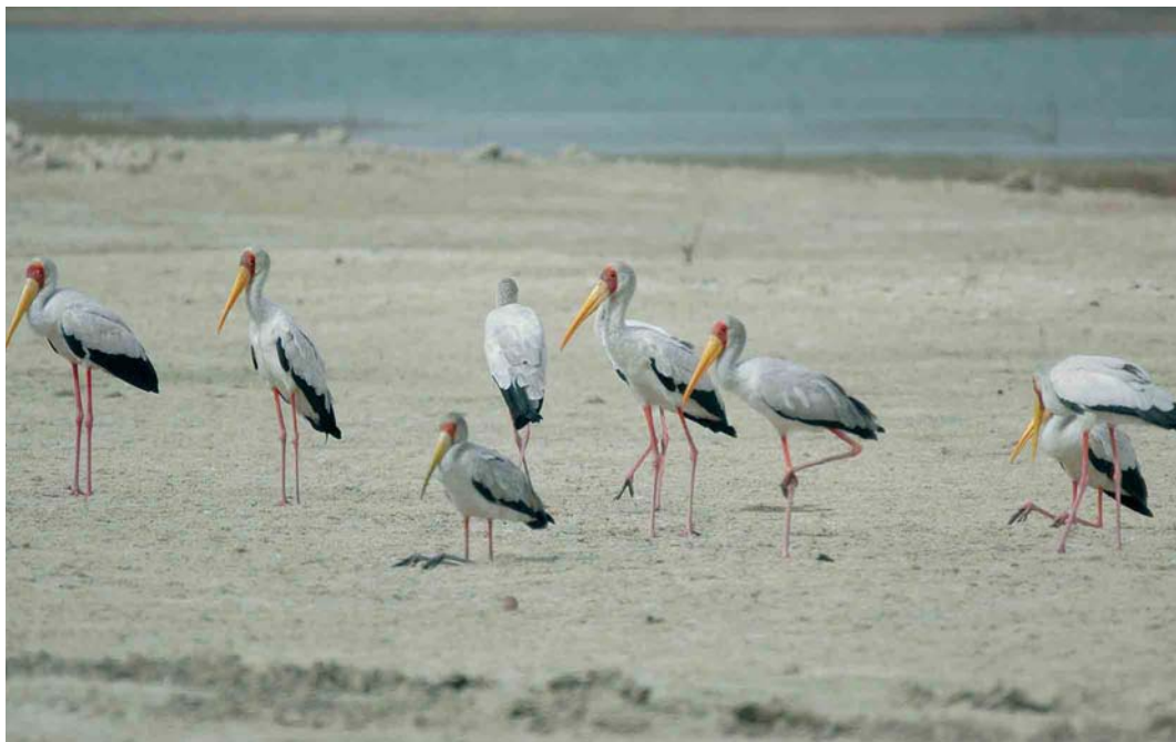
347 Yellow-billed Stork / Afrikaanse Nimmerzat Mycteria ibis , Abu Simbel, Egypt, 2 May 2006 (Eric Didner)