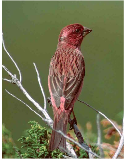
292-293 Red-mantled Rosefinch / Roze Roodmus Carpodacus rhodochlamys , adult male, Greater Almaty Lake, Trans-Ili Alatau, Kazakhstan, June 2005. Depending on light conditions, male rhodochlamys can show rather strong supercilium. However, it is poorly set off against glossy-vinaceous crown and joins area of silvery-white feather tips on forecrown. Note relatively short primary projection. Comparison of both plates demonstrates strong light dependence of visibility of supercilium. Seen in profile, this bird also illustrates convex shape of culmen (plate 293).

vinaceous, rather than brighter. More specifically, it has a rich vinaceous-pink hue (colour 212C in Smithe 1975) to the army-brown mantle (colour 219B in Smithe 1975), whereas in grandis , this hue is rather cinnamon-drab (colour 219C in Smithe 1975). Thus, the mantle seems more brownish (slightly rufous-brown) in the latter taxon, and, in some individuals, the lower nape and upper mantle show obvious orange feather edges, which we never observed in rhodochlamys . In fresh plumage (moult is in August-September on the skins in Almaty and Tring), greyish fringes to these feathers make the birds seem much drabber and colder in coloration. Therefore, only birds in a similar stage of plumage wear should be compared. On skins, the dark shaft-streaks on mantle and crown are clearly more blackish, on average narrower, and a bit more sharply set off the peripheral part of the feathers in rhodochlamys compared with grandis , where the streaking is more brownish and diffuse. However, we have been unable to recognize these differences under field conditions. The rump and lower back are unmarked vinaceous in rhodochlamys . In grandis , these areas are very variable – either paler with a slight tinge of orange, or visibly brownish (again a slightly rufous tone of brown) and then rather darker than in rhodochlamys .