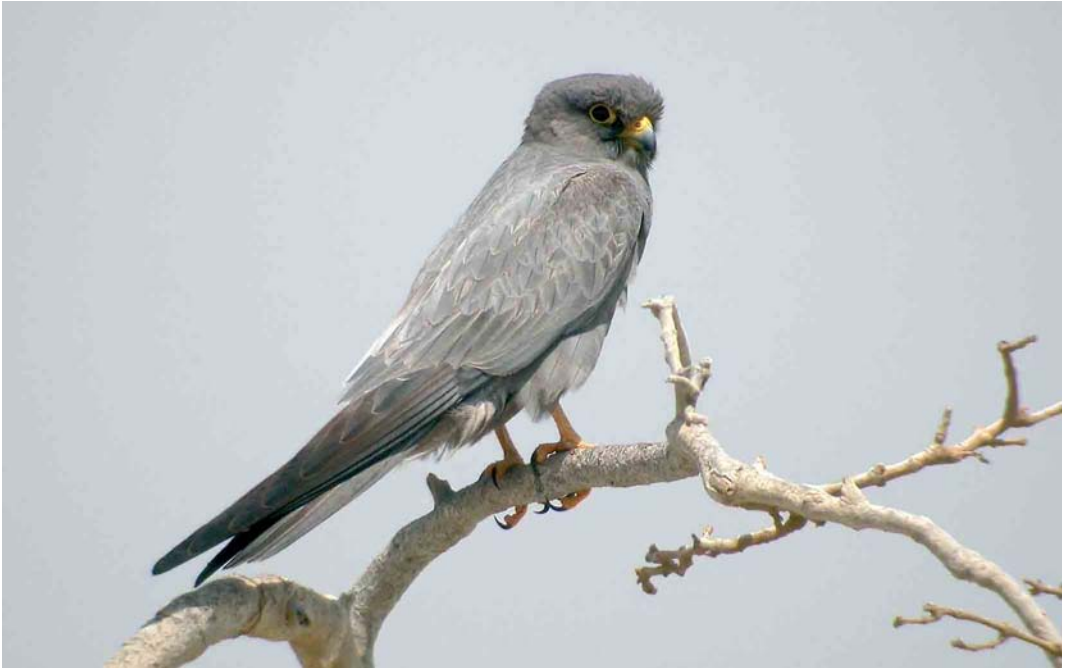
345 Sooty Falcon / Woestijnvalk Falco concolor , Hamata, Egypt, 22 May 2006 (Kris De Rouck)