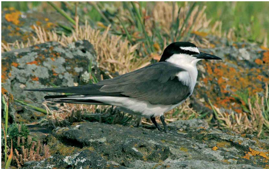
334 Bridled Tern / Brilstern Onychoprion anaethetus , adult, Praia, Graciosa, Azores, June 2006 (Mark Bolton)