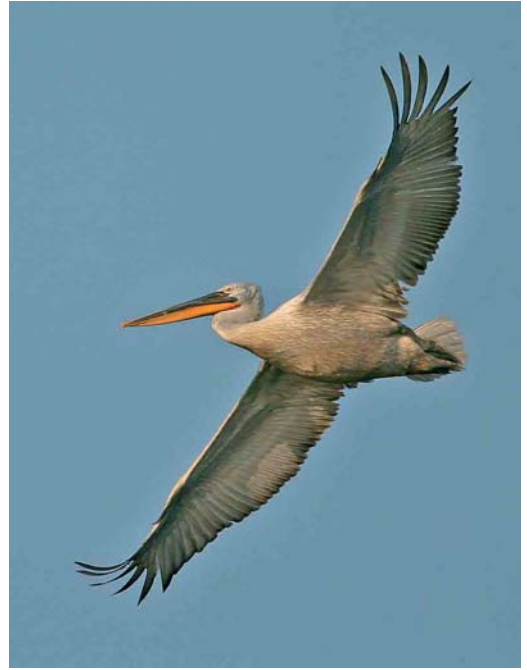
331 Dalmatian Pelican / Kroeskoppelikaan Pelecanus crispus , adult, Przemkow, Silesia, Poland, 4 July 2006

were seen at a breeding site on Lampedusa in May. A Madeiran Little Shearwater P baroli was reported off Tønsberg, Norway, on 21 June. On a pelagic tour between Madeira and the Selvagens on 26-29 June, more than 100 White-faced Storm-petrels Pelagodroma marina were seen, most of them near the Selvagens but also one 41 nautical miles south of Funchal, Madeira, on 29 June. On the same tour, more than 10 (presumed) Fea's Petrels P feae (with many more near Deserta Grande, Madeira, on 29-30 June), a few Manx Shearwaters P puffinus , a few Madeiran Little Shearwaters , two Wilson's Storm-petrels Oceanites oceanicus , c 12 Madeiran Storm-petrels Oceanodroma castro and, on 29 June, an adult Red-billed Tropicbird Phaethon aethereus and a first-summer Sabine's Gull Larus sabini were noted. An unusual influx of European Storm-petrels Hydrobates pelagicus occurred in the English Channel from 19 May onwards; for instance, c 1000 were seen off Portland Bill, Dorset, England, both on 19 and 20 May, 232 in 2.5 h past Ouessant, Finistère, France, on 21 May, and 369 past Hope's Nose, Devon, England, on 26 May.