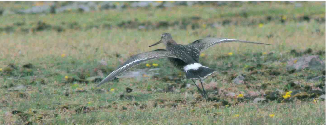
336 Crab-plovers / Krabplevieren Dromas ardeola , Hamata, Egypt, 28 April 2006 ( Eric Didner ) 337 Semipalmated Plover / Amerikaanse Bontbekplevier Charadrius semipalmatus , Cabo da Praia, Terceira, Azores, 11 June 2006 ( Mark Bolton ) 338 Greater Painted-snipe / Goudsnip Rostratula benghalensis , Abu Simbel, Egypt, 3 May 2006 ( Eric Didner ) 339 Broad-billed Sandpiper / Breedbekstrandloper Limicola falcinellus , Ghadira, Malta, 11 May 2006 ( Raymond Galea ) 340 Hudsonian Godwit / Rode Grutto Limosa haemastica , adult, Ottenby, Öland, Sweden, 27 June 2006 ( Christian Cederroth )