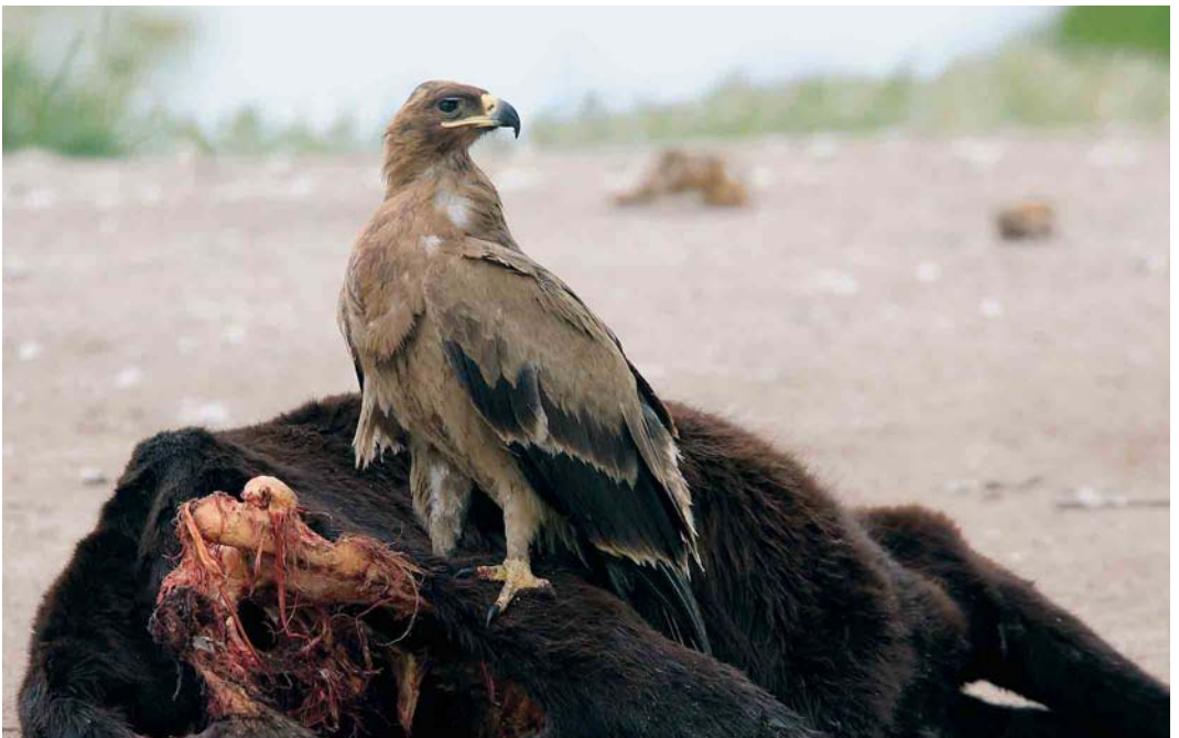
333 Steppe Eagle / Steppearend Aquila nipalensis , Evros delta, Greece, 4 May 2006 (Steven Ruiter)