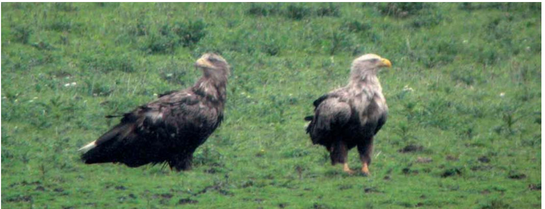
376 Rode Wouw / Red Kite Milvus milvus , Den Nul, Overijssel, 28 april 2006 377 Roodpootvalk / Red-footed Falcon Falco vespertinus , vrouwtje, Fochteloërveen, Friesland, 15 mei 2006 378 Amerikaanse Goudplevier / American Golden Plover Pluvialis dominica , Den Helder, Noord-Holland, 13 mei 2006 379 Ralreiger / Squacco Heron Ardeola ralloides , Lentevreugd, Wassenaar, Zuid-Holland, 18 juni 2006 380 Zeearenden / White-tailed Eagles Haliaeetus albicilla , adult mannetje en subadult vrouwtje, Oostvaardersplassen, Flevoland, 27 mei 2006