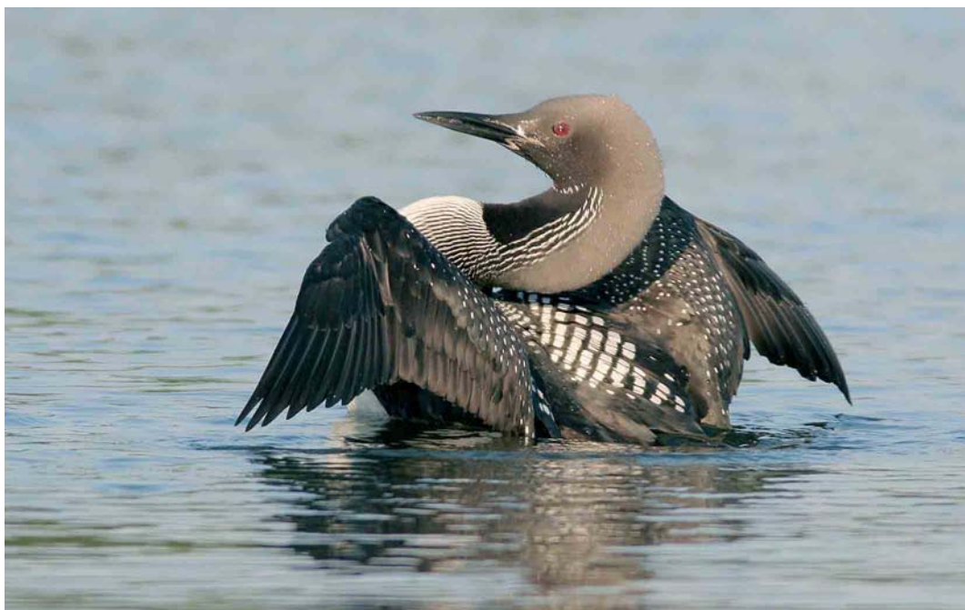
335 Black-throated Loon / Parelduiker Gavia arctica , adult summer, Bremen, Bremen, Germany, July 2006 (Stefan Pfützke)