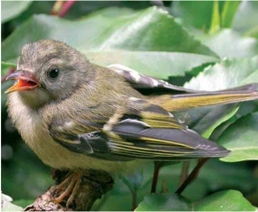
327 Goldcrest / Goudhaan Regulus regulus , juvenile, Mariakerke, Oost-Vlaanderen, Belgium, 18 June 2005. Note pale ring surrounding eye and absence of black lore. In addition, black secondary patch is fairly large, although partly obscured by one misplaced secondary.