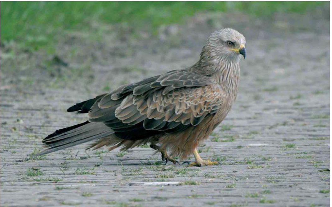
360 Zwarte Wouw / Black Kite Milvus migrans , Zuiderkwelweg, Wieringermeer, Noord-Holland, 28 mei 2006 (Wiepko Lubbers)