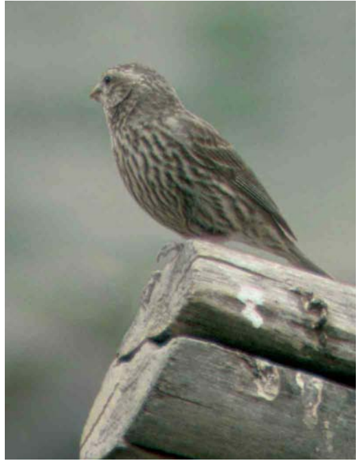
297 Blyth's Rosefinch / Blyths Roodmus Carpodacus grandis , female-type, Ladakh, India, July 2004. Like in adult males, supercilium of female-type grandis is rather long. Note distinct dark streaking on underparts.

Females of the western subspecies of Himalayan White-browed Rosefinch C thura blythi are superficially similar to female grandis but are smaller, with a much narrower bill. The supercilium is more contrastingly toned buffish, the lower throat and the breast have a buffish wash and the blackish-streaked rump is yellowish-olive.