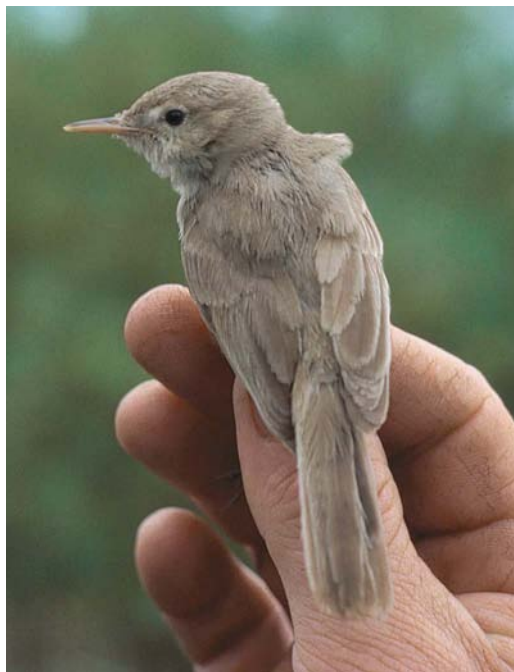
306 Sykes' Spotvogel / Sykes's Warbler Acrocephalus rama , Almere-Haven, Flevoland, 11 oktober 1986

GROOTTE & BOUW Kleine Acrocephalus -achtige vogel met ronde kop als van Hippolais -spotvogel. Vleugel kort, vleugelpunt iets voorbij bovenstaartdekveren stekend. Staart vrij lang lijkend. Staarteinde hoekig, niet afgerond. Snavelbasis breed. Aan beide zijden van snavel drie snorharen. Poot relatief stevig. KOP Voorhoofd, kruin en nek grijsbruin. Oorstreek licht grijsbruin, naar voren toe lichter wordend en voor oog samenvloei-