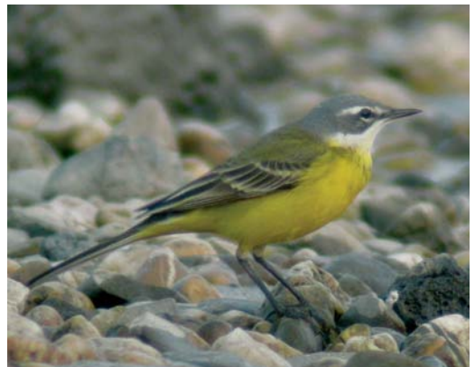
315 Blue-headed Wagtail / Gele Kwikstaart Motacilla flava , male, Lobith, Gelderland, Netherlands, 24 April 2004 ( Rik Winters ). Typical flava . 316 Blue-headed Wagtail / Gele Kwikstaart Motacilla flava , male, Lobith, Gelderland, Netherlands, 30 April 2004 ( Rik Winters ). Rather typical flava but note white on throat somewhat more extensive than in bird in plate 315. 317 Blue-headed Wagtail / Gele Kwikstaart Motacilla flava , male, probably first-summer Lobith, Gelderland, Netherlands, 24 April 2004 ( Rik Winters ). Note rather extensive white on throat. 318 Yellow wagtail / gele kwikstaart Motacilla , male, probably first-summer, Lobith, Gelderland, Netherlands, 16 April 2004 ( Rik Winters ). Throat almost completely white, except for faint yellow malar stripe. Supercilium rather broad but rather diffuse at both ends.

ring and the call, however, combined to fit a hybrid iberiae x cinereocapilla better than any other option (Philippe Dubois in litt). Other birds were more similar to the former type (thus more similar to flava ). One showed a faint yellow malar stripe (plate 318). Another rather dark-headed bird showed extensive white on the throat, and could just as well be considered a flava that is too dark-headed or an iberiae showing an aberrant amount of yellow on the throat (plate 319), but was more likely of hybrid origin. To complicate matters even further, one bird was apparently indistinguishable from true iberiae on plumage features alone (plate 322) but was not heard to call and should therefore remain unidentified, as hybrids cannot be fully excluded.