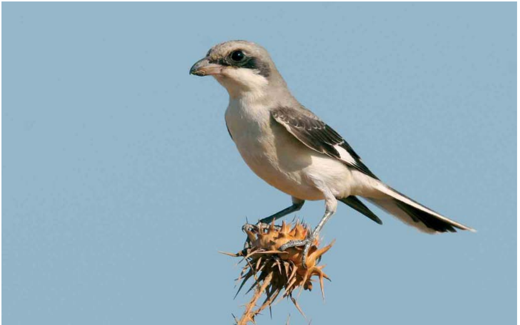
326 Lesser Grey Shrike / Kleine Klapekster Lanius minor , juvenile, Skala Koloni, Lesvos, Greece, August 2005 (Chris van Rijswijk)

VI Nearly all entrants recognized the passerine in the mystery photograph as a member of the genus Regulus . Six species have been recorded in the Western Palearctic: Ruby-crowned Kinglet R. calendula , Goldcrest R. regulus , Azores Kinglet R. azoricus , Canary Island Kinglet R. teneriffae , Firecrest R. ignicapilla and Madeira