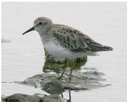
37 American Coot / Amerikaanse Meerkoet Fulica americana , Lagoa de Capitão, Pico, Azores, 19 December 2005 (Eric Didner) 38 Belted Kingfisher / Bandijsvogel Ceryle alcyon Santa Cruz, Graciosa, Azores, 21 December 2005 (Eric Didner) 39 Semipalmated Plover / Amerikaanse Bontbekplevier Charadrius semipalmatus , Ponta Delgada, Flores, Azores, 24 November 2005 (Stefan Pfützke) 40 American Bittern / Noord-Amerikaanse Roerdomp Botaurus lentiginosus , Lagoa Azul, São Miguel, Azores, 27 October 2005 (Frédéric Jiguet) 41 Pied-billed Grebe / Dikbekfuut Podilymbus podiceps , Lajes, Pico, Azores, 19 December 2005 (Eric Didner) 42 Least Sandpiper / Kleinste Strandloper Calidris minutilla , Cabo da Praia, Terceira, Azores, 24 November 2005 (Stefan Pfützke) for some, cf Dutch Birding 27: 424-425, 2005