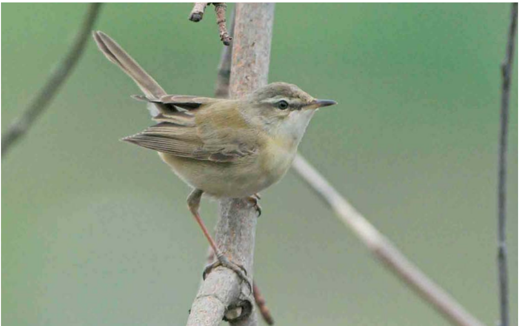
357 Paddyfield Warbler / Veldrietzanger Acrocephalus agricola , Helgoland, Schleswig-Holstein, Germany, 18 May 2006 ( Felix Jachmann )