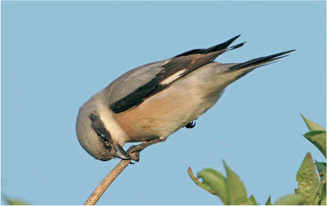
356 Lesser Grey Shrike / Kleine Klapekster Lanius minor , Shingle Street, Suffolk, England, 8 July 2006