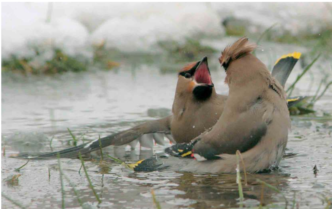
264 Pestvogels / Bohemian Waxwings Bombycilla garrulus , Almere, Flevoland, 3 maart 2006