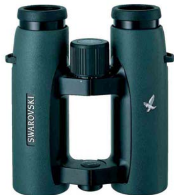
Swarovski 10x32 EL binoculars

Photographs I and II represent the first round of the 2006 competition. Please, study the rules