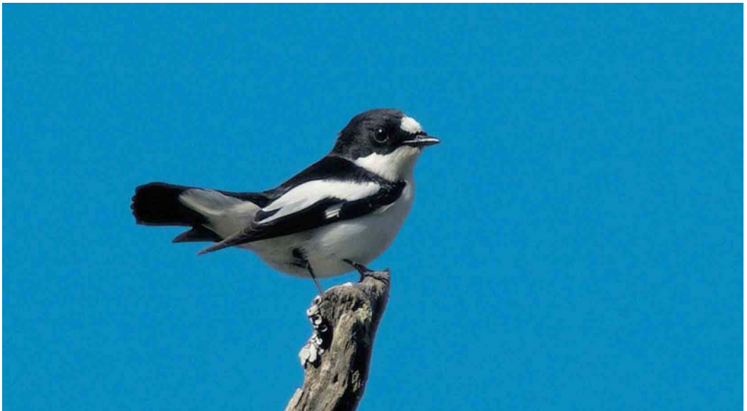
2 Atlas Flycatcher / Atlasvliegenvanger Ficedula speculigera , male, Beni M'tir, Jendouba, Tunisia, 3 May 2005

tant than Collared and European Pied (Sætre 2001ab), with which it was considered conspecific until at least 1977 (Voous 1977).