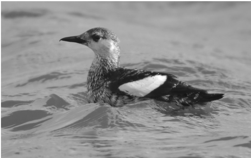
259 Zwarte Zeekoet / Black Guillemot Cepphus grylle , adult, NIOZ-haven, Texel, Noord-Holland, 6 maart 2006