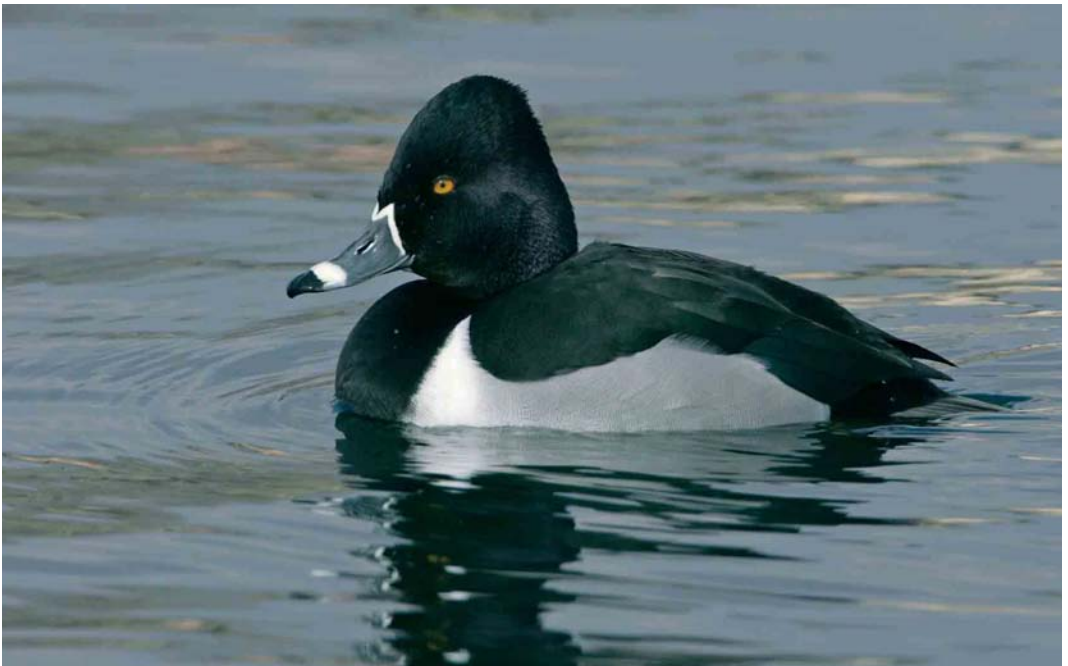
233 Ring-necked Duck / Ringsnaveleend Aythya collaris , adult male, Zürich, Switzerland, 13 March 2006