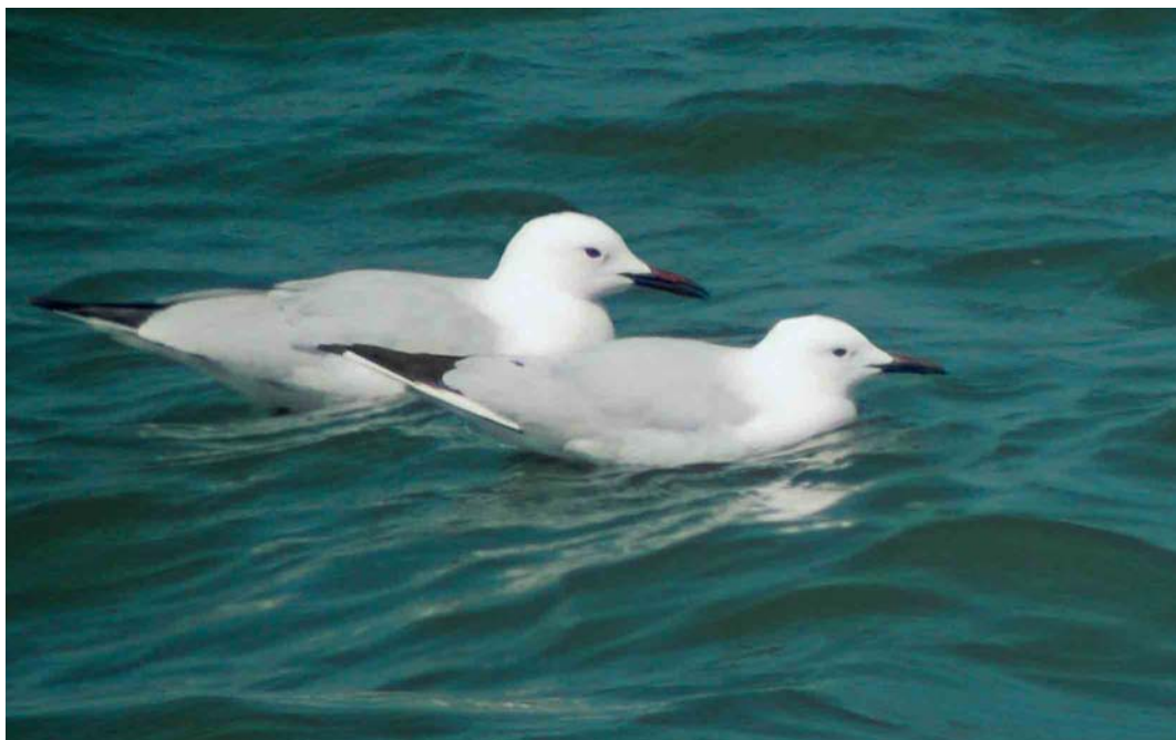
279 Dunbekmeeuwen / Slender-billed Gulls Larus genei , Enkhuizen, Noord-Holland, 6 mei 2006