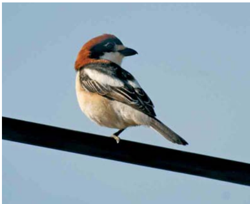
257 Balearic Woodchat Shrike / Balearische Roodkopkluwvier Lanius senator badius, male, Aoulouz, Morocco, 5 April 2006