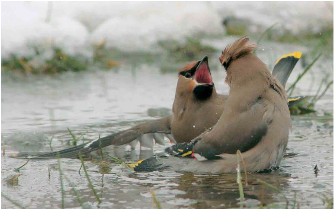
264 Pestvogels / Bohemian Waxwings Bombycilla garrulus , Almere, Flevoland, 3 maart 2006