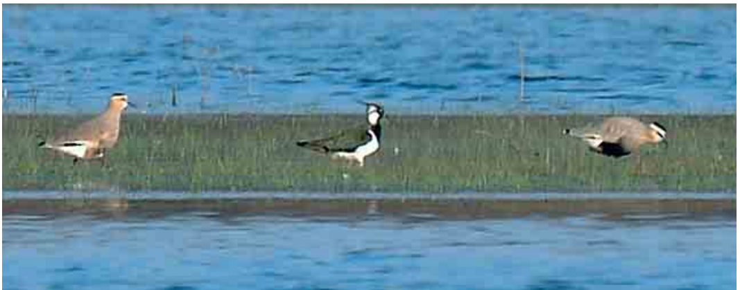
251 Laughing Gull / Lachmeeuw Larus atricilla , first-winter, and Great Black-backed Gull / Grote Mantelmeeuw L. marinus , first-winter, with Lesser Black-backed Gulls / Kleine Mantelmeeuwen L. fuscus , Tarfaya harbour, Morocco, 10 March 2006 (Alex Lees) 252 Sociable Lapwings / Steppiekieviten Vanellus gregarius , adult (right) and first-year, with Northern Lapwing / Kievit V. vanellus , Moosanger-Bernhardsthal, Niederösterreich, Austria, 8 April 2006 (Leander Khil)

WARBLERS TO FLYCATCHERS In Tafilalt, Morocco, a singing Saharan Olivaceous Warbler Acrocephalus pallidus reiseri was sound-recorded in the palm orchards south of Rissani on 4 April. On the same day, one was seen at nearby Dercaoua, Merzouga. At Ghassate Demnat, c 6 km east of Ouarzazate, at least four were singing in the second week of April. On 13 April, three were singing at Hassi Labied, Merzouga. The status of this species in Morocco is poorly documented (cf Dutch Birding 27: 302-307, 2005) but these sightings suggest that it occurs irregularly or may have been overlooked in the past. In March, a Large-billed Reed Warbler A. orinus was trapped in Thailand and the identification was confirmed by feather samples; this species was known from only one specimen collected in Himachal Pradesh, India, in 1867 (Ibis 144: 259-267, 2002). The first Subalpine Warbler Sylvia cantillans for Lithuania was a first-summer male trapped at Ventes Ragas on 7 May. An Eastern Subalpine Warbler S. c. albistriata was identified in Shetland on 8 May. If accepted, a Ménétries's Warbler S. mystacea trapped in the Camargue on 22 April will be the first for France. In the Netherlands, a male Sardinian Warbler S. melanocephala was photographed at Hargen, Noord-Holland, on 26-27 April; a female was reported on Schier-