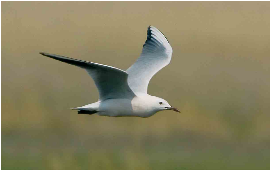
280 Dunbekmeeuw / Slender-billed Gull Larus genei , Dollard, Groningen, 7 mei 2006 (Bas van den Boogaard)