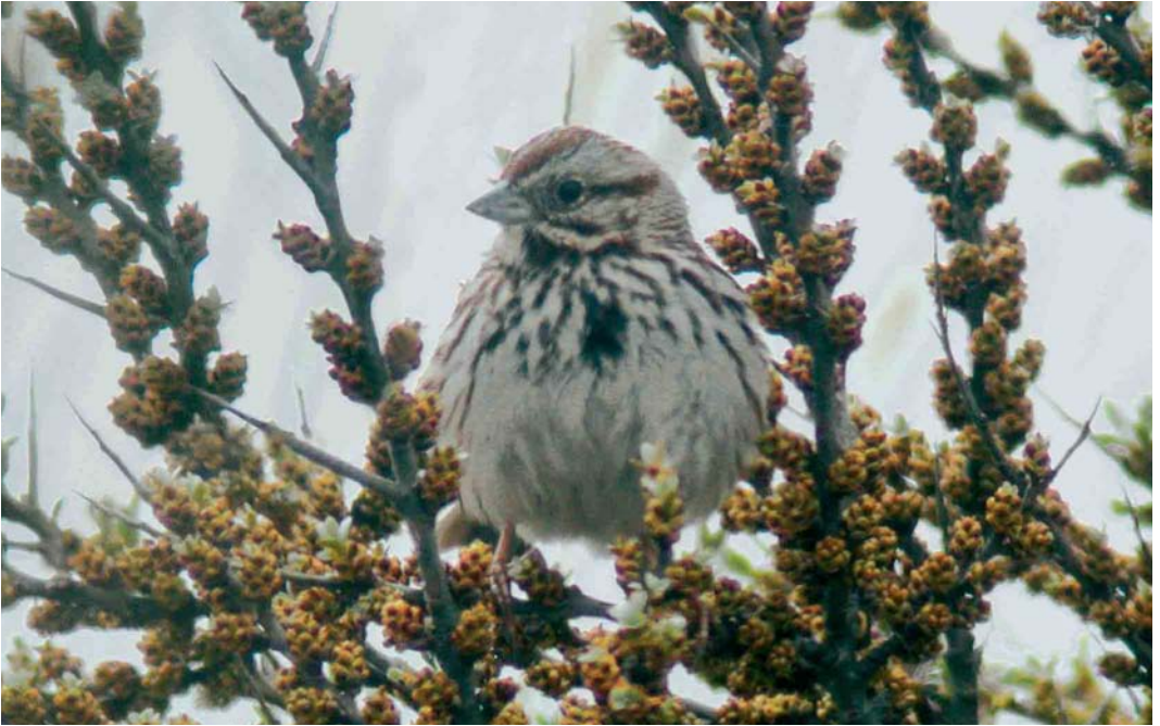
268 Zanggors / Song Sparrow Melospiza melodia , Kabellaarsbank, Zuid-Holland, 30 april 2006