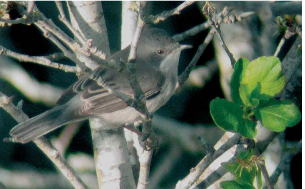
248 Rüppell's Warbler / Rüppells Grasmus Sylvia rueppellii , female, Dwejra, Malta, 26 March 2006