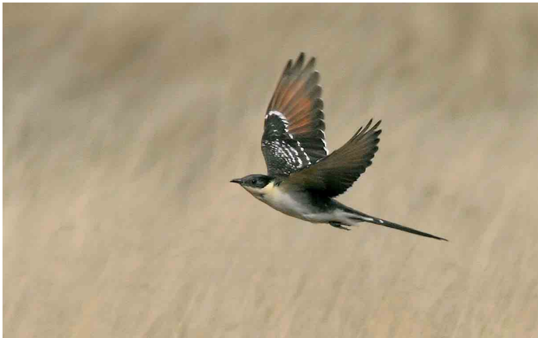
261 Kuifkoekoek / Great Spotted Cuckoo Clamator glandarius , eerste-zomer, Hoge Veluwe, Gelderland, 2 april 2006