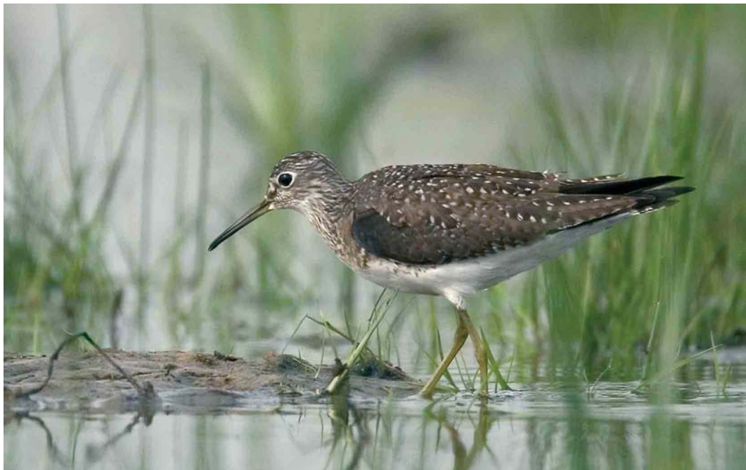
282-283 Amerikaanse Bosruiter / Solitary Sandpiper Tringa solitaria , Bokkegat, Wissenkerke, Zeeland, 17 mei 2006 (Harvey van Diek)