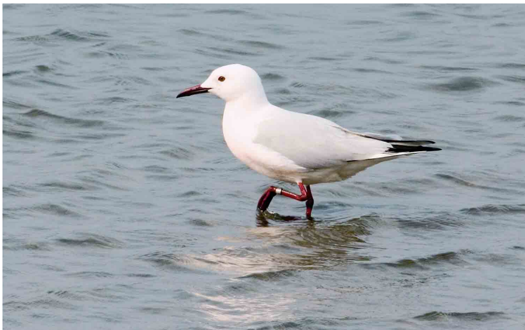
281 Dunbekmeeuw / Slender-billed Gull Larus genei , Het Zwin, West-Vlaanderen, 9 mei 2006