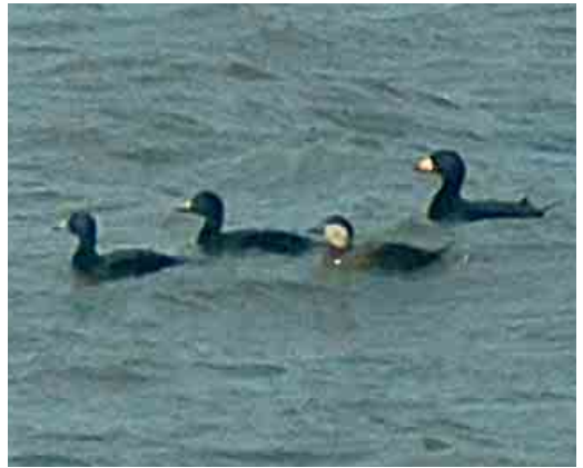
234 Pallid Harrier / Steppekiekendief Circus macrourus , female, De Cocksdorp, Texel, Noord-Holland, Netherlands, 12 May 2006 235 Red-billed Tropicbird / Roodsnavelkeerringvogel Phaethon aethereus , Eilat, Israel, 9 April 2006 236 Black-winged Kite / Grijsze Wouw Elanus caeruleus , second calendar-year, Göksü delta, Turkey, 24 April 2006 237 Black Scoter / Amerikaanse Zee-eend Melanitta americana , male (right), with Common Scoters / Zwarte Zee-eenden M nigra , Blåvandshuk, Vestjylland, Denmark, 5 April 2006

Budapest, on 26 April was the first for Hungary. In the Azores, the female Belted Kingfisher Ceryle alcyon at Santa Cruz, Graciosa, from 9 December 2005 was still present on 22 March (cf Dutch Birding 28: 43, plate 38, 2006). In spring 2006, the number of territories of Middle Spotted Woodpecker Dendrocopos medius in the Netherlands had increased to 72 in Limburg, more than 20 in Twente, Overijssel, and 20 in eastern Noord-Brabant; one near Bergen op Zoom, Noord-Brabant, from 23 March was the furthest west since 1898.