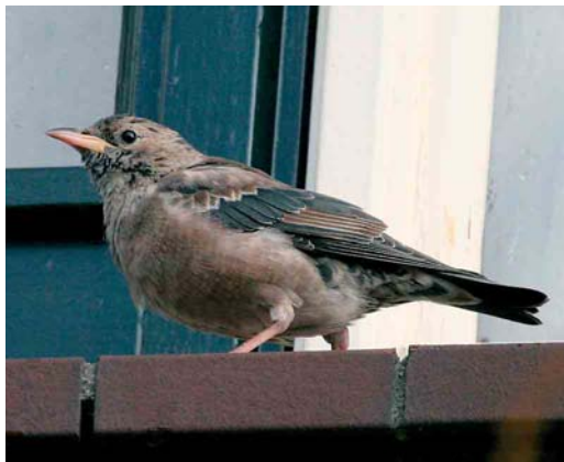
271 Roze Spreeuw / Rose-coloured Starling Sturnus roseus , eerstejaars, Wassenaar, Zuid-Holland, 12 maart 2006 (Edwin Winkel)

toonde op een helaas niet vrij toegankelijk deel van de Kabbe- laarsbank, Zuid-Holland. De volgende dag was de vogel niet meer aanwezig. Indien aanvaard betreft dit de eerste voor Nederland. Ortolanen Emberiza hortulana verschenen op 2 april op Wieringen, op 21 april bij Huizen, Noord-Holland, en op 28 april bij Kerkrade, Limburg. Op 21 april was een Bosgors E rustica kort ter plaatse bij de Bokkesprong te Groet, Noord-Holland. De Dwerggors E pusilla van Katwijk aan Zee