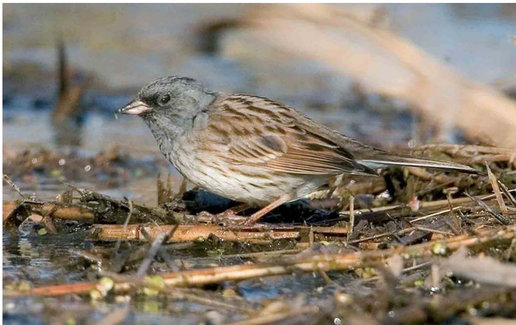
250 Black-faced Bunting / Maskergors Emberiza spodocephala , male, Mas Neuf, Camargue, Bouches-du-Rhône, France, 12 April 2006