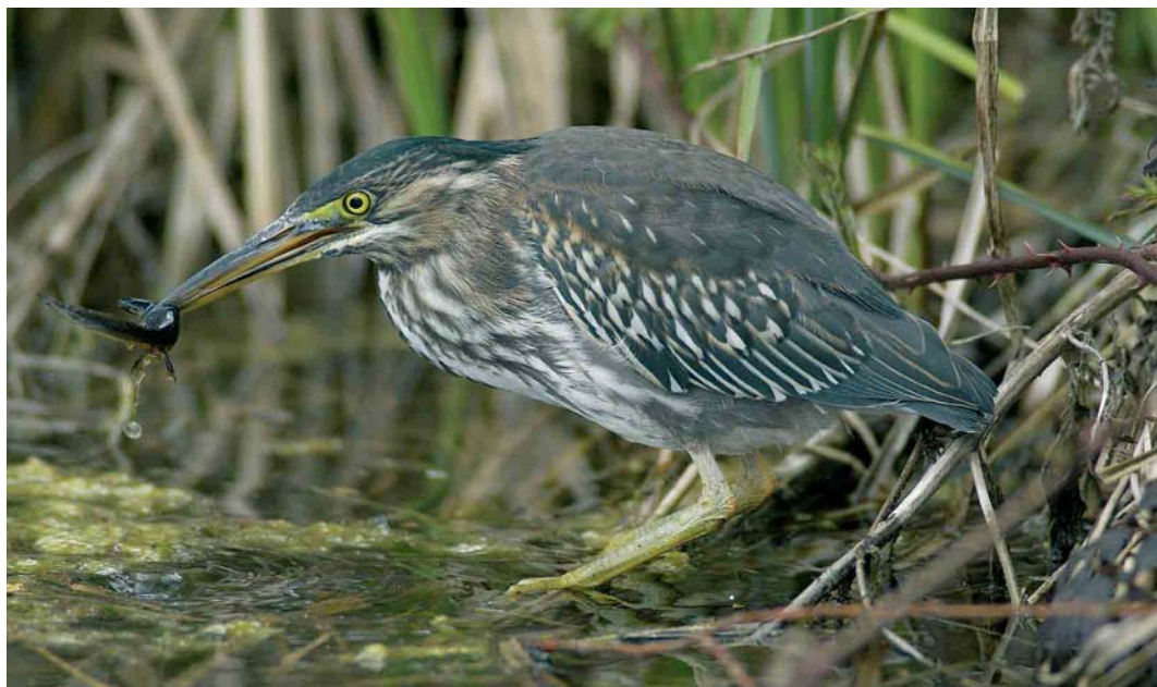
258 Groene Reiger / Green Heron Butorides virescens , eerstejaars, Nieuwe Meer, Amsterdam, Noord-Holland, 28 april 2006

KRAANVOGELS TOT ALKEN Van 4 tot 25 maart was er een sterke doortrek van Kraanvogels Grus grus . In totaal werden er ruim 11 000 doorgegeven met als piekdagen 7, 13 tot 15, 18 en 23 maart. Steltkluten Himantopus himantopus werden gezien van 15 tot 25 april in De Blikken bij Groede, Zeeland, met een maximum van vijf op 15 april. Verder waren er op 19 april vijf bij Etten-Leur, Noord-Brabant, op 21 april twee bij Oostburg, Zeeland, op 25 april vier in de Oostvaardersplassen, en twee bij Westmaas, Zuid-Holland, en op 27 april één in de Scherpenissepolder. Langsvliegende Vorkstaartplevieren Glareola pratincola werden gemeld op 26 april bij Gaarkeuken, Groningen, en op 30 april bij Nijkerk, Gelderland. Een Morinplevier Charadrius morinellus verbleef van 10 tot 13 april op Texel en vijf pleisterden op 26 april bij Colijnsplaat, Zeeland. Overvliegende Morinellen werden waargenomen op 15 april langs Breskens, Zeeland, en op 23 april over de Strabrechtse Heide, Noord-Brabant, en de Landschotse Heide, Noord-Brabant. Een Gestreepte Strandloper Calidris melanotos foerageerde op 25 april bij de Grote Praambult in Oostvaardersplassen. De eerste twee Poelruiters Tringa stagnatilis van het seizoen vlogen al op 15 april langs Breskens. Daarna volgden waarnemingen op 17 april bij De Blocq van Kuffeler, Flevoland, van 20 tot 26 april in de Loowaard bij Loo,