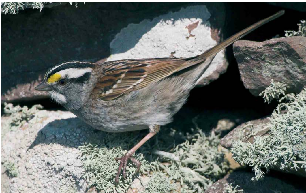
249 White-throated Sparrow / Witkeelgors Zonotrichia albicollis , Sumburgh Farm, Shetland, Scotland, 14 May 2006 (Hugh Harrop)