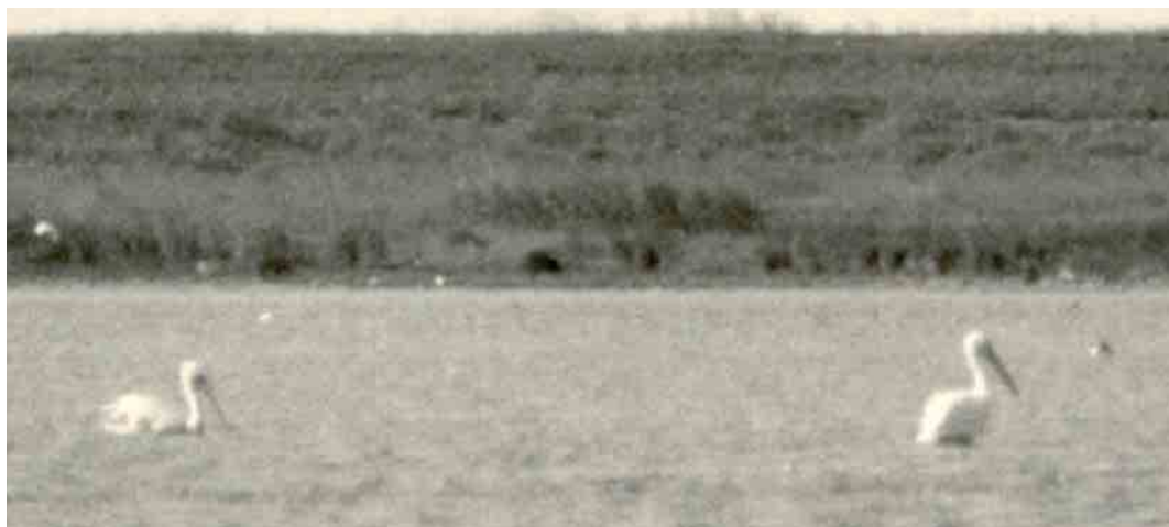
175 Kroeskoppelikaan / Dalmatian Pelican Pelecanus crispus , adult (links) en Roze Pelikaan / Great White Pelican P. onocrotalus , adult, Grevelingen, Zuid-Holland, juni 1975

Het lijkt aannemelijk dat beide pelikanen in 1975 samen in het Deltagebied zijn gearriveerd maar het is ook denkbaar dat beide apart in Nederland zijn gearriveerd en elkaar vervolgens in het Deltagebied hebben gevonden.