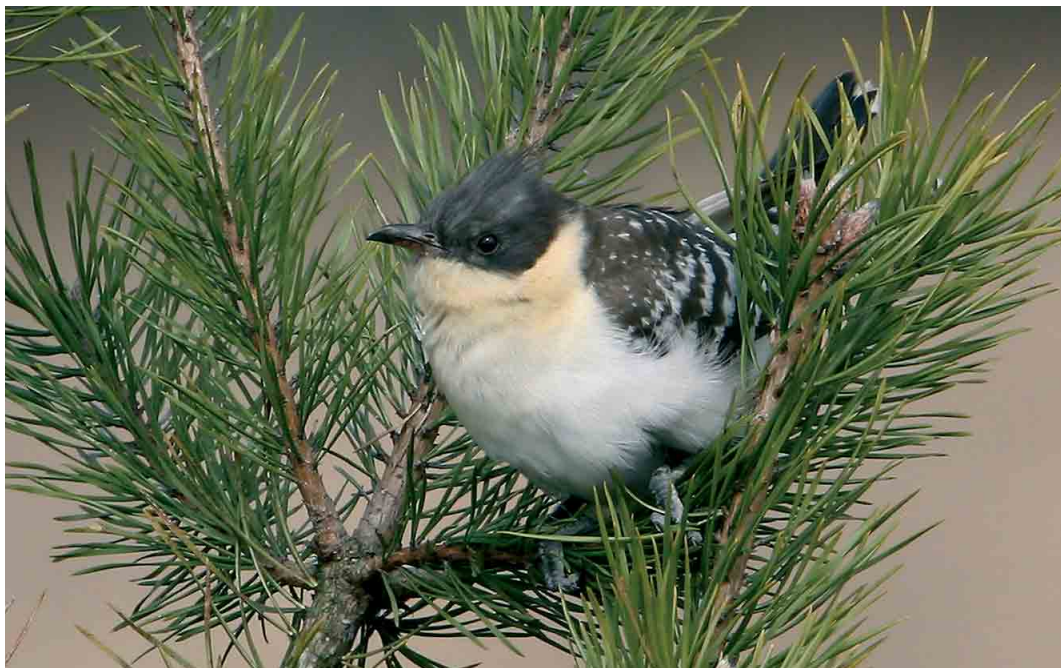
262 Kuifkoekoek / Great Spotted Cuckoo Clamator glandarius , eerste-zomer, Hoge Veluwe, Gelderland, 3 april 2006 (Roland Jansen)