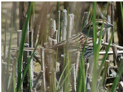
277 Zanggors / Song Sparrow Melospiza melodia , Kabbelaarsbank, Zuid-Holland, 30 april 2006 (René van Loo)

Spectaculaire influx van Dunbekmeeuwen Op zaterdag 6 mei 2006 was Peter Lindenburg op de trektelepost bij Breskens, Zeeland. Omdat de wind in de verkeerde hoek zat en daardoor de trek bijzonder tegenviel besloot hij in de middag naar De