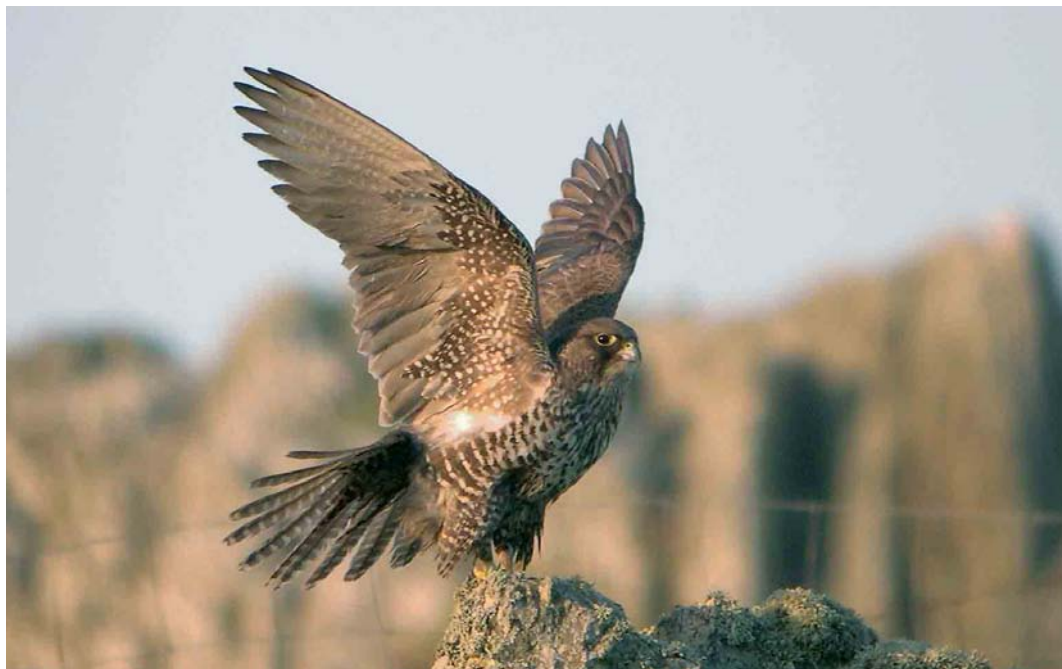
244 Gyr Falcon / Giervalk Falco rusticolus , first-year, Ouessant, Finistère, France, 4 May 2006 245 American Herring Gull / Amerikaanse Zilvermeeuw Larus smithsonianus , third-year, Nimmo's Pier, Galway, Ireland, 14 April 2006 246 Eurasian Scops Owl / Dwergooruil Otus scops , Swining, Mainland, Shetland, Scotland, 10 May 2006