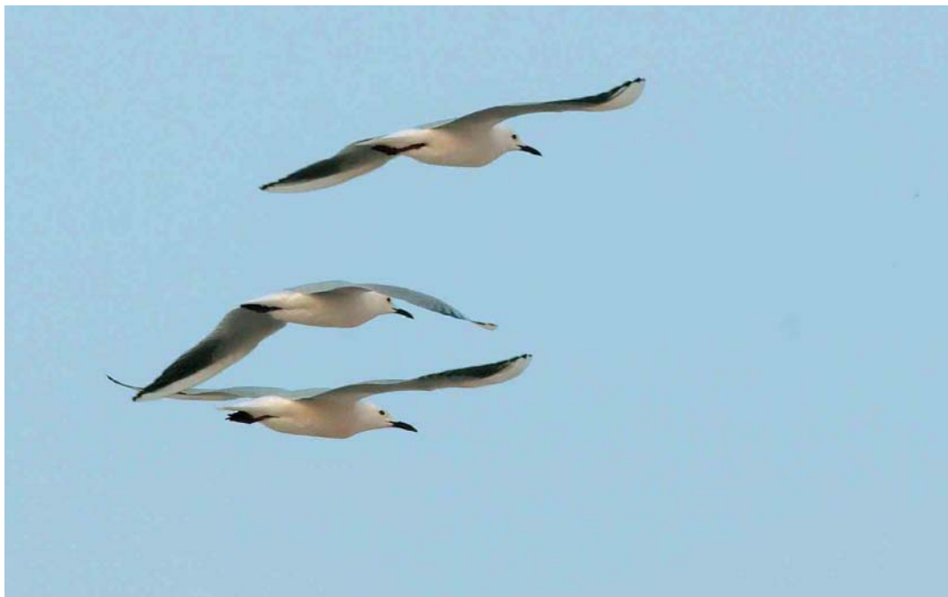
278 Dunbekmeeuwen / Slender-billed Gulls Larus genei , De Kreupel, Medemblik, Noord-Holland, 5 mei 2006 ( Eelke Schoppers )