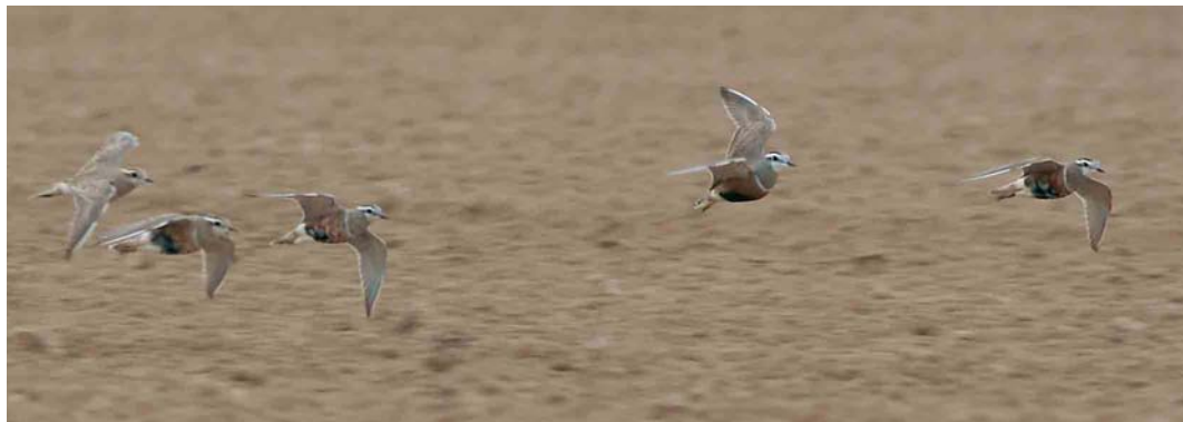
273 Morinelplevieren / Eurasian Dotterels Charadrius morinellus , Outgaarden, Vlaams-Brabant, 23 April 2006 (Vincent Legrand)

ZWALUWEN TOT GORZEN Op 29 april foerageerde kortstondig een Roodstuitzwaluw Cecropis daurica boven Het Vinne in Zoutleeuw, Vlaams-Brabant. Grote Piepers Anthus richardi werden waargenomen in Ninove, Oost-Vlaanderen, op 9 april