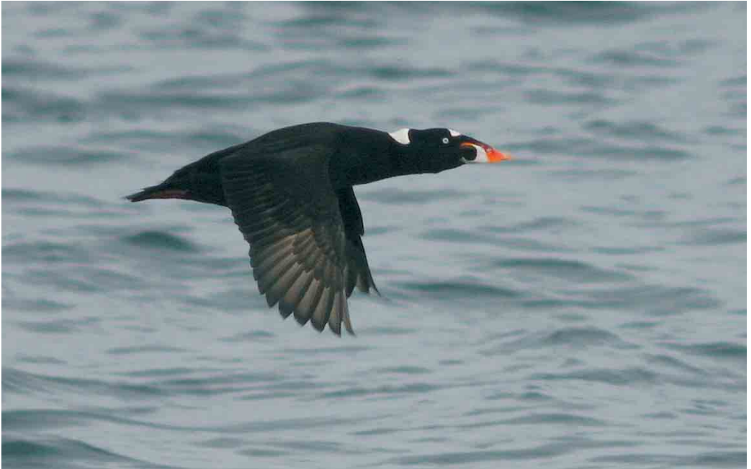
232 Surf Scoter / Brilzee-eend Melanitta perspicillata , adult male, Lista, Vest-Agder, Farsund, Norway, 1 April 2006