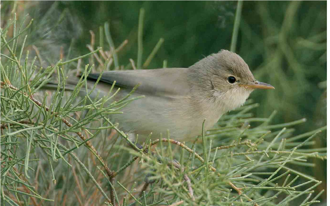
247 Saharan Olivaceous Warbler / Saharaanse Vale Spotvogel Acrocephalus pallidus reiseri , Hassi Labied, Merzouga, Morocco, 13 April 2006 (Stefan Mcelwee)