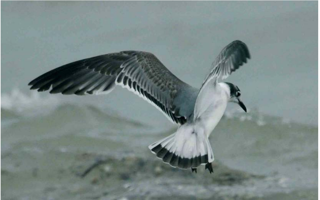
242 Franklin's Gull / Franklins Meeuw Larus pipixcan , Kilcoole, Wicklow, Ireland, 19 March 2006