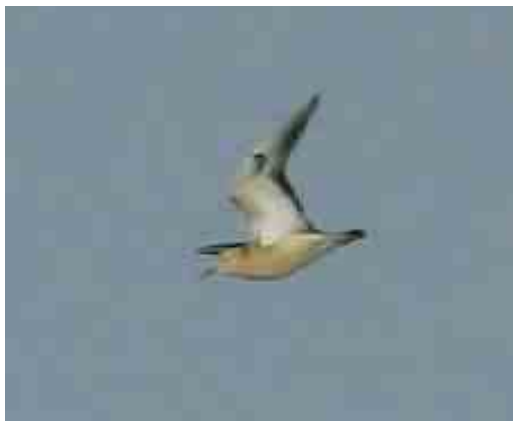
272 Blonde Ruiter / Buff-breasted Sandpiper Tryngites subruficollis , Stuivekenskerke, West-Vlaanderen, 28 april 2006 (Patrick Beirens)

lend was de plotselinge toename van het aantal Middelste Bonte Spechten Dendrocopos medius in Vlaanderen. Van de volgende plaatsen ontvingen we waarnemingen: Alken, Limburg; Beverlo, Limburg; Bilzen, Limburg (twee); Bonheiden, Antwerpen; Brakel, Oost-Vlaanderen; Brasschaat, Antwerpen (drie); Brecht; De Panne, West-Vlaanderen; Destelbergen; Drongen, Oost-Vlaanderen; Galmaarden, Vlaams-Brabant; Geraardsbergen, Oost-Vlaanderen; Heers, Limburg; Helschot, Antwerpen; Herselt, Antwerpen (twee); Kampenhout, Vlaams-Brabant (twee); Kersbeek-Miskom, Vlaams-Brabant (drie); Kortesseem, Limburg; Lille, Antwerpen (twee); Mariakerke, Oost-Vlaanderen; Melsbroek, Vlaams-Brabant; Oud-Heverlee, Vlaams-Brabant; Ruij, Oost-Vlaanderen; Schelderode, Oost-Vlaanderen; Schiplaken, Vlaams-Brabant; Sint-Job-in-'t-Goor, Antwerpen; Tessenderlo, Limburg; Torhout, West-Vlaanderen; Veerle-Laakdal, Antwerpen; Voeren, Limburg (vijf); Westerlo, Antwerpen (twee); en Zoersel, Antwerpen (twee).