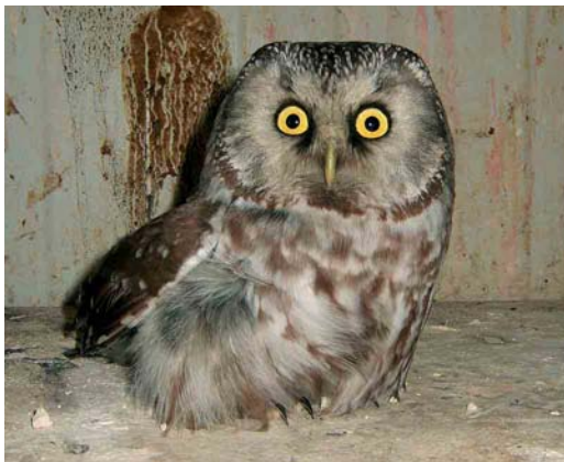
270 Ruigpootuil / Tengmalm's Owl Aegolius funereus (opge- raapt bij Belfeld, Limburg, op 7 maart 2006), 8 maart 2006 (Justin Jansen)