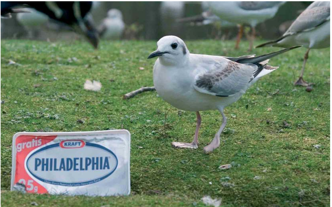
243 Bonaparte's Gull / Kleine Kokmeeuw Larus philadelphia , Parque Isabel La Catolica, Xixón, Asturias, 6 March 2006 (Rafael Armada)