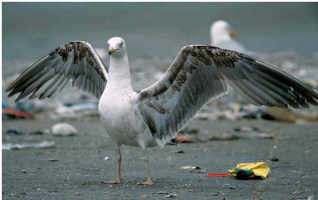
210 Lesser Black-backed Gull / Kleine Mantelmeeuw Larus fuscus , third calendar-year, Wijster, Drenthe, Netherlands, 2 July 2001. Graellsii -type.

The timing of moult may have a strong effect on what feathers may end up looking like. An interesting example in this respect is that of Great Spotted Cuckoo Clamator glandarius : different populations of this species differ in the timing of the 'post-juvenile' moult in a way similar to Lesser Black-backed Gull. The plumage attained by this moult is similar to the juvenile plumage when acquired early but more adult-like in late-moulting birds (van der Elst & Hubaut 1990, Lansdown & Hathway 1995). This phenomenon has recently been discussed in relation to 'large white-headed gulls' (Howell 2001, Lonergan & Mullarney 2003) and many observations on Lesser Black-backed Gulls suggest this phenomenon applies to this species. This means that a single bird may grow differently patterned feathers –