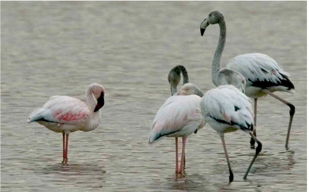
231 Lesser Flamingo / Kleine Flamingo Phoenicopterus minor (left), with Greater Flamingos / Flamingo's P roseus , Eilat, Israel, April 2006 (Otto Plantema)