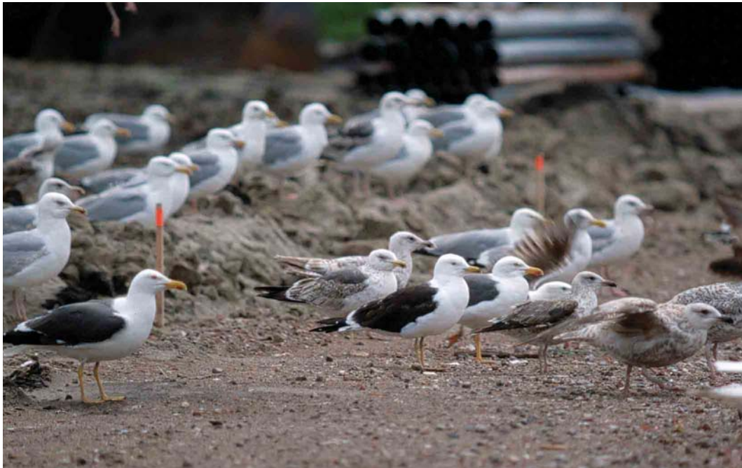
209 Lesser Black-backed Gulls / Kleine Mantelmeeuwen Larus fuscus and European Herring Gulls / Zilvermeeuwen L. argentatus , Wijster, Drenthe, Netherlands, 3 June 2001. Nominote third calendar-year fuscus -type in the centre; note moult contrast between p6 and p7, small mirror in p10 and blackish upperparts. Compare with similarly aged graellsii -type behind it on the left.

in the field under reasonable to good observation conditions.