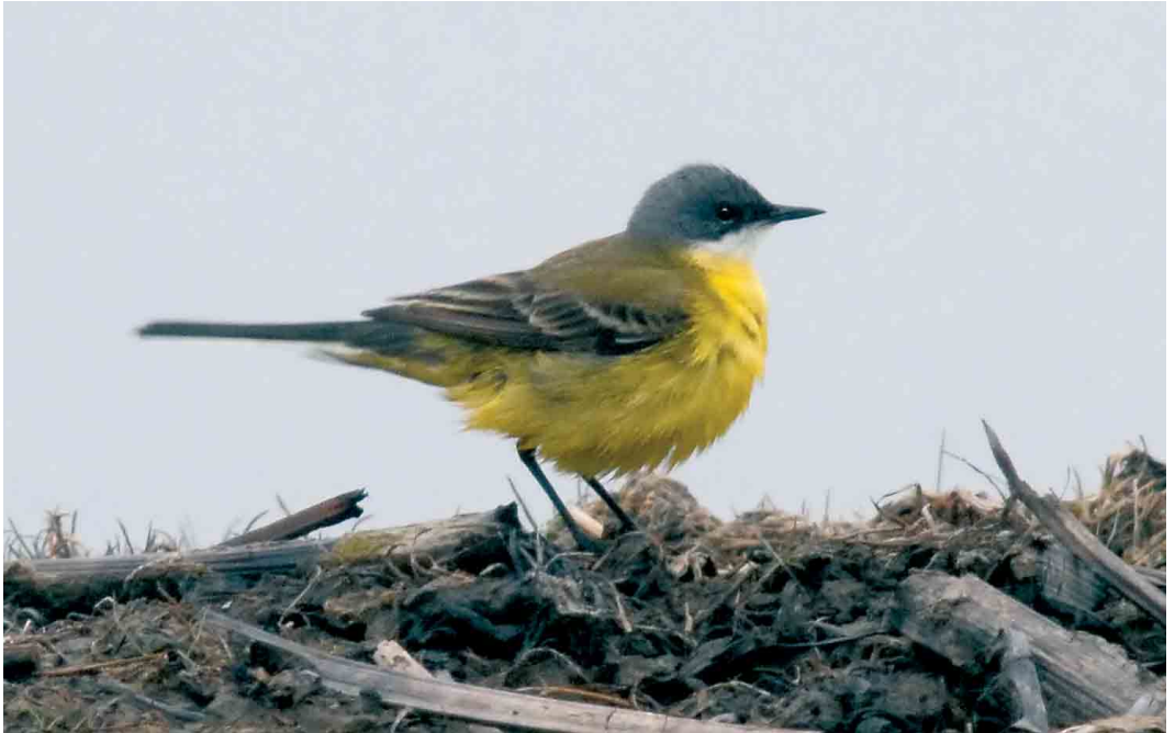
263 Italiaanse Kwikstaart / Ashy-headed Wagtail Motacilla cinereocapilla , mannetje, Camperduin, Noord-Holland, 16 april 2006