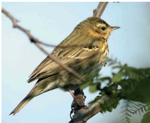
229 Olive-backed pipit / Siberische Boompieper Anthus hodgsoni , Happy Island, Hebei, China, May 2005.

Another species of the smaller pipits showing only very faint mantle-streaks is Olive-backed Pipit A hodgsoni . Note that the long hind claw in the mystery bird is rather short for a pipit. This is typical for both Tree Pipit A trivialis and Olive-backed; Tree is easily eliminated because of the near lack of mantle-streaks. Note also that the tone of the upperparts in the mystery photograph is slightly tinged with olive, which is another strong pointer for Olive-backed. These characters, together with the pinkish legs, the fine flank-streaks and the pure white belly, clinch the identity of the mystery bird as Olive-backed Pipit. It was photographed by Nils van Duivendijk on Happy Island, Hebei, China, in May 2005. Another photograph of the same bird is shown as plate 229. It was correctly identified by 83% of the entrants, with incorrect answers being Tree Pipit (7%), Buff-bellied Pipit (4%) and a variety of other songbirds (6%).