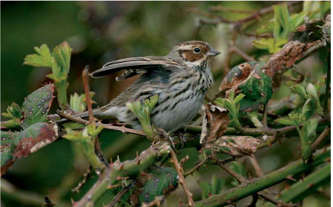
269 Dwerggors / Little Bunting Emberiza pusilla , Katwijk, Zuid-Holland, 12 april 2006 (Willem Pompert)