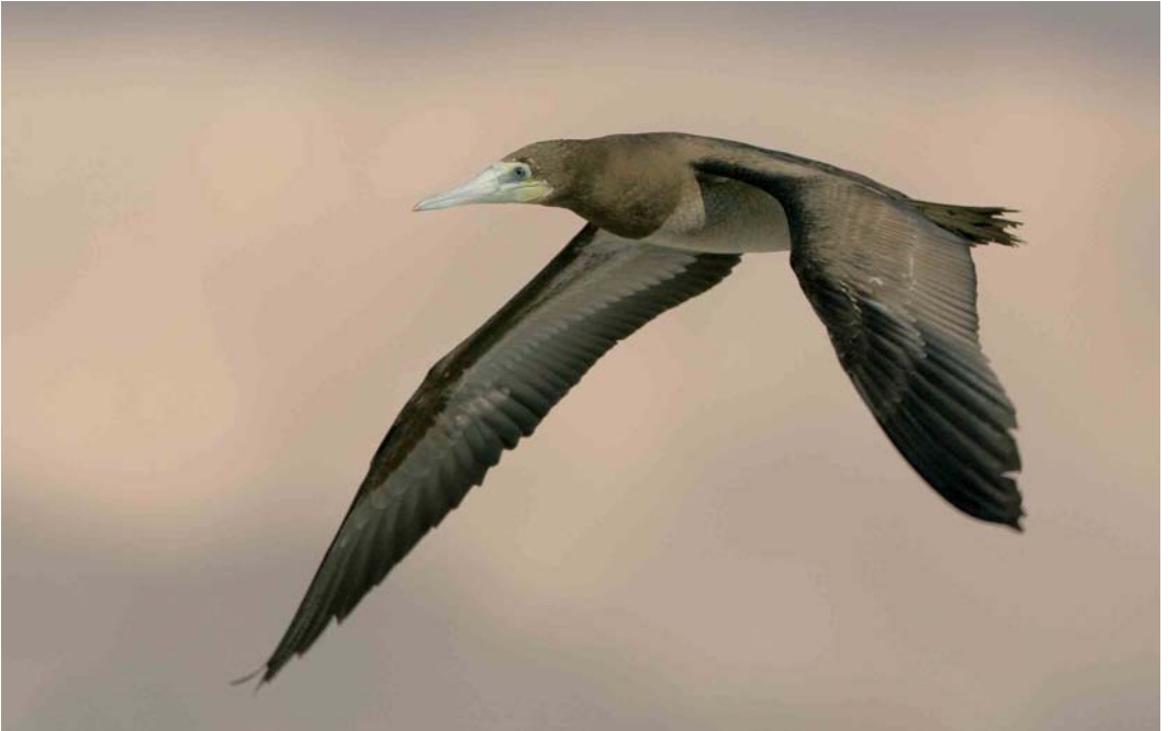
230 Brown Booby / Bruine Gent Sula leucogaster , Eilat, Israel, 2 April 2006 (Arie Ouwerkerk)