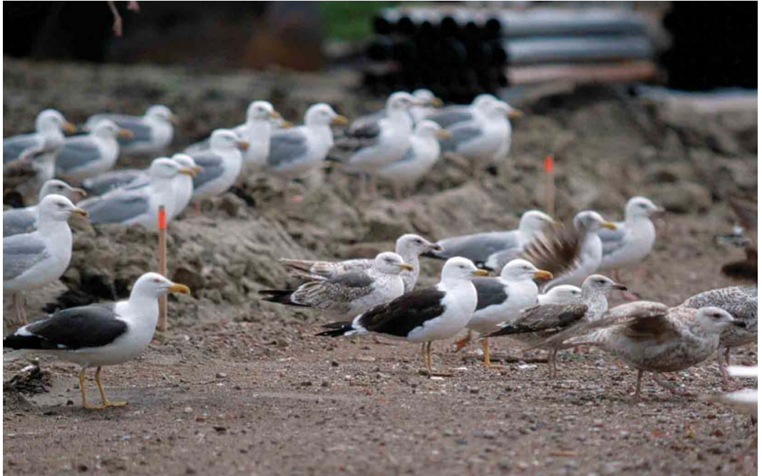
209 Lesser Black-backed Gulls / Kleine Mantelmeeuwen Larus fuscus and European Herring Gulls / Zilvermeeuwen L. argentatus , Wijster, Drenthe, Netherlands, 3 June 2001. Nominote third calendar-year fuscus -type in the centre; note moult contrast between p6 and p7, small mirror in p10 and blackish upperparts. Compare with similarly aged graellsii -type behind it on the left.

in the field under reasonable to good observation conditions.