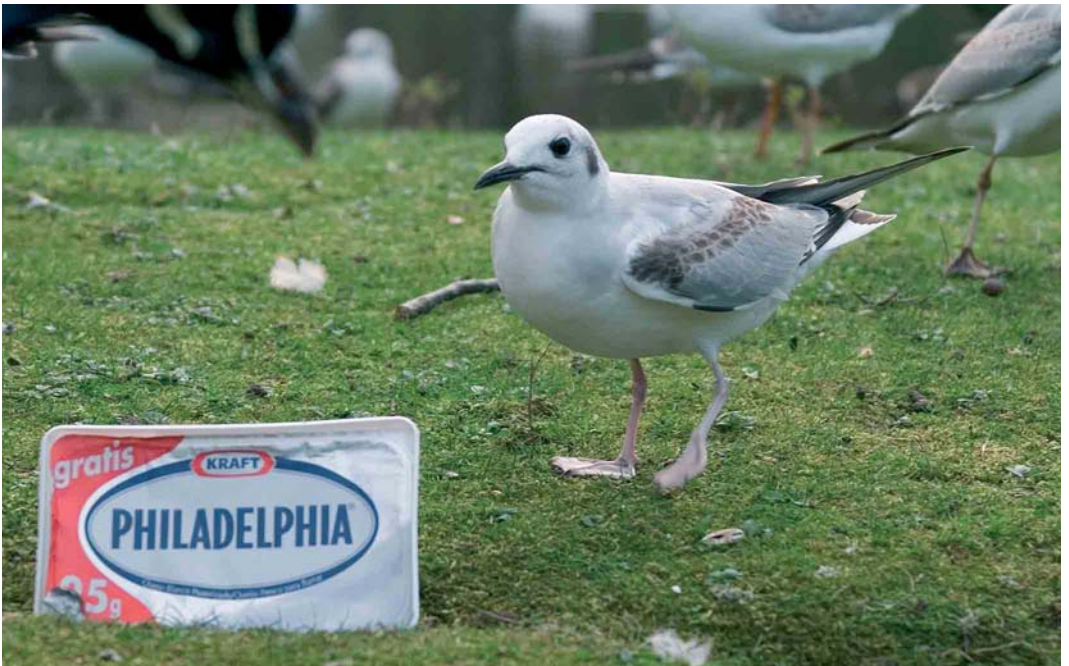
243 Bonaparte's Gull / Kleine Kokmeeuw Larus philadelphia , Parque Isabel La Catolica, Xixón, Asturias, 6 March 2006