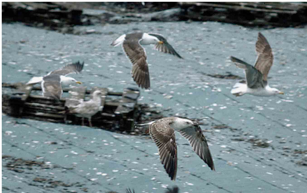
184 Lesser Black-backed Gulls / Kleine Mantelmeeuwen Larus fuscus and European Herring Gulls / Zilvermeeuwen L. argentatus , Wijster, Drenthe, Netherlands, 10 June 2000. On second calendar-year Lesser Black-backed Gull, all visible feathers moulted, except outer two primaries and their coverts. Plumage rather typical for birds observed with this moult pattern.

When the variation in the extent of the first moult in the upperparts (ie, back, tail and upperwing) is considered, all patterns observed form a continuum fitting a front-to-back and inside-out sequence of replacement, in which the front-to-back (mantle to tail) and inside-out line (scapulars to primaries) develop more or less simultaneously. This sequence is similar to that of the 'post-juvenile moult' of many bird species. It should be noted, however, that this sequence is largely inferred from birds showing arrested moult in spring. I lack