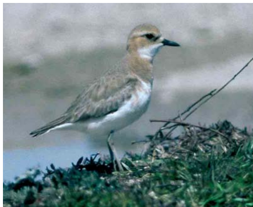
228 Anatolian Sand Plover / Anatolische Woestijnplevier Charadrius leschenaultii columbinus , female, Silifke, Turkey, 21 March 1987. Note short but pointed bill, lacking bulbous tip of Lesser Sand Plover C. mongolus .

approaches Lesser Sand most in this respect, especially the western subspecies of Lesser Sand (Tibetan Sand Plover, ie, the 'atrifrons subspecies group', comprising C. m. pamirensis , atrifrons and schaeferi ), but never shows a bill-tip as blunt as Lesser Sand. When measured, the nail of the mystery bird covers only c 45% of the total bill length, thereby favouring Lesser Sand. The shape of the nail is rather bulbous and, therefore, fits Lesser Sand better. Even more structural features can be measured from photographs and used for identification. In columbinus , the tarsus length is at most 1.78 times the bill length, while the minimum value for Lesser Sand ( C. m. schaeferi ) is 1.70. The mystery bird shows a tarsus about two times longer than the bill length, well into the range of Lesser Sand and well beyond the maximum reported for Greater Sand.