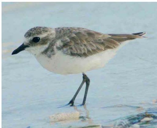
227 Lesser Sand Plover / Mongoolse Plevier Charadrius mongolus , second calendar-year, Lhaviyani Atoll, Maldives, July 2004 (Chris van Rijswijk). Note structure, with more 'weight' before the legs than in Greater Sand Plover C. leschenaultii .