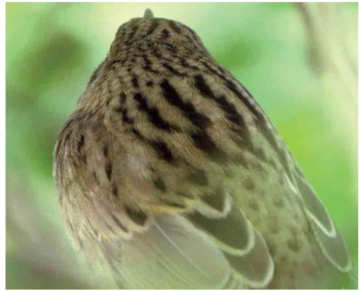
Mystery photograph II (May)

below carefully and identify the birds in the photographs. Solutions can be sent in three different ways: