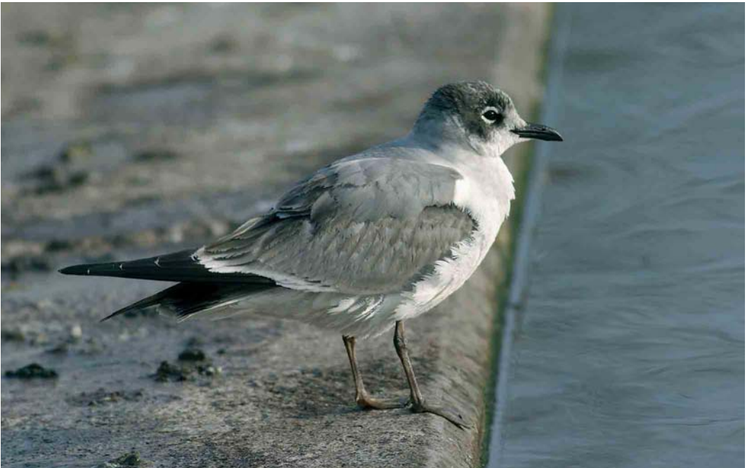
31 Franklin's Gull / Franklins Meeuw Larus pipixcan , first-winter, Schaffhausen, Switzerland, 15 January 2006 (Adrian Jordi)