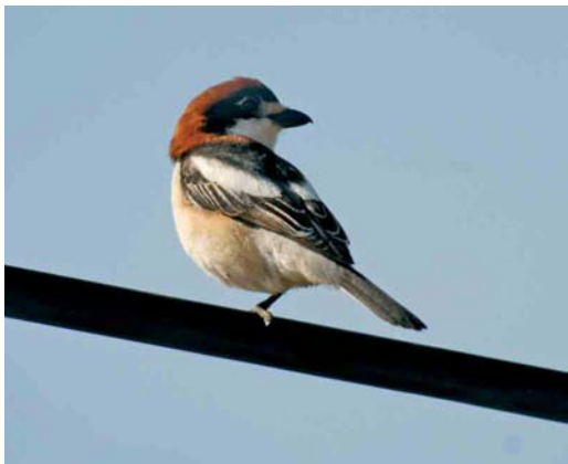
257 Balearic Woodchat Shrike / Balearische Roodkopkluwvier Lanius senator badius, male, Aoulouz, Morocco, 5 April 2006