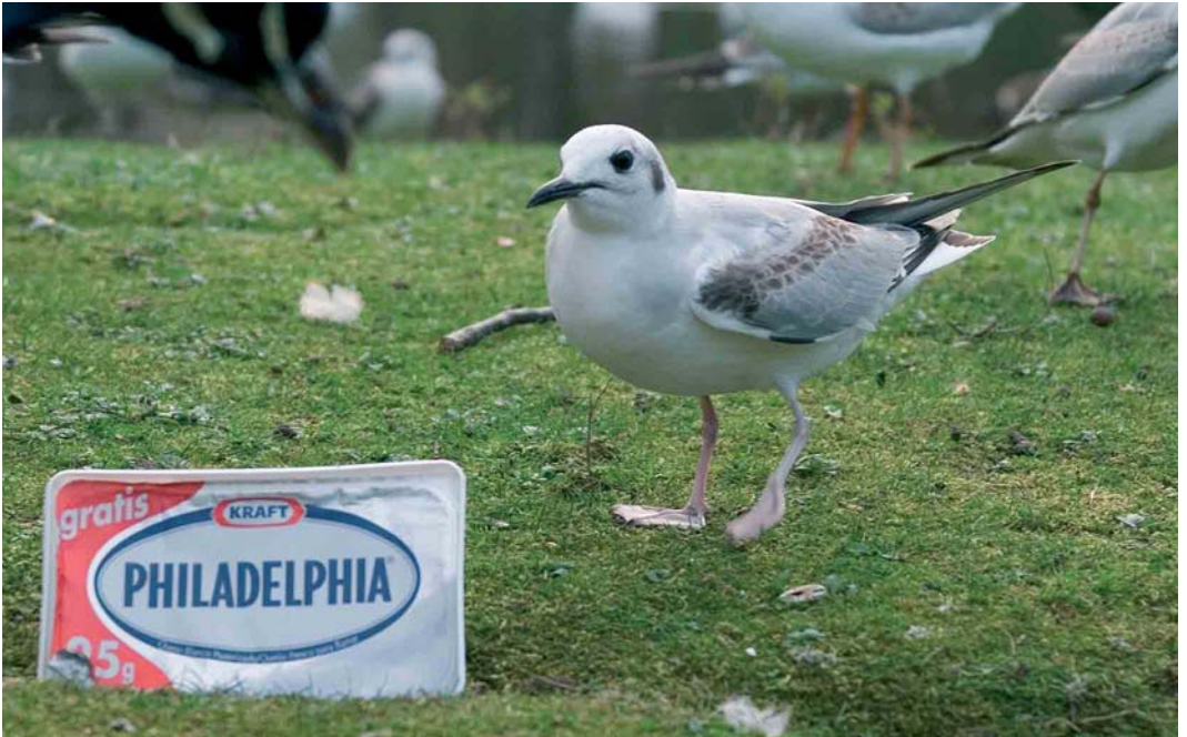
243 Bonaparte's Gull / Kleine Kokmeeuw Larus philadelphia , Parque Isabel La Catolica, Xixón, Asturias, 6 March 2006 (Rafael Armada)