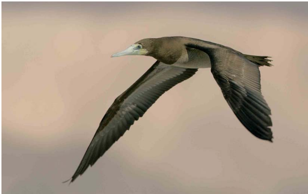
230 Brown Booby / Bruine Gent Sula leucogaster , Eilat, Israel, 2 April 2006 (Arie Ouwerkerk)