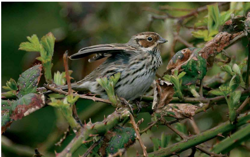
269 Dwerggors / Little Bunting Emberiza pusilla , Katwijk, Zuid-Holland, 12 april 2006