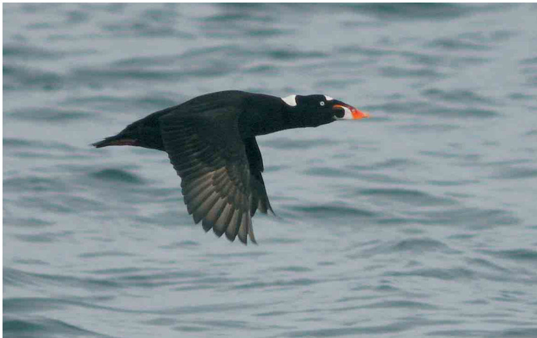
232 Surf Scoter / Brilzee-eend Melanitta perspicillata , adult male, Lista, Vest-Agder, Farsund, Norway, 1 April 2006 (Jan Bisschop)