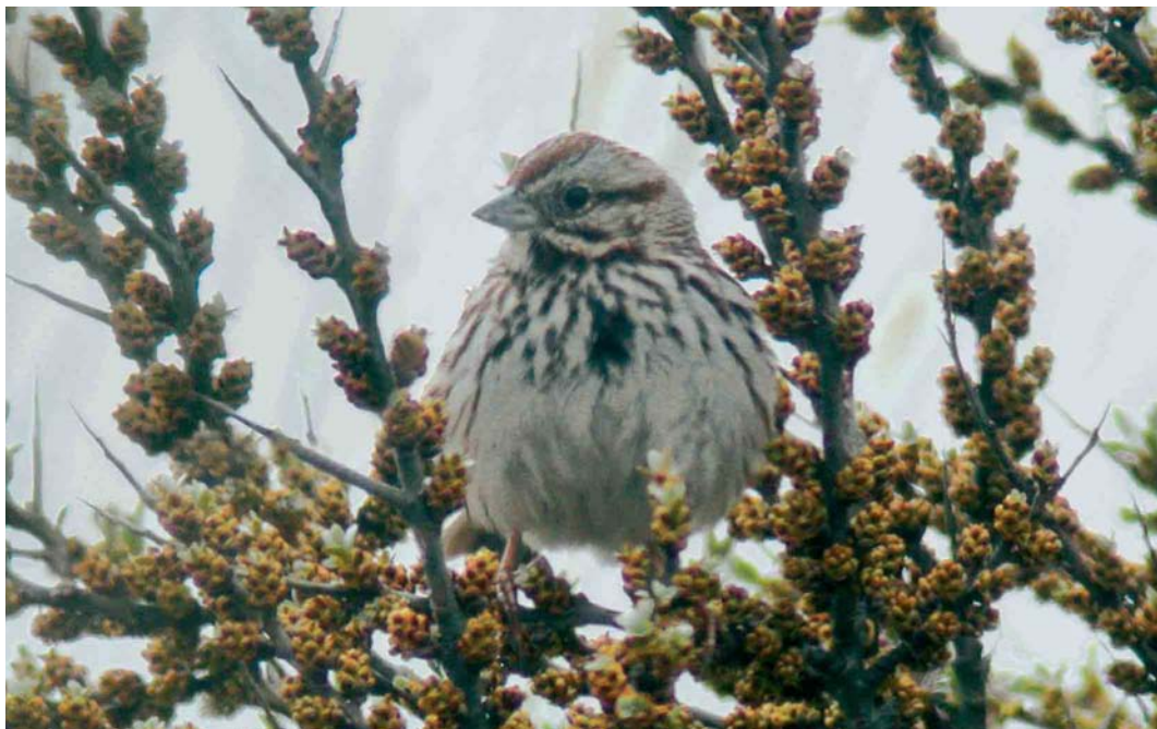
268 Zanggors / Song Sparrow Melospiza melodia , Kabellaarsbank, Zuid-Holland, 30 april 2006 (Pim A Wolf)