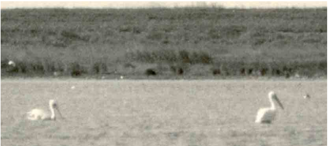
175 Kroeskoppelikaan / Dalmatian Pelican Pelecanus crispus , adult (links) en Roze Pelikaan / Great White Pelican P. onocrotalus , adult, Grevelingen, Zuid-Holland, juni 1975

Het lijkt aannemelijk dat beide pelikanen in 1975 samen in het Deltagebied zijn gearriveerd maar het is ook denkbaar dat beide apart in Nederland zijn gearriveerd en elkaar vervolgens in het Deltagebied hebben gevonden.