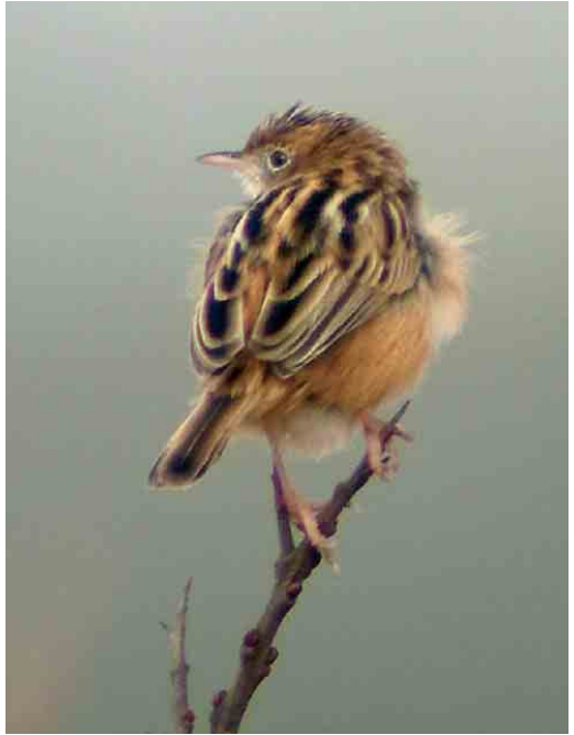
265 Graszanger / Zitting Cisticola juncidis , Lentevreugd, Katwijk, Zuid-Holland, 22 maart 2006 266 Graszanger / Zitting Cisticola juncidis , Lentevreugd, Katwijk, Zuid-Holland, 16 maart 2006 267 Kleine Zwartkop / Sardinian Warbler Sylvia melanocephala , mannetje, Hargen aan Zee, Noord-Holland, 27 april 2006