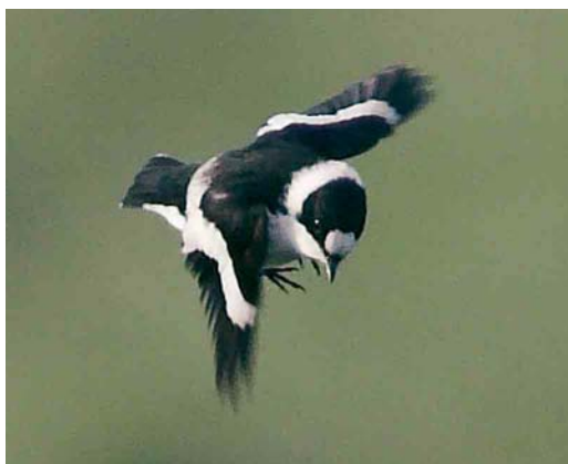
253 Franklin's Gull / Franklins Meeuw Larus pipixcan , first-winter, with Audouin's Gulls / Audouins Meeuwen L. audouinii , first-winter, and Lesser Black-backed Gull / Kleine Mantelmeeuw L. fuscus graellsii , Oued Souss, Agadir, Morocco, 6 April 2006 ( Arnoud B van den Berg ) 254 Solitary Sandpiper / Amerikaanse Bosruiter Tringa solitaria , Wissenkerke, Zeeland, Netherlands, 14 May 2006 ( Arnoud B van den Berg ) 255 Semi-collared Flycatcher / Balkanvliegenvanger Ficedula semitorquata , Eilat, Israel, 30 March 2006 ( Arie Ouwerkerk ) 256 Collared Flycatcher / Withalsvliegenvanger Ficedula albicollis , male, Brow Marsh, Shetland, Scotland, 10 May 2006 ( Hugh Harrop )

Desert Sparrows Passer simplex were seen between Dakhla and Awserd (Aoussard) including a pair with a young. Two Hornemann's Redpolls Carduelis hornemanni hornemanni were present on Hermaness, Shetland, on 29-30 April. A Long-tailed Rosefinch Uragus sibiricus was seen at Lågskär bird observatory, Lemland, Finland, on 8 May. The first Song Sparrow Melospiza melodia for the Netherlands was photographed at Kabbelaarsbank, Brouwersdam, Zuid-Holland, on 30 April. In Shetland, a male White-throated Sparrow Zonotrichia albicollis was present at Sumburgh Farm from 13 May onwards. A male Black-faced Bunting Emberiza spodocephala at Mas Neuf, Camargue, on 8-14 April was the first for France. The fourth Pine Bunting E. leucocephalos for Spain at Cases del Señor, Monovar, Alacant, from 15 January was still present on 16 March. A female at Kirchdorf, Oberösterreich, on 7-13 April was the 11th for Austria. A male Yellowhammer E. citrinella was found near Oulad Berhil, Taroudannt, Morocco. In Liège, Belgium, Cirl Buntings E. cirius were trapped at Seraing on 26 March, at Amay on 21 April and at Awirs on 23 April. If accepted, one near Falkenberg, Halland, in late April was the first for