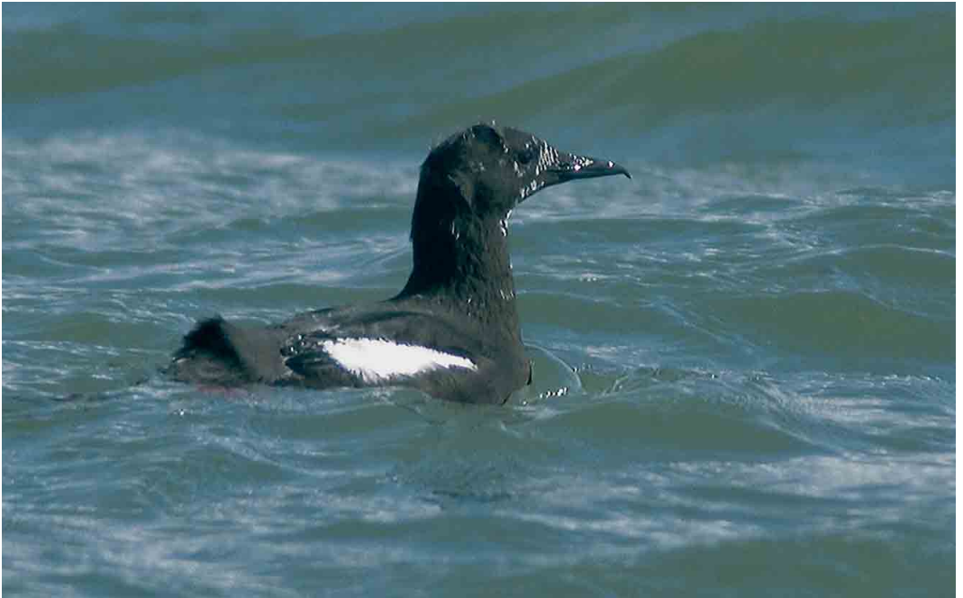
260 Zwarte Zeekoet / Black Guillemot Cepphus grylle , adult, NIOZ-haven, Texel, Noord-Holland, 2 april 2006