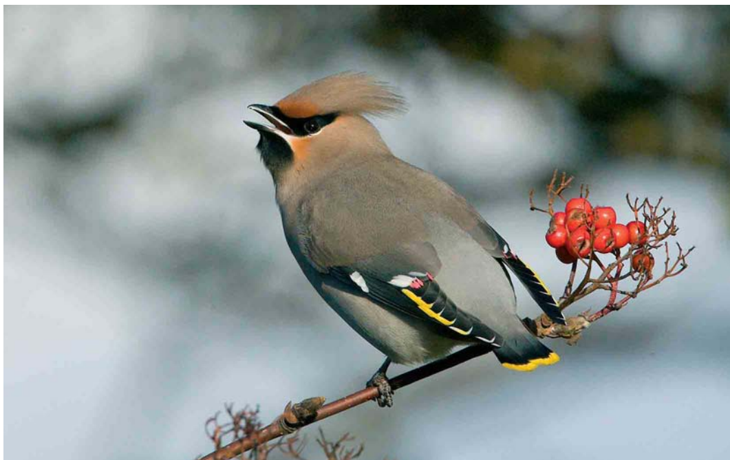
82 Pestvogel / Bohemian Waxwing Bombycilla garrulus , adult, Terschelling, Friesland, 17 november 2005 (Arie Ouwerkerk)