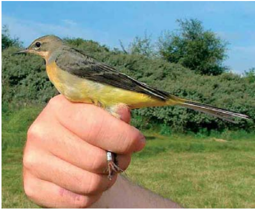
26 Grey Wagtail / Grote Gele Kwikstaart Motacilla cinerea , Meijndel, Zuid-Holland, Netherlands, 13 September 2005