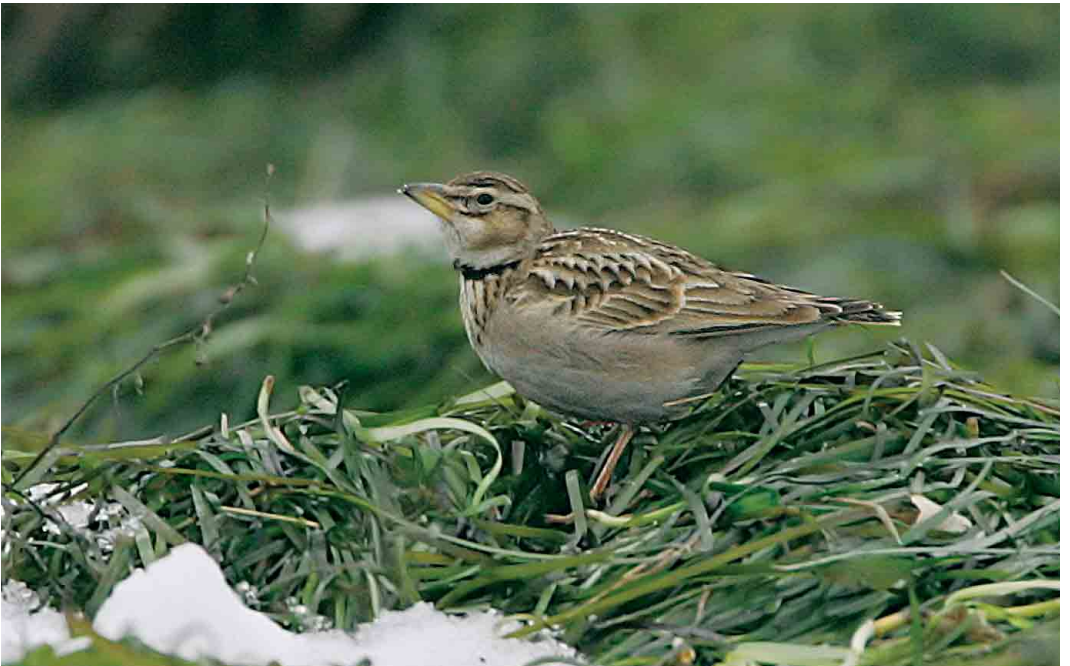
36 Bimaculated Lark / Bergkalanderleeuwerik Melanocorypha bimaculata , Ølsemagle Revle, Sjælland, Denmark, 4 January 2006