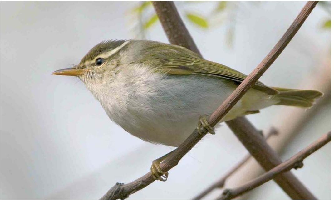
28 Eastern Crowned Warbler / Kroonboszanger Phylloscopus coronatus , Happy Island, Hebei, China, 4 May 2005. Eastern Crowned Warbler can appear rather similar to Arctic Warbler P borealis . Distinguishing features visible in this plate include the clean white underparts and the dark crown-side. 29 Eastern Crowned Warbler / Kroonboszanger Phylloscopus coronatus , Happy Island, Hebei, China, May 2005. From the Phylloscopus warblers recorded in the Western Palearctic, Eastern Crowned Warbler is the only species combining a pale median crown-stripe with plain tertials. Note also the strongly contrasting dark crown-side and the double wing-bar.