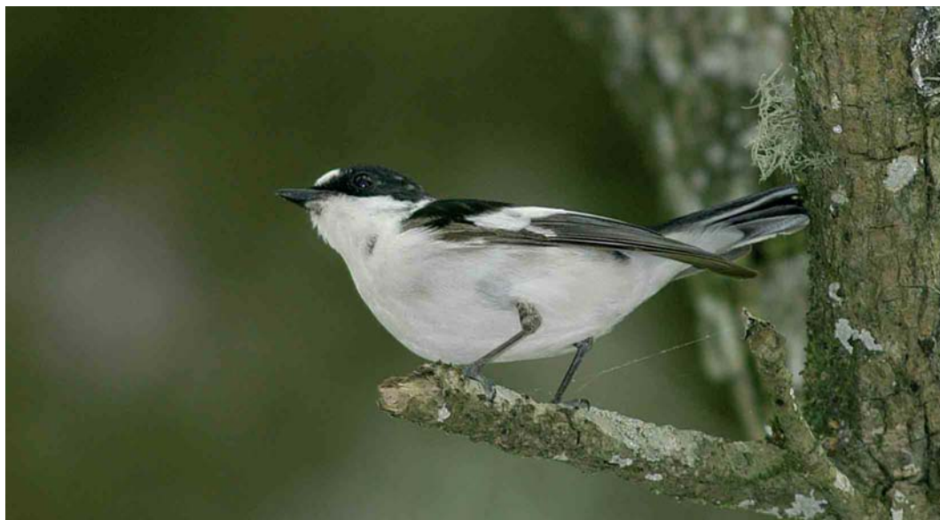
3 Atlas Flycatcher / Atlasvliegenvanger Ficedula speculigera , second-calendar-year male, Beni M'tir, Jendouba, Tunisia, 3 May 2005 (Arnaud B van den Berg)

limited as exceptions occur while, furthermore, ageing is essential as a number of features do not apply for second-calendar-year males. Three of the taxa (Collared, Atlas and Iberian Pied) have an extensive white forehead in adult males. One (Collared) has a complete white collar and three an almost complete white collar (not nominate European Pied). Four have an obvious white rump (not nominate European Pied), which is most obvious in Collared and Atlas. The amount of white on the greater coverts is most extensive, complete and reaching the outermost covert on the bend of the wing in Atlas and Iberian Pied. The extent of white on the tertials is greatest in Iberian Pied. The white patch at the base of the primaries is largest in Collared and smallest (often narrow and not reaching the outer primaries) in nominate European Pied, while Atlas and Iberian Pied are intermediate in this respect. Semi-collared has much white in the outer tail , while Collared, Atlas and Iberian Pied usually have little or no white. Diagnostic taxon features in adult males probably are 1 for Semi-collared, the 'extra' white wingbar formed by white tips of median coverts and the large amount of white in outer tail; 2 for Collared, the complete white collar; 3 for nominate European Pied, the lack of a large white primary patch; 4 for Atlas, the extensive white forehead; and 5 for Iberian Pied, the extensive