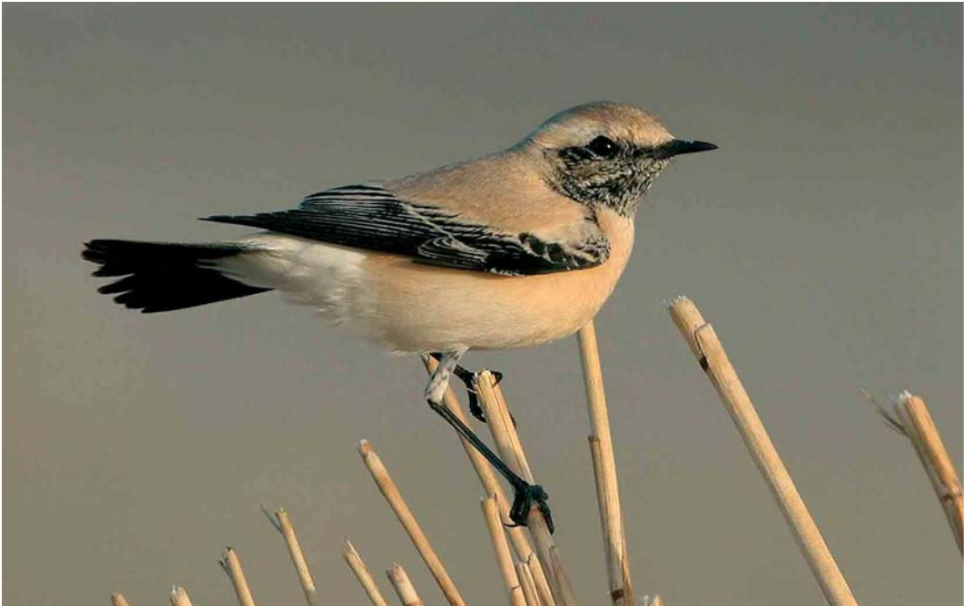
78 Woestijntapuit / Desert Wheatear Oenanthe deserti , adult mannetje, IJmuiden, Noord-Holland, 12 november 2005 (Christiaan Giljam)