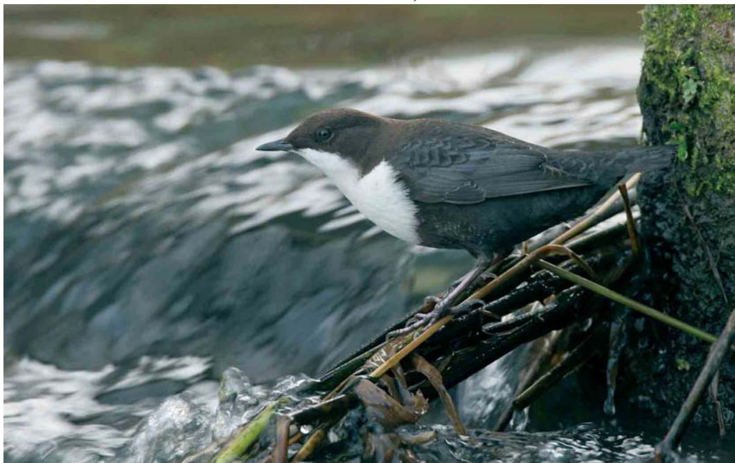
83 Zwartbuikwaterspreeuw / Black-bellied Dipper Cinclus cinclus cinclus , Knardijk, Flevoland, 31 oktober 2005