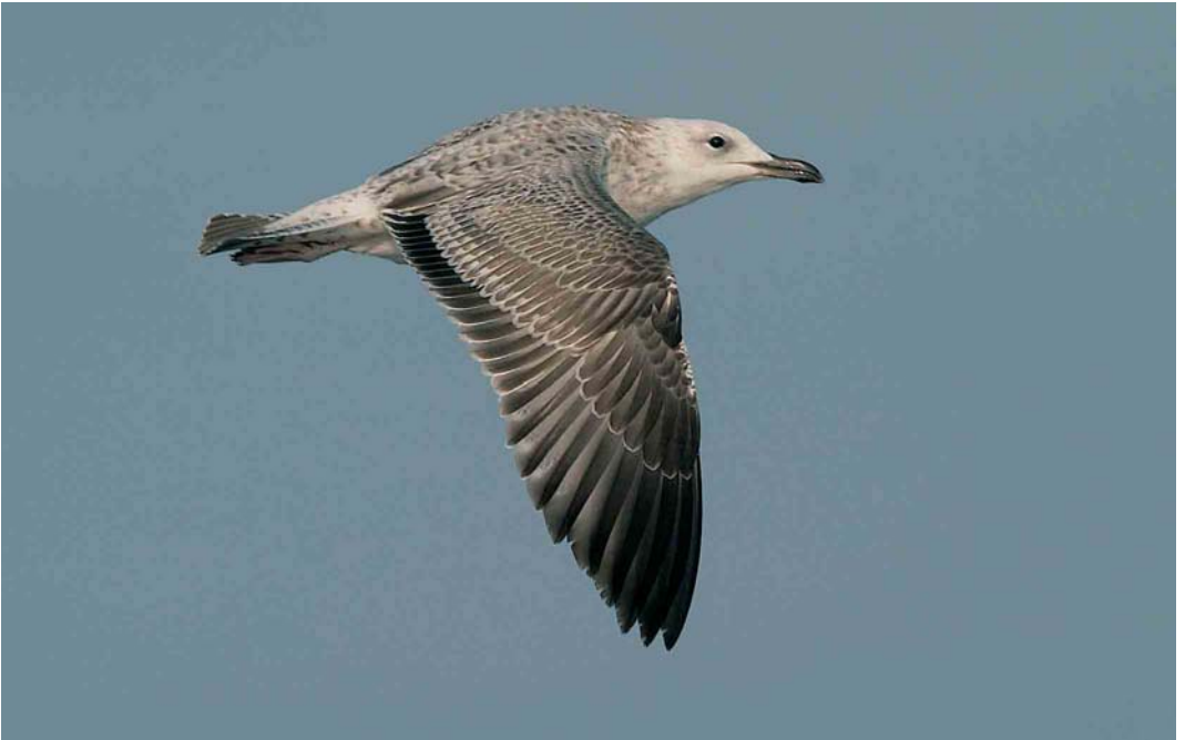
19-20 Caspian Gull / Pontische Meeuw Larus cachinnans , 6 miles off Gijón, Asturias, Spain, 24 September 2005. Note sloping forehead, small white head and long and slender bill. Note pale underwing with pale underside of primaries. Also note narrow wings and small white head. Upperwing pattern shows dark secondaries bordered by whitish borders of greater coverts and dark outerwebs and pale innerwebs ('venetian blind') visible in inner primaries.