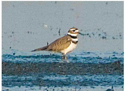
10-11 Killdeerplevier / Killdeer Charadrius vociferus , eerstejaars, Rottige Meente, Friesland, 4 april 2005

rand in veld moeilijk te zien maar op sommige foto's roodachtige tint zichtbaar. Poot grijsachtig groen.