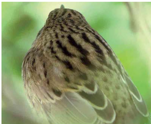
Mystery photograph II (May)

below carefully and identify the birds in the photographs. Solutions can be sent in three different ways: