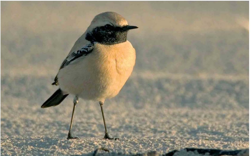
79 Woestijntapuit / Desert Wheatear Oenanthe deserti , mannetje, Vlieland, Friesland, 19 november 2005