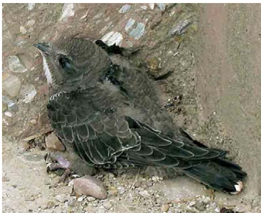
Mystery photograph I (July)