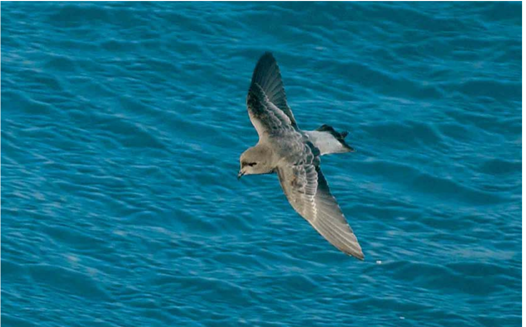
122 Grey-backed Storm-petrel / Grijsrugstormvogeltje Garrodia nereis , off Kerguelen Islands, March 2004 (Hadoram Shirihai)