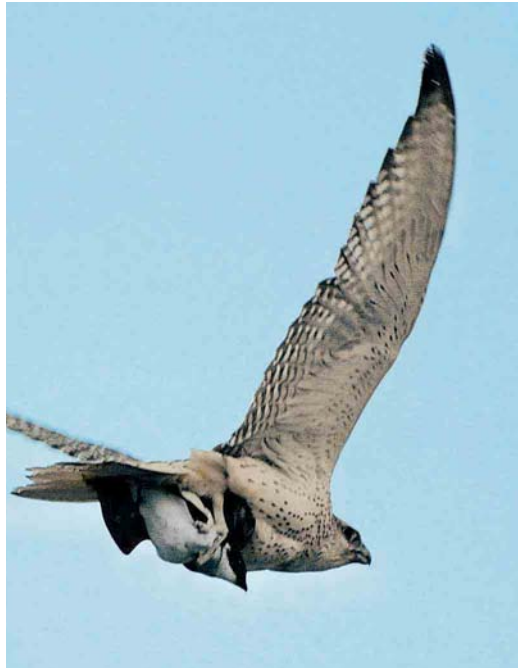
161 Upland Sandpiper / Bartrams Ruitter Bartramia longicauda , La Crau, Bouches-du-Rhône, France, December 2004 cf Dutch Birding 27: 60, 2005 162 Gyr Falcon / Giervalk Falco rusticolus , with Little Auk / Kleine Alk Alle alle , at sea, west of Ramna Stacks, Shetland, Scotland, 12 February 2005 163 Killdeer / Killdeerplevier Charadrius vociferus , Upper Lough Erne, Fermanagh, Northern Ireland, 26 February 2005