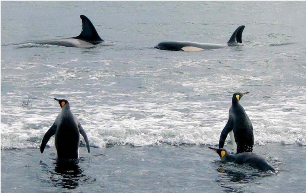
105 King Penguins / Koningspinguïns Aptenodytes patagonicus , 'testing' the water, and Killer Whales / Orka's Orcinus orca patrolling the beach, Crozet Islands (Crozet Base Collection, TAAF)