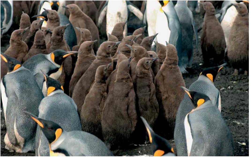
125-126 King Penguins / Koningspinguïns Aptenodytes patagonicus , Ratmanoff Beach, Grande Terre, Kerguelen Islands, March 2004 ( Hadoram Shirihai )