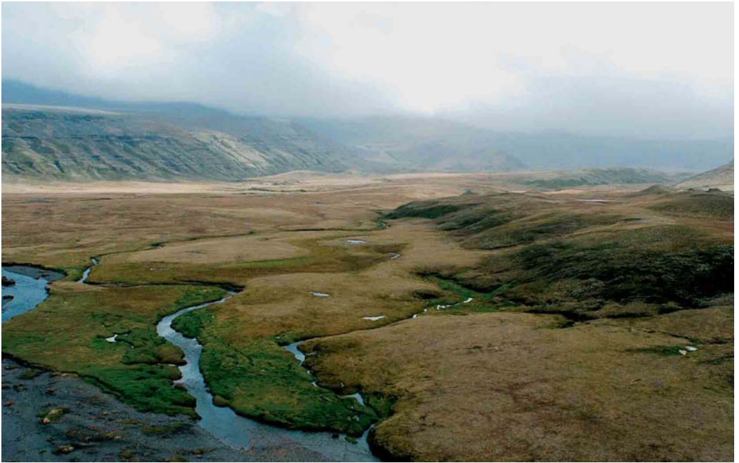
103 Vallée des Branloires, Île de la Possession, Crozet Islands, March 2004 ( Hadoram Shirihai )