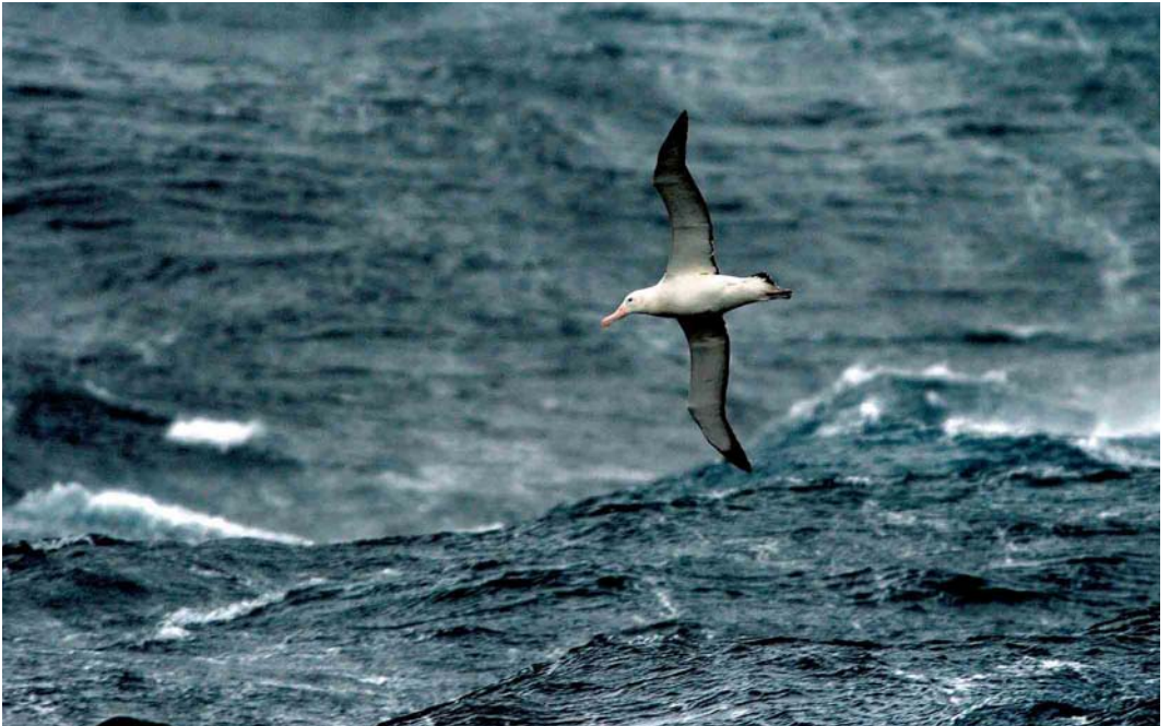
116 Wandering Albatross / Grote Albatros Diomedea exulans , during sea storm with over 10 m high waves, between Crozet and Kerguelen Islands, March 2004 ( Hadoram Shirihai )