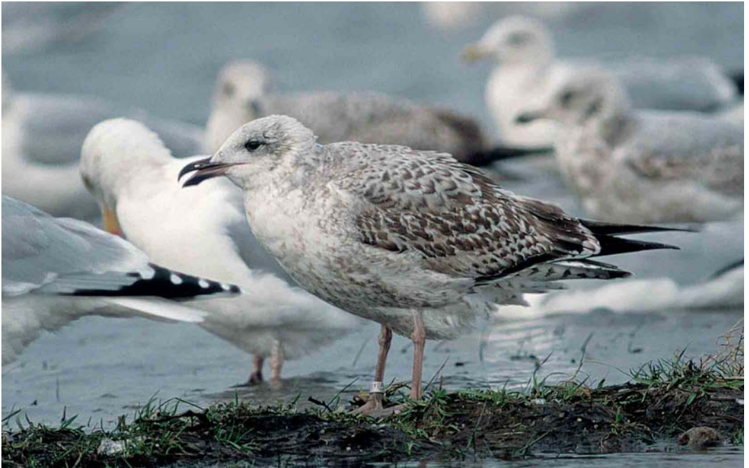
159 European Herring Gull / Zilvermeeuw Larus argentatus , Wijster, Drenthe, Netherlands, 29 January 2002 ( Rudy Offereins )

160 Yellow-legged Gull / Geelpootmeeuw Larus michahellis , Wijster, Drenthe, Netherlands, 4 December 1999 ( Rudy Offereins ). A remarkable individual with rather dark underparts, showing freshly moulted inner greater coverts. Note also that all scapulars have been renewed, showing the same contrasting pattern as the new greater coverts. The long legs and strong, blunt-tipped bill are typical for Yellow-legged Gull.