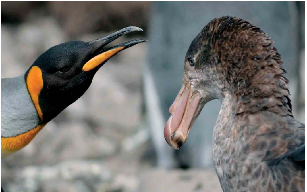
106 King Penguin / Koningspinguïn Aptenodytes patagonicus , adult defending chick against Northern Giant Petrel / Noordelijke Reuzenstormvogel Macronectes halli , Crozet Islands, March 2004