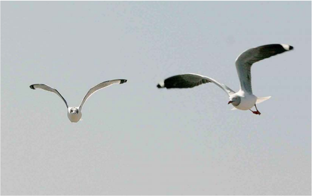
166 Franklin's Gull / Franklins Meeuw Larus pipixcan , adult (left), with Grey-headed Gull / Grijskopmeeuw L. cirrocephalus , Banjul, The Gambia, 8 February 2005