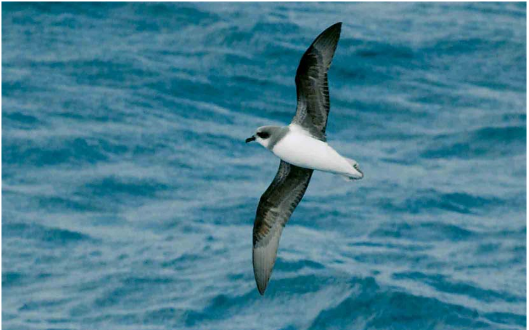
128 Soft-plumaged Petrel / Donsstormvogel Pterodroma mollis , off Kerguelen Islands, March 2004