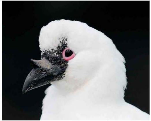
114 Black-faced Sheathbill / Klein IJshoen Chionis minor minor , Crozet Island, March 2004 (Hadoram Shirihai)

Yellow-nosed, Grey-headed, Black-browed and a few pairs of Salvin's Albatross ( T c salvini ) mostly breed on Île de l'Est, Île des Apôtres and Île des Pingouins. In Crozet, 19 species of petrel breed but most of the small burrowing species have been expelled from Île de la Possession and Îles aux Cochons because of the presence of cats and rats. However, several millions of pairs still breed on predator-free islands (Île de l'Est, Île des Pingouins, Îles des Apôtres). Around penguin rookeries, large numbers of Lesser Sheathbills Chionis minor crozettensis , Brown Skuas and the small and pale-eyed recently named subspecies of Kelp Gull Larus dominicanus judithae (Kerguelen Gull) (cf Jiguet 2002) can be found. Crozet Shags P albigenter melanogenis , Antarctic Terns S vittata and Kerguelen Terns S virgata always stay close to the shore, while Kerguelen (or Eaton's) Pintails Anas eatoni live in inland marshes. Sea mammals are also common on Crozet. While the population of Southern Elephant Seal Mirounga leonina is declining, those of Subantarctic Fur Seal Arctocephalus tropicalis and Antarctic Fur Seal A gazella are increasing. The coastal waters are inhabited by Killer Whales Orcinus orca .