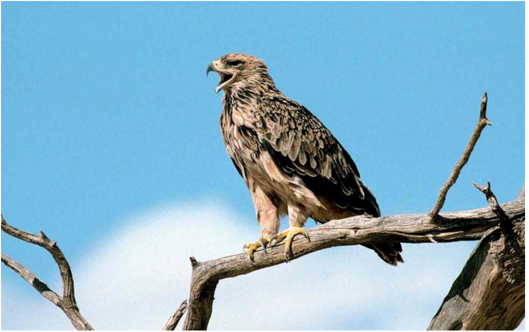
Mystery photograph III (March) Mystery photograph IV (February)