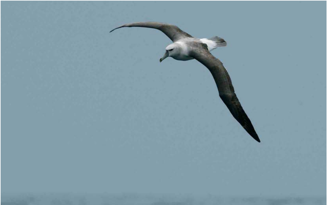
143 Shy Albatross / Tasmaanse Albatros Thalassarche cauta or White-capped Albatross / Aucklandalbatros T. steadi , off Amsterdam Island, March 2004 ( Hadoram Shirihai )