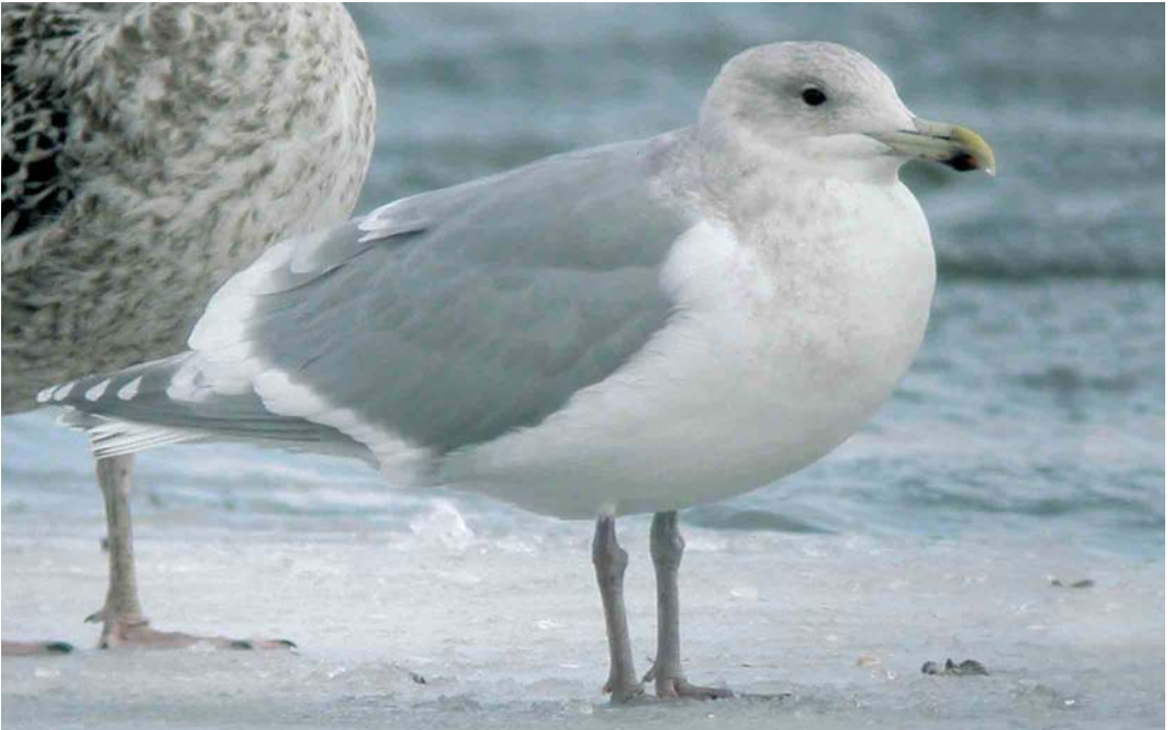
167 Glaucous-winged Gull / Beringmeeuw Larus glaucescens , adult or near-adult, Quidi Vidi Lake, St John's, Newfoundland, Canada, February 2005 (Bruce Mactavish)