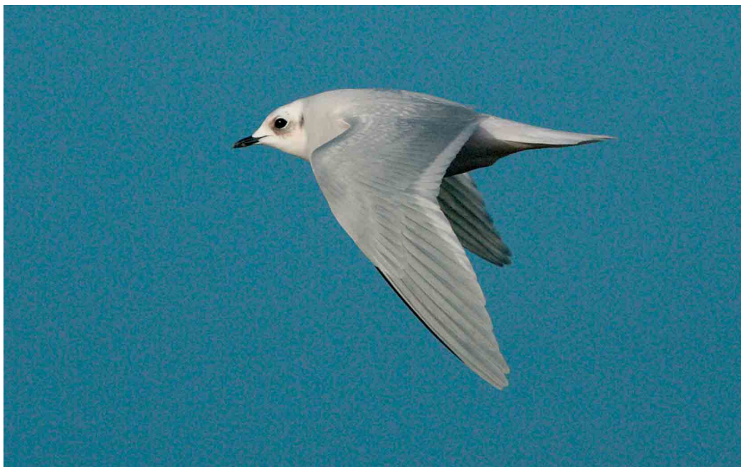
168 Ross's Gull / Ross' Meeuw Rhodostethia rosea , adult, Brow Marsh, Shetland, Scotland, January 2005