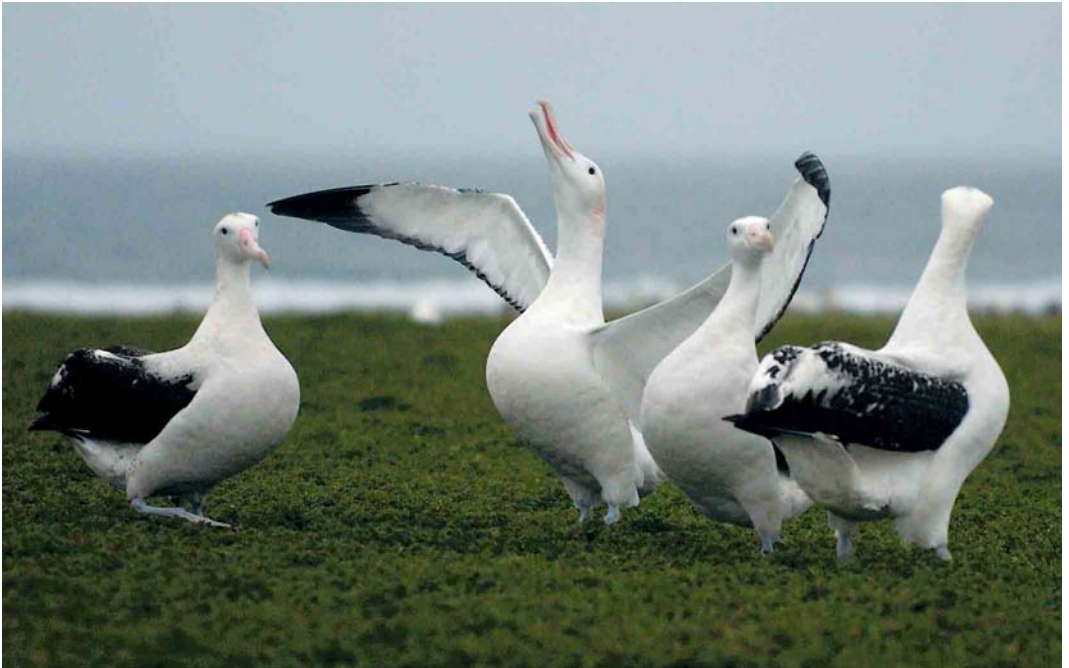
129 Wandering Albatrosses / Grote Albatrossen Diomedea exulans , Ratmanoff Beach, Grande Terre, Kerguelen Islands, March 2004 ( Hadoram Shirihai ) 130 Gentoo Penguin / Ezelspinguïn Pygoscelis papua , Ratmanoff Beach, Grande Terre, Kerguelen Islands, March 2004 ( Hadoram Shirihai ) 131 Wandering Albatrosses / Grote Albatrossen Diomedea exulans , Grande Terre, Kerguelen Islands, March 2004 ( Hadoram Shirihai )