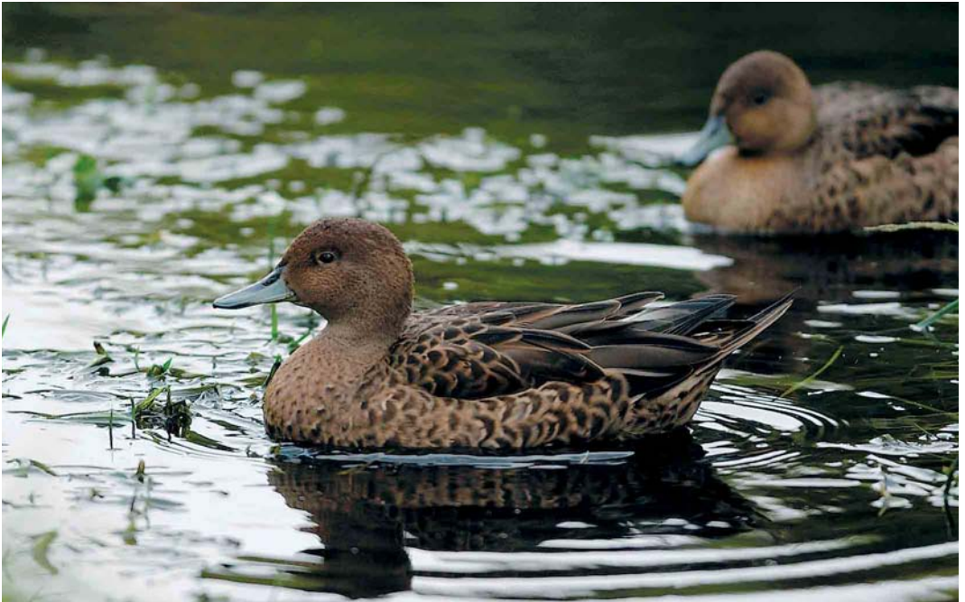
104 Kerguelen Pintails / Kerguelenpijlstaarten Anas eatoni , Crozet Islands, March 2004