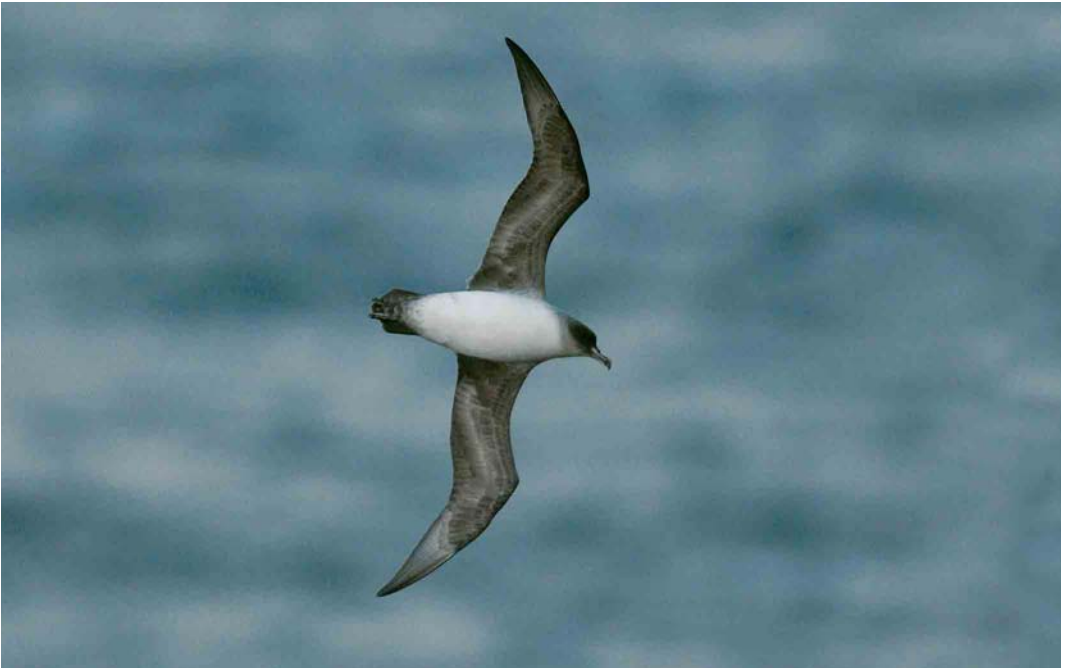
121 Grey Petrel / Bruine Stormvogel Procellaria cinerea , off Kerguelen Islands, March 2004 (Hadoram Shirihai)