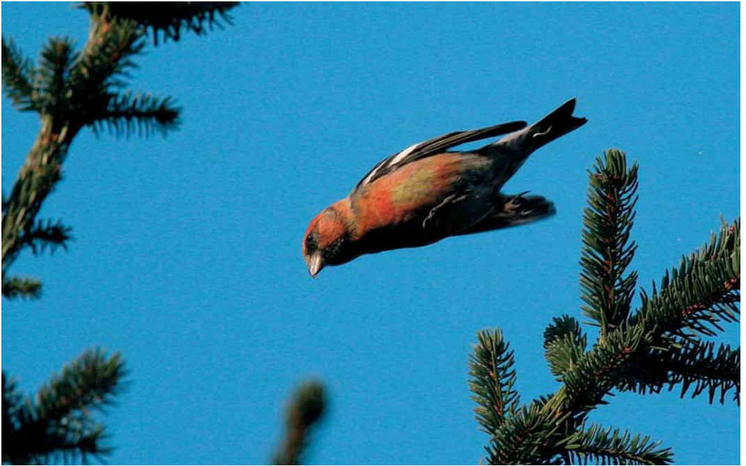
182 Witbandkruisbek / Two-barred Crossbill Loxia leucoptera bifasciata , mannetje, Wateren, Drenthe, februari 2005