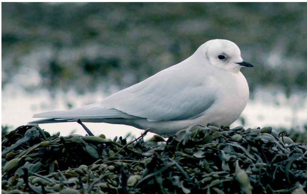
169 Ross's Gull / Ross' Meeuw Rhodostethia rosea , adult, Peterhead, Aberdeenshire, Scotland, February 2005