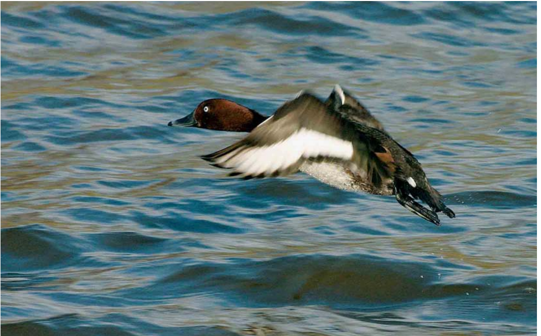
181 Witoogeend / Ferruginous Duck Aythya nyroca , Oude IJssel, Gendringen, Gelderland, 13 januari 2005 (Edwin Winkel)