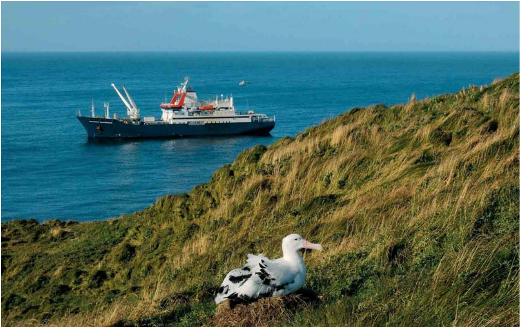
110 Wandering Albatross / Grote Albatros Diomedea exulans , incubating, île de la Possession, Crozet Islands, March 2004 ( Hadoram Shirihai ). In the background, MV Marion Dufresne is in full operation (with its helicopter). Note the open but protected decks which allow observing seabirds in most conditions. 111 White-chinned Petrel / Witkinstormvogel Procellaria aequinoctialis , off Crozet Island, March 2004 ( Hadoram Shirihai ) 112 Southern Rockhopper Penguin / Zuidelijke Rotspinguïn Eudyptes chrysocome filholi , Crozet Islands ( Crozet Base Collection, TAAF )