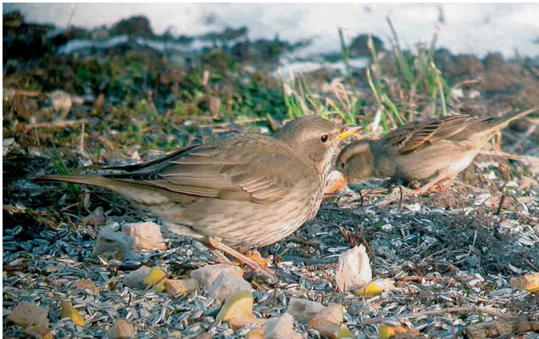
174 Black-throated Thrush / Zwartkeellijster Turdus ruficollis atrogularis , female, with House Sparrow / Huismus Passer domesticus , Husøy, Træna, Nordland, Norway, 13 March 2005