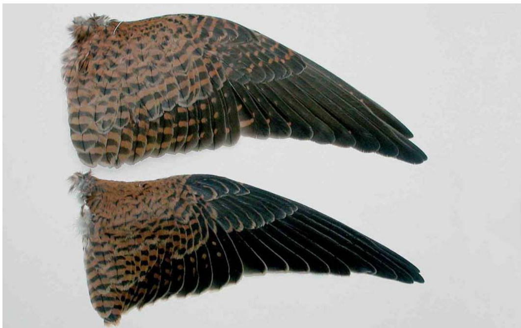
151 Kleine Torenvalk / Lesser Kestrel Falco naumanni , bovenvleugel van eerstejaars vrouwtje (opgeraapt bij Bergen, Noord-Holland, op 5 november 2000) (onder / below) en Torenvalk / Common Kestrel F. tinnunculus , bovenvleugel van adult vrouwtje (verzameld bij Den Hoorn, Texel, Noord-Holland, op 13 maart 1974), Zoologisch Museum Amsterdam (ZMA), Noord-Holland, 1 maart 2005 (Ruud Altenburg). Let op het verschil in patroon op de duimvleugel, handdekveren en buitenste armdekveren / note difference in pattern of alula, primary coverts and outer secondary coverts.