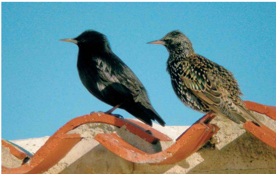
173 Spotless Starling / Zwarte Spreeuw Sturnus unicolor (left), with Common Starling / Spreeuw S vulgaris , Ile de Noirmoutier, Vendée, France, January 2005