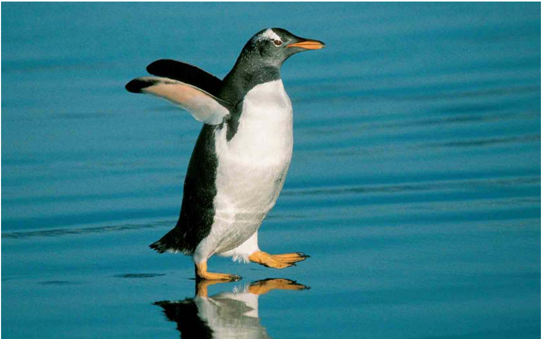
118 Gentoo Penguin / Ezelspinguin Pygoscelis papua , Ratmanoff Beach, Grande Terre, Kerguelen Islands, March 2004 (Olivier Duriez)