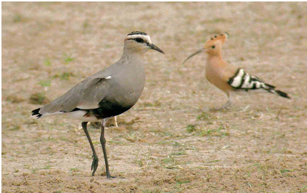
165 Sociable Lapwing / Steppekievit Vanellus gregarius , with Eurasian Hoopoe / Hop Upupa epops , Dubai pivot fields, Dubai, United Arab Emirates, 23 February 2005