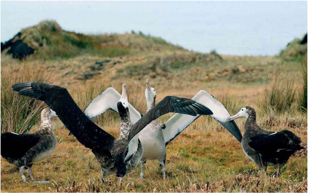
138-139 Amsterdam Albatrosses / Amsterdameilandalbatrossen Diomedea (exulans) amsterdamensis , Amsterdam Plateau, Amsterdam Island, March 2004 ( Hadoram Shirihai )