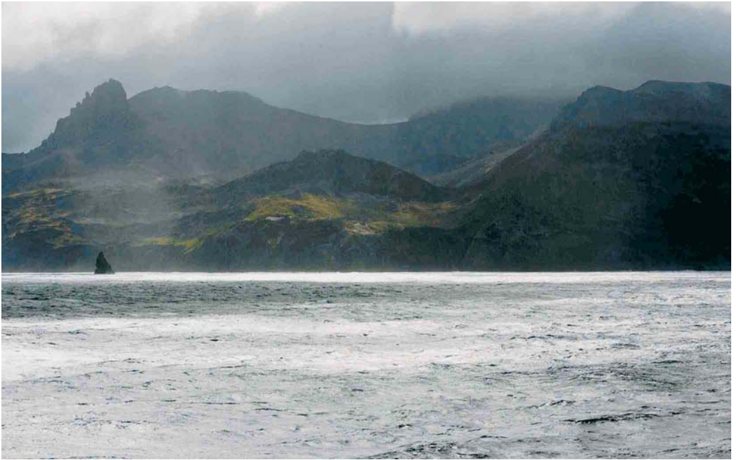
102 Île de l'Est, Crozet Islands, March 2004 ( Hadoram Shirihai ). This island is one of the most diverse and crowded petrel breeding grounds on earth, also mostly inaccessible and fully protected.

Shearwater P assimilis , Flesh-footed Shearwater P carneipes , White-chinned Petrel and White-bellied Storm-petrel F grallaria and where there is a chance to see the endemic subspecies of Salvin's Prion P s macgillivrayi (St Paul Prion or MacGillivray's Prion, which has been proposed to deserve full species status, Worthy & Jouventin 1999) and Amsterdam Albatross. Non-breeding visitors include White-capped Albatross and Sooty Shearwater P griseus .