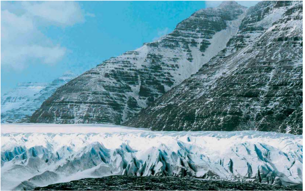
117 Glacier de la Mortadelle, Grande Terre, Kerguelen Islands, September 1997