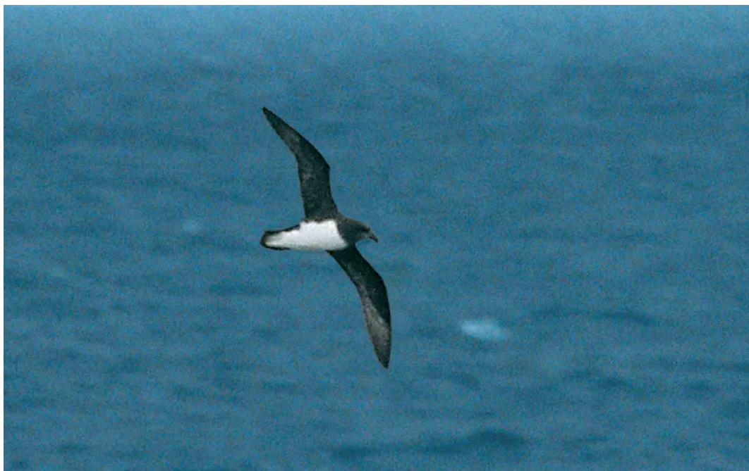
156-158 Magenta Petrel / Magentastormvogel Pterodroma magentae , Southern Pacific Ocean at 45:08.2 S 177:12.9 W, between Bounty Islands and Chatham Islands, 24 December 2004 (Steve N G Howell)