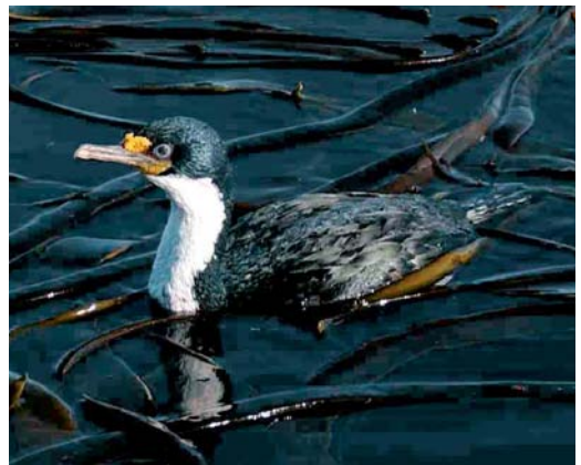
132 Blue Petrel / Blauwe Stormvogel Halobaena caerulea , off Kerguelen Islands, March 2004 ( Hadoram Shirihai ) 133 White-headed Petrel / Witkopstormvogel Pterodroma lessonii , off Kerguelen Islands, March 2004 ( Hadoram Shirihai ) 134 Kerguelen Tern / Kerguelenstern Sterna virgata , Kerguelen Islands, March 2004 ( Hadoram Shirihai ) 135 Kerguelen Shag / Kerguelenaalscholver Phalacrocorax verrucosus , Kerguelen Islands, March 2004 ( Hadoram Shirihai )

go, while Blue Petrel and Grey Petrel mostly inhabit the Golfe du Morbihan. Thanks to their larger size, Great-winged, White-headed and White-chinned Petrels can still breed on the mainland, in the presence of rats and cats. Black-faced Shearwaters C m minor and Brown Skuas are abundant around seabird colonies. On the rocky shores of Kerguelen, shearwaters are able to live also in territories without seabird colonies, foraging on marine invertebrates at low tide like waders. The endemic Kerguelen Shag P verrucosus as well as Kerguelen Pintail, Antarctic Tern and Kerguelen Tern are common throughout the archipelago.