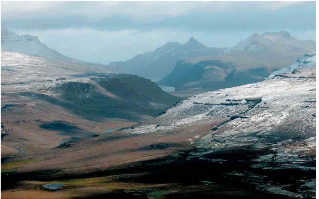
115 Landscape around the Golfe du Morbihan, Kerguelen Islands, March 2004 ( Hadoram Shirihai )