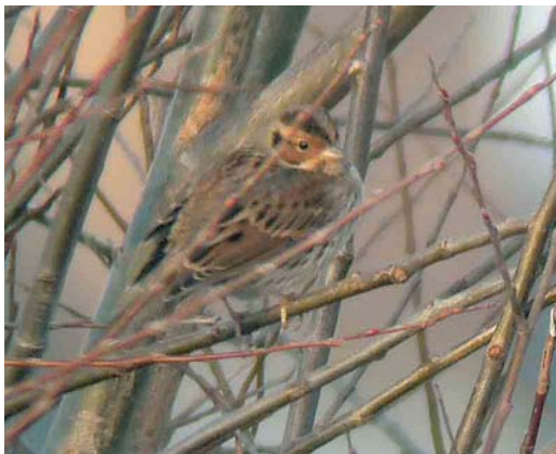
192 Dwerggors / Little Bunting Emberiza pusilla , Gent, Oost-Vlaanderen, 1 februari 2005