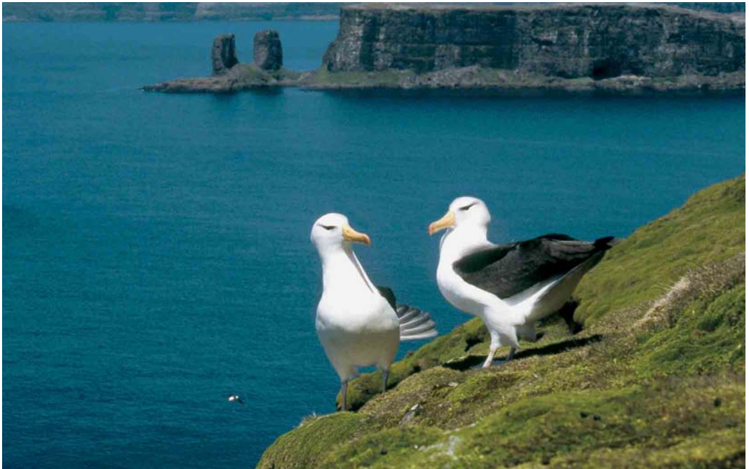
127 Black-browed Albatrosses / Wenkbrauwalbatrossen Thalassarche melanophrys , displaying in front of the 'Arche', Baie de l'Oiseau, Kerguelen Islands, 1997 (Olivier Duriez)