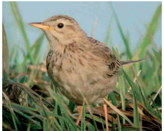
188 Middelste Bonte Specht / Middle Spotted Woodpecker Dendrocopos medius , Schoonheten, Overijssel, 22 januari 2005 ( Lucien Brinkhof ) 189 Taigaboomkruiper / Eurasian Treecreeper Certhia familiaris , Hilversum, Noord-Holland, 23 januari 2005 ( Jack Folkers ) 190 Japanse Pestvogel / Japanese Waxwing Bombycilla japonica , Wageningen, Gelderland, maart 2005 ( Jack Folkers ) 191 Grote Pieper / Richard's Pipit Anthus richardi , Hoogkerk, Groningen, 19 januari 2005 ( Martijn Bot )

dood werd aangetroffen) en van 6 tot 26 februari in de Vissershaven van IJmuiden, Noord-Holland. Daarnaast werden nog 12 andere gezien. De Zwarte Zeekoet Cephus grylle van West-Terschelling, Friesland, bleef de gehele periode. De Kleine Alk Alle alle van de Trintelhaven, Flevoland, hield het vol tot 22 januari. Papegaaiduikers Fratercula arctica vlogen op 12 januari langs Katwijk aan Zee, Zuid-Holland, op 17 januari langs Vlieland, Friesland, en op 25 januari langs Westkapelle. Dode exemplaren werden gevonden op 13 februari op Schiermonnikoog, op 15 februari op Rottumeroog, Groningen, en op 16 februari bij Westkapelle.