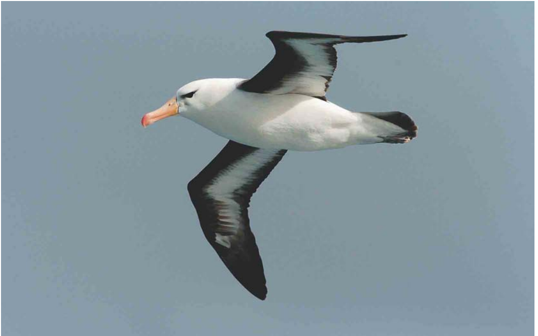
119 Black-browed Albatross / Wenkbrauwalbatros Thalassarche melanophrys , off Kerguelen Islands, March 2004