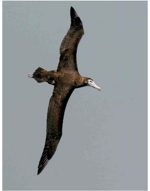
140-142 Amsterdam Albatross / Amsterdameilandalbatros Diomedea (exulans) amsterdamensis , Amsterdam Plateau, Amsterdam Island, March 2004 ( Hadoram Shirihai )