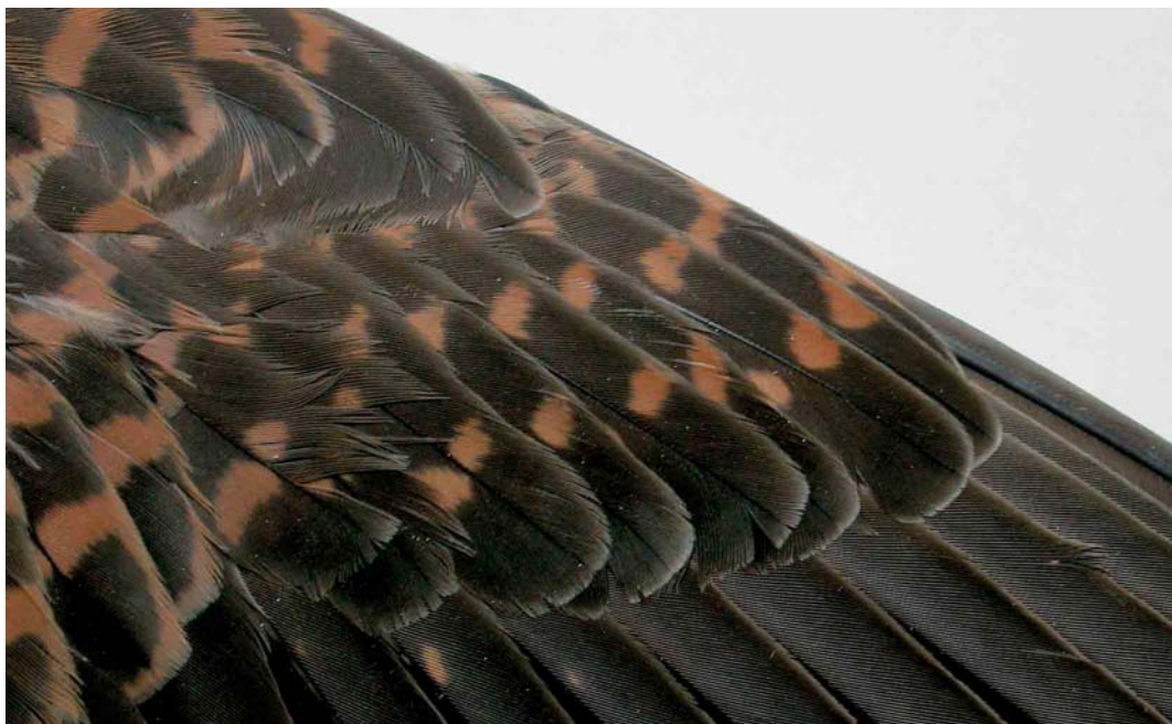
154 Torenvalk / Common Kestrel Falco tinnunculus , detail van bovenvleugel van adult vrouwtje (verzameld bij Den Hoorn, Texel, Noord-Holland, op 13 maart 1974), Zoölogisch Museum Amsterdam (ZMA), Noord-Holland, 1 maart 2005 (Ruud Altenburg).