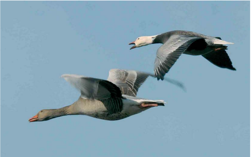
180 Kleine Sneeuwgans / Lesser Snow Goose Anser caerulescens caerulescens , adult, blauwe vorm, met Grauwe Gans / Greylag Goose A anser , Haarlemmerliede, Noord-Holland, 18 februari 2005