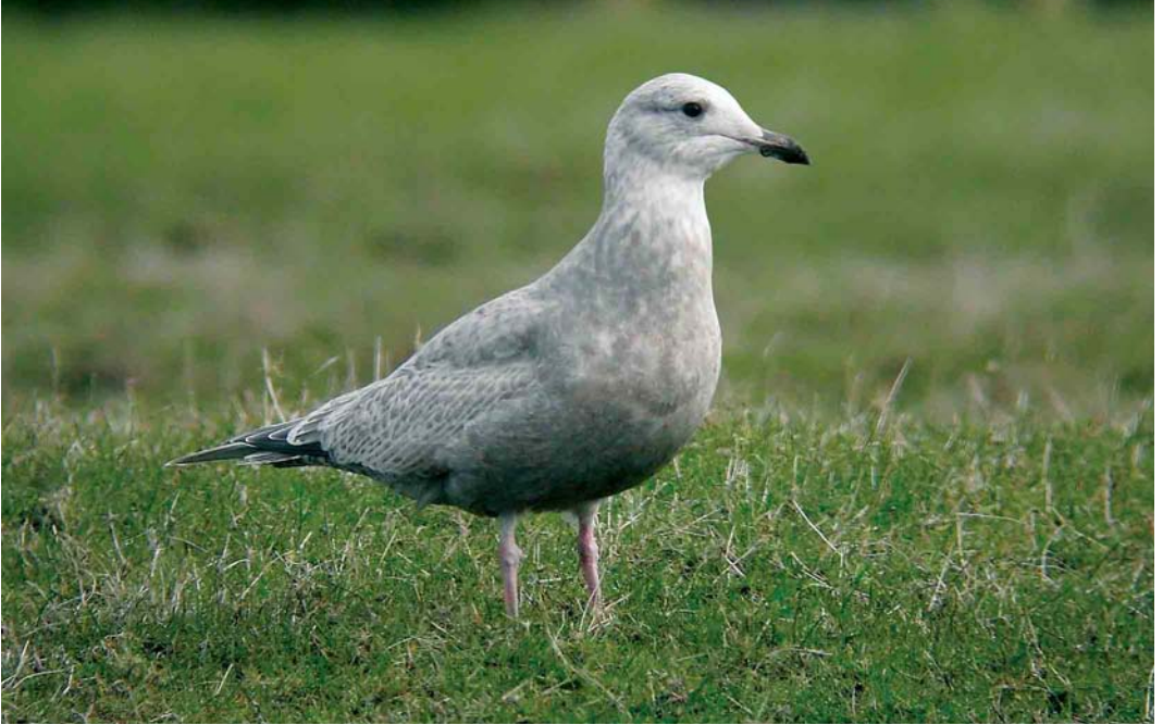
170 Thayer's Gull / Thayers Meeuw Larus thayeri , first-winter, Barnatra near Belmullet, Mayo, Ireland, 13 March 2005 (Paul Hackett) 171 Kumlien's Gull / Kumliens Meeuw Larus glaucooides kumlieni , first-winter, Bullock Harbour, Dublin, Ireland, 29 January 2005 (Paul & Andrea Kelly/irishbirdimages.com) 172 Forster's Tern / Forsters Stern Sterna forsteri , with Black-headed Gull / Kokmeeuw Larus ridibundus , Nimmo's Pier, Galway, Ireland, 14 February 2005 (Paul & Andrea Kelly/irishbirdimages.com)