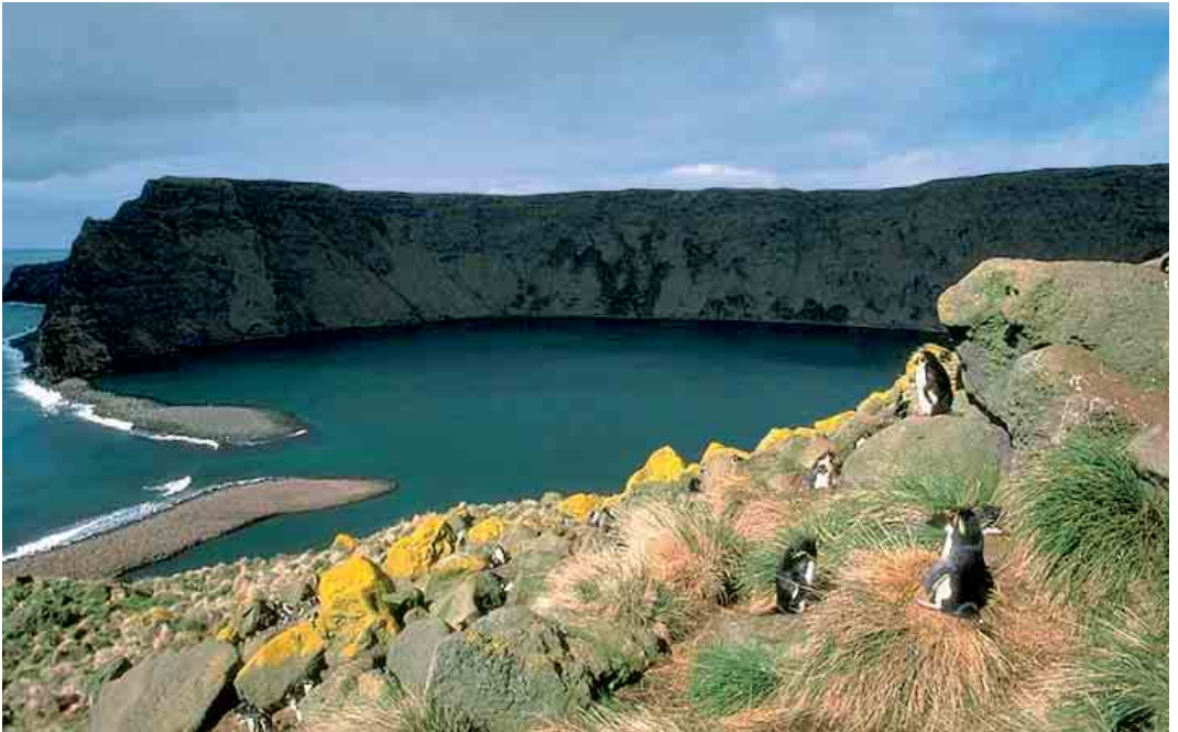
144 St Paul Island, 1995 ( Dominique Filippi ). A rookery of Northern Rockhopper Penguins / Noordelijke Rotspinguïns Eudyptes chrysocome moseleyi dominates the crater of this island.