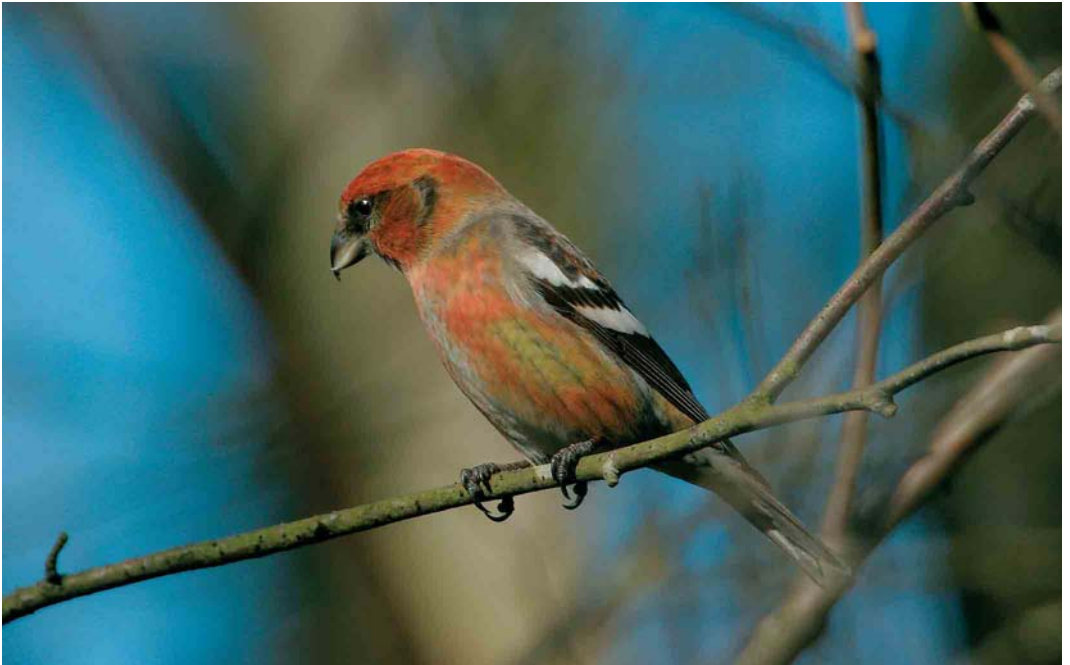
183 Witbandkruisbek / Two-barred Crossbill Loxia leucoptera bifasciata , mannetje, Wateren, Drenthe, 9 februari 2005 (Roland Jansen)