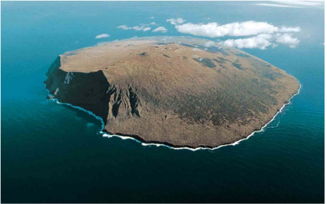
136 General view of Amsterdam Island, with the Falaises d'Entrecasteaux on the left

137 Falaises d'Entrecasteaux, Amsterdam Island, 1995. These 700 m-high cliffs, covered with tussock grass, host the world's biggest colony of Yellow-nosed Albatross Thalassarche chlororhynchos .