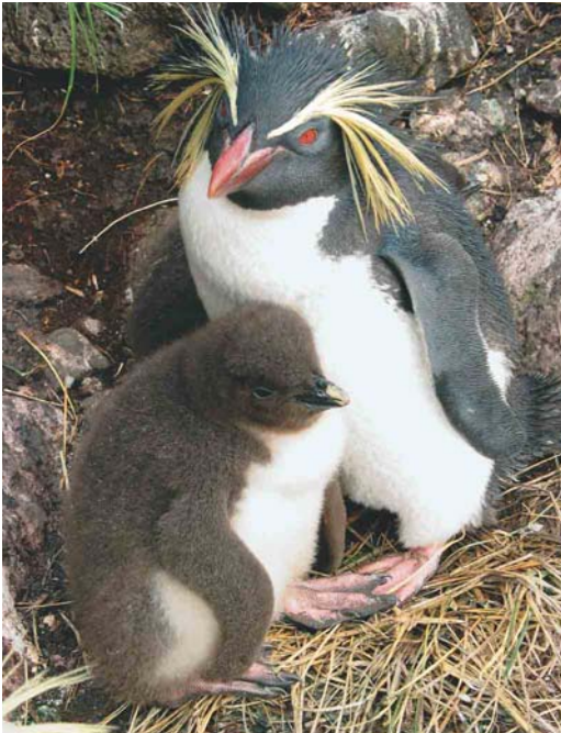
147 Northern Rockhopper Penguins / Noordelijke Rotspinguijn Eudyptes chrysolome moseleyi , St Paul Island