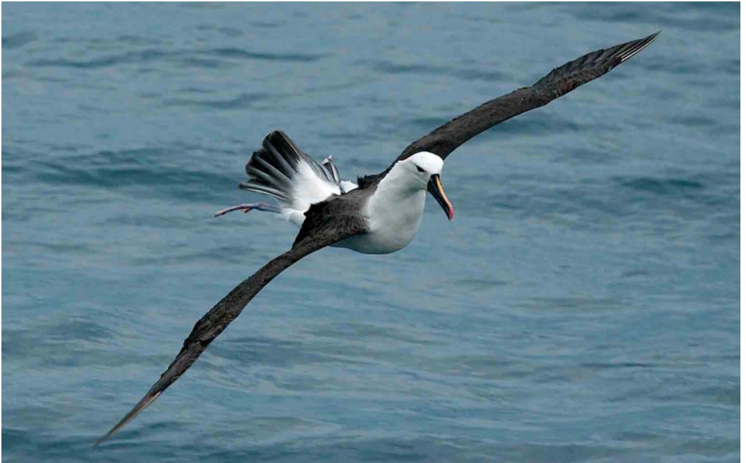
146 Indian Yellow-nosed Albatross / Indische Geelneusalbatros Thalassarche chlororhynchos carteri , off Amsterdam Island, March 2004 (Hadoram Shirihai)