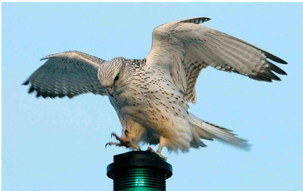
164 Gyr Falcon / Giervalk Falco rusticolus , at sea, west of Ramna Stacks, Shetland, Scotland, 12 February 2005