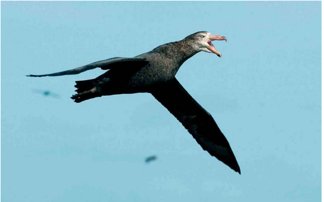
123 Northern Giant Petrel / Noordelijke Reuzenstormvogel Macronectes halli , Kerguelen Islands, March 2004