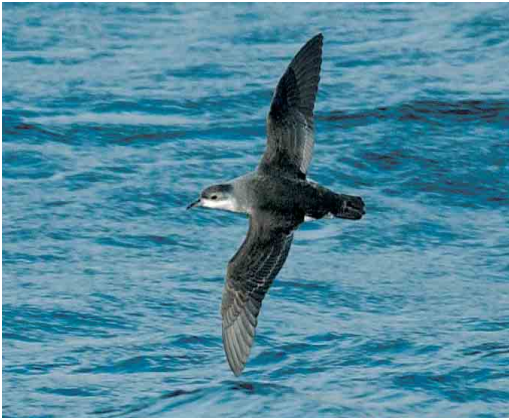
113 Little Shearwater / Kleine Pijlstormvogel Puffinus assimilis elegans , Crozet Island, March 2004 (Hadoram Shirihai)