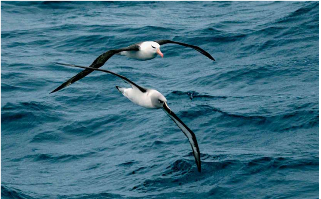
120 Black-browed Albatross / Wenkbrauwalbatros Thalassarche melanophrys (behind) and Grey-headed Albatross / Grijskopalbatros T. chrysostoma (front), off Kerguelen Islands, March 2004 (Hadoram Shirihai)