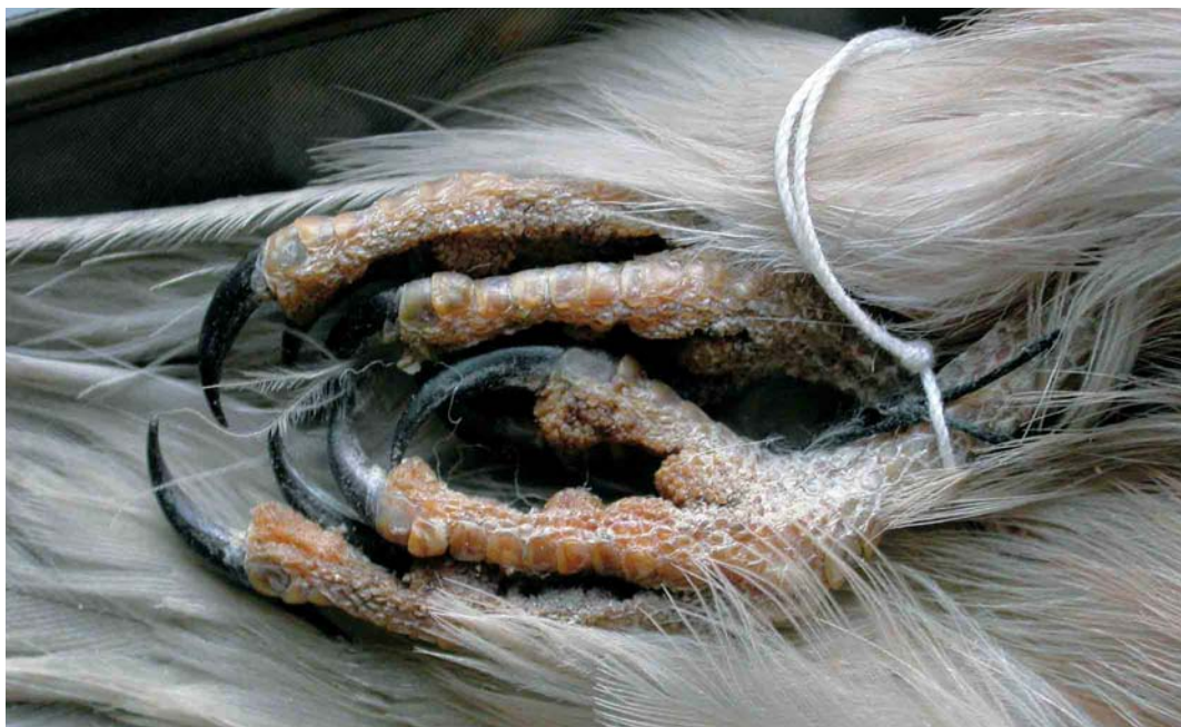
155 Torenvalk / Common Kestrel Falco tinnunculus , tenen en nagels van adult mannetje (verzameld op 2 december 1969 bij Rhenen, Utrecht) Zoölogisch Museum Amsterdam (ZMA), Noord-Holland, 28 februari 2005. Let op de donkere nagels / note dark claws.