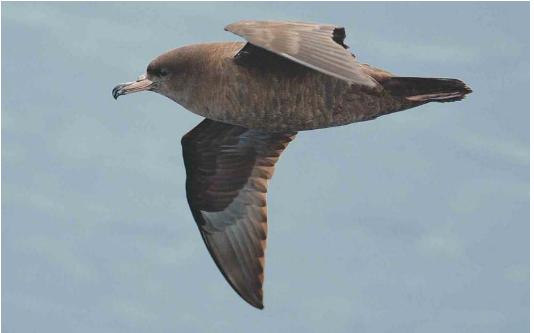
145 Flesh-footed Shearwater / Australische Grote Pijlstormvogel Puffinus carneipes , off St Paul Island, March 2004 (Hadoram Shirihai)