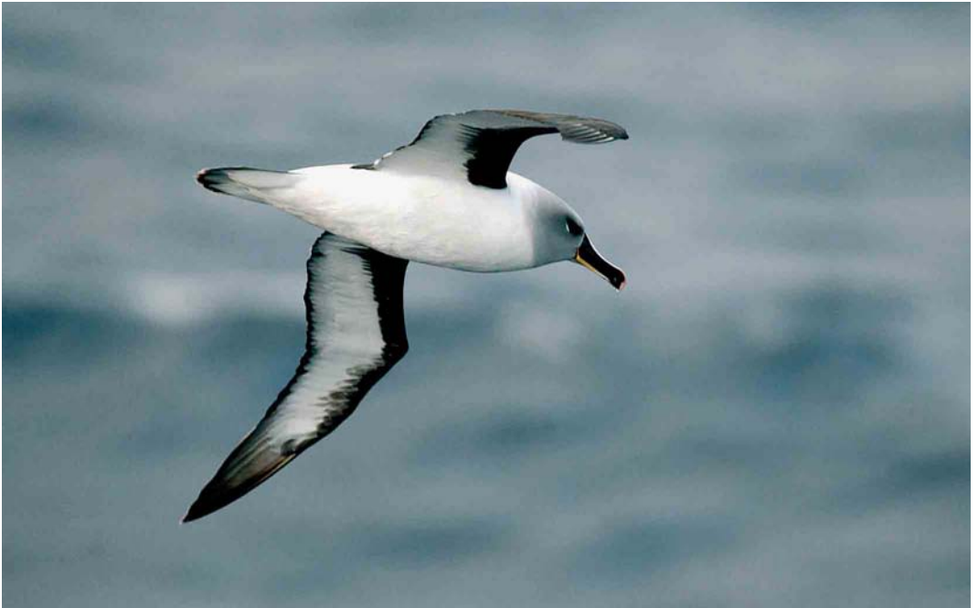
124 Grey-headed Albatross / Grijskopalbatros Thalassarche chrysostoma , off Kerguelen Islands, March 2004